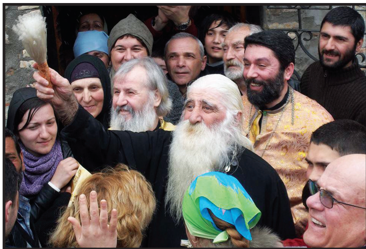
მამა გიორგი (ბასილიძე), მამა იოანე (ოლარი), მამა გიორგი (პავლოვი).