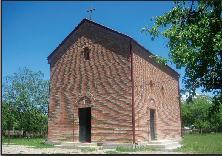
სოფ. სართიჭალა. მდ. ივრის მარჯვენა სანაპირო. წმ. ნიკოლოზ საკვირველმოქმედის სახელობის ეკლესია