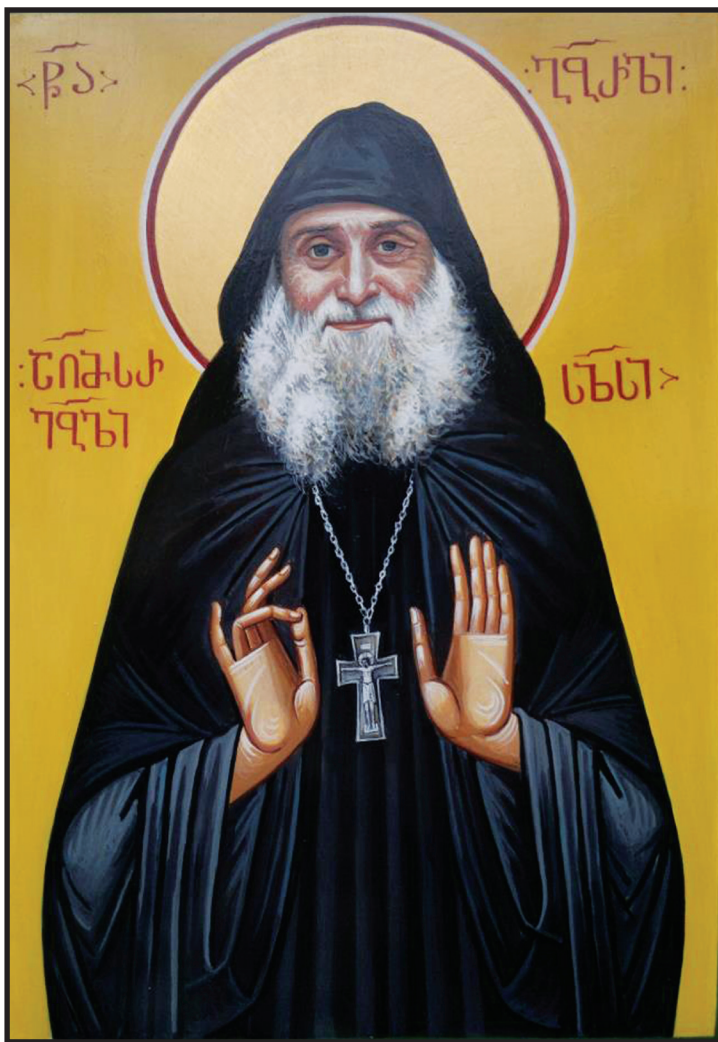
ნმ. არქიმანდრიტი გაბრიელი, აღმსარებელი და სალოსი.