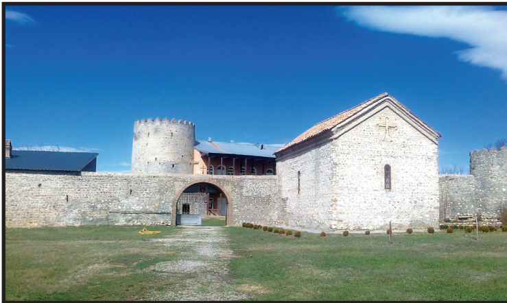
სოფ. ხაშმი. მდ. ივრის მარცხენა სანაპირო. წმ. ნიკოლოზ საკვირველმოქმედის სახელობის ეკლესია.