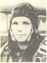
იური გაგარინი კაცობრიობის ისტორიაში პირველი გაფრინდა კოსმოსში 1961 წლის 12 აპრილს ხომალდ „ვოსტოკით“.