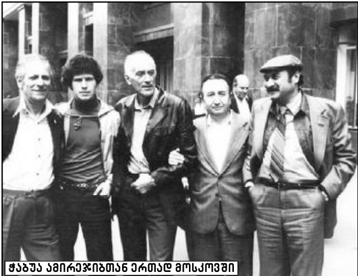
ჭაბუა ამირაჯიბთან ერთად მოსკოვში

ქართველ პოეტთან, რომელსაც სულ ახლახან სახალხო პოეტის საპატიო სახელი მიენიჭა.