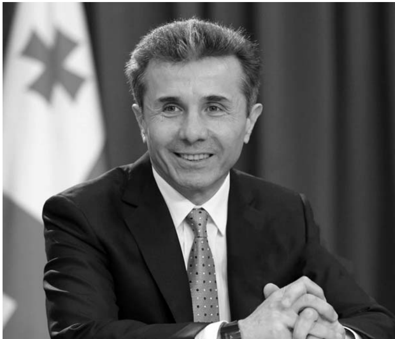
გუშინ სოცსელეებში გავრცელებულ სტატუსს გულიანად ჩაუვუკვიე. აღმოჩნდა: