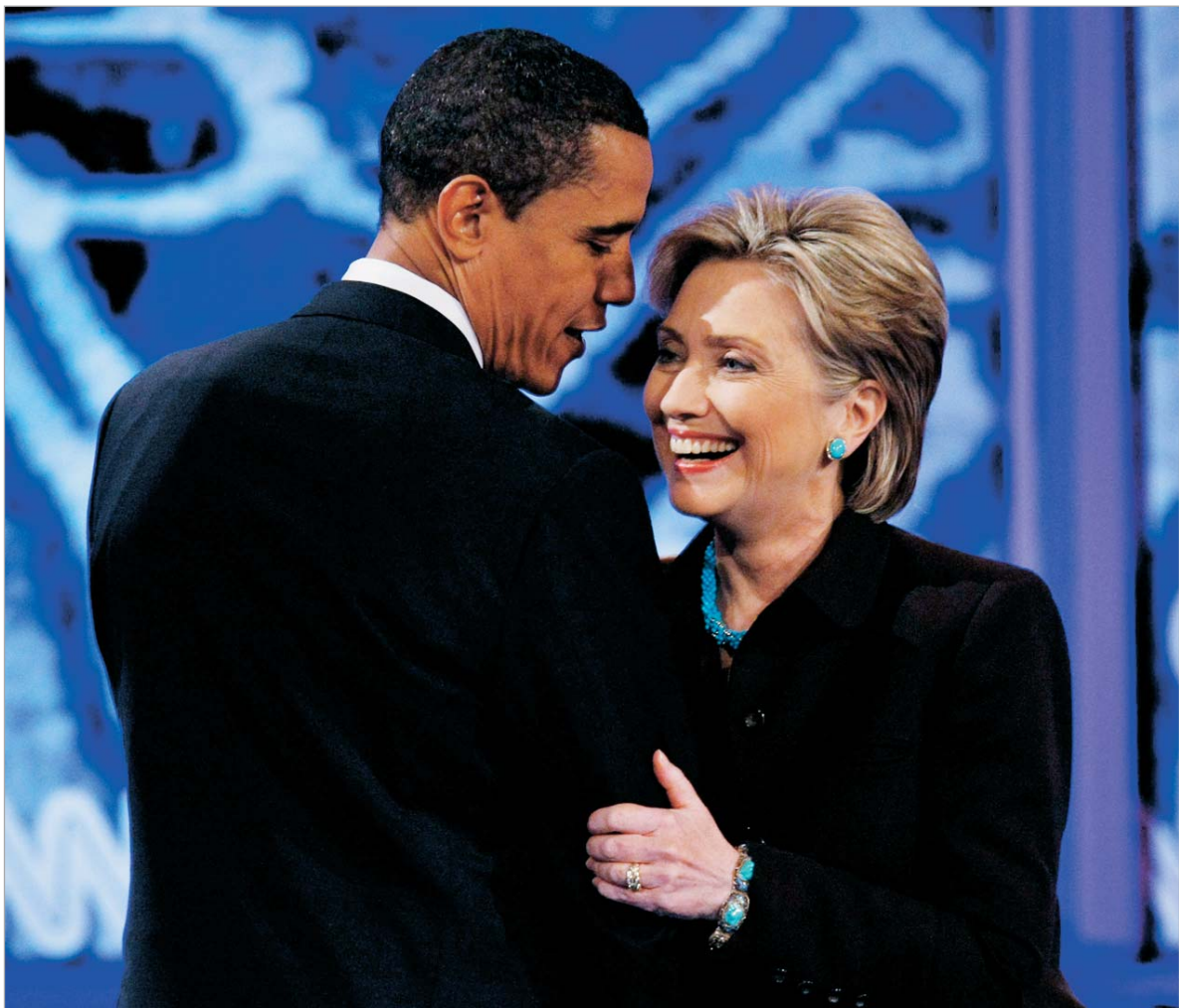
ობამამ თავის ყოფილ მეტოქეს, შესაძლოა, სახელმწიფო მდივნის პოსტი შესთავაზოს