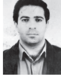
დაიღუპა 1993 წლის 27 ოქტომბერს სოხუმში გამართული ბრძოლის დროს ვეფხია მძიმედ დაიჭრა და იქვე გარდაიცვალა.

დაიბადა ასპინძის რაიონის სოფელ ვარგაში 1965 წლის 5 დეკემბერს. 1979 წელს დაამთავრა ვარგაის რევანლიანი სკოლა, ხოლო შემდეგ სწავლა განაგრძო თბილისის კლესელიძის სახელობის სამხედრო სასწავლებელში. 1983-1988 წლებში სწავლობდა ქ.ყაზანის უმაღლეს სამხედრო სასწავლებელში. 1988-1991 წლებში მსახურობდა გერმანიაში, როგორც ოფიცერი, ხოლო 1991-1993 წლებში, საქართველოს შეიარაღებულ ძალებშია, კერძოდ, ქალაქ გორში – სატანკო ნაწილის მეთაურის მოადგილის თანამდებობაზე. 1993 წლის 27 ოქტომბერს სოხუმში გამართული ბრძოლის დროს ვეფხია მძიმედ დაიჭრა და იქვე გარდაიცვალა. დაკრძალულია ქალაქ ხაშურში.