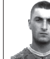
დაიღუპა 1994 წლის 21 აპრილს ასპინძის რაიონის სოფელ მირაშხანში, 1994-2004 წლებში სწავლობდა ამავე სოფლის საშუალო სკოლაში, 2006 წელს განვეული იქნა სავალდებულო სამხედრო სამსახურში. მსახურობდა 41-ე ბრიგადის მე-4 ქვეით ბატალიონში „კაპრალად“, იყო მეტყვიამფრქვევე. დაიღუპა 2008 წლის 9 აგვისტოს საქართველო-რუსეთის ომის დროს გორის მისადგომებთან. დაკრძალულია სოფელ მირაშხანში.

დაიბადა 1988 წლის 21 აპრილს ასპინძის რაიონის სოფელ მირაშხანში, 1994-2004 წლებში სწავლობდა ამავე სოფლის საშუალო სკოლაში, 2006 წელს განვეული იქნა სავალდებულო სამხედრო სამსახურში. მსახურობდა 41-ე ბრიგადის მე-4 ქვეით ბატალიონში „კაპრალად“, იყო მეტყვიამფრქვევე. დაიღუპა 2008 წლის 9 აგვისტოს საქართველო-რუსეთის ომის დროს გორის მისადგომებთან. დაკრძალულია სოფელ მირაშხანში.