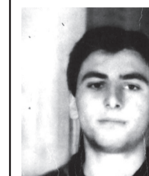
დაიღუპა 1993 წლის 2 ივლისს, ტამიშთან, რუსების დესანტის გადმოსხმის დროს გამართული სამკვდრო-სასიცოცხლო ბრძოლის დროს იგი სასიკვდილოდ დაიჭრა და სამშობლოს ზვარაკად შეენირა.

დაიბადა 1972 წლის 11 იანვარს ასპინძის რაიონის სოფელ ნაქალაქეში. 1979 წელს შევიდა და 1989 წელს დაამთავრა ამავე სოფლის საშუალო სკოლა და სწავლა განაგრძო თბილისის პროფესიულ სასწავლებელში კულინარიის განხრით, რომლის დამთავრებისთანავე განვეული იქნა სავალდებულო სამხედრო სასწავლებელში. თავდაპირველად მსახურობდა ქალაქ ტყეშულის ეროვნულ გვარდიაში, მოგვიანებით გადაჰყავთ ახალციხის ეროვნულ გვარდიაში, საიდანაც იწვევენ აფხაზეთში და იბრძვის სხვადასხვა მიმართულებით. 1993 წლის 2 ივლისს, ტამიშთან, რუსების დესანტის გადმოსხმის დროს გამართული სამკვდრო-სასიცოცხლო ბრძოლის დროს იგი სასიკვდილოდ დაიჭრა და სამშობლოს ზვარაკად შეენირა.