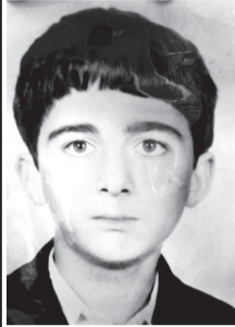
დაკრძალულია დაბა ასპინძაში.

დაიბადა 1972 წელს ასპინძის რაიონის დაბა ასპინძაში. 1989 წელს დაამთავრა დაბის საშუალო სკოლა, ხოლო 1990 წელს განვეული იქნა სავალდებულო სამხედრო სამსახურში, ჯერ კიდევ არსებულ საბჭოთა კავშირის შეიარაღებულ ძალებში, სადაც მხოლოდ ორიოდე კვირა დაჰყო და მშობლიურ კერას დაუბრუნდა. ეროვნული გვარდიის შექმნისთანავე შედის მის რიგებში. მსახურობდა ტყვეულის ბატალიონში. 1991 წლის აგვისტოში გვარდიის სარდლობის ბრძანებით იგზავნება ჯერ შენაბადაზე, შემდეგ – თერჯოლის ეროვნულ გვარდიაში, იქიდან – ცხინვალის რეგიონში, აგვისტოში კი სოხუმიში. 1992 წლის 24 აგვისტოს ერთ-ერთ ბრძოლაში მამუკა ზურაბაშვილი მძიმედ დაჭრილი იქვე გარდაიცვალა. დაკრძალულია დაბა ასპინძაში.