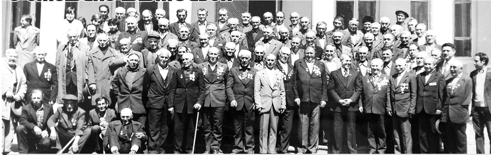
დიდი სამამულო ომის მონაწილეები. დაბა ასპინძა. სურათი გადაღებულია 1978 წელს.