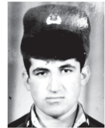
დაკრძალულია სოფელ ნიჯგორში.