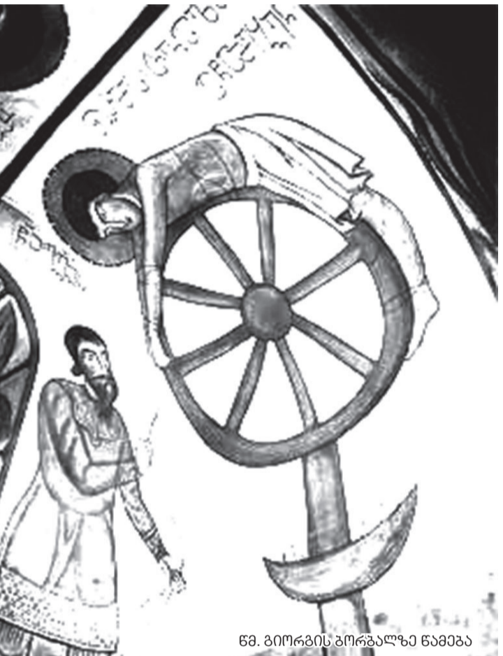
წმ. გიორგის ბორბალზე წამება

იყო ზეცაში საშინელი გრგვინვა. ღვთის წმინდა ანგელოზი გარდამოვიდა ცოდან უამრავი ხალხის სახილველად „გამათლიანა წმინდანის დაფლეთილი სხეული, განკურნა წყალღებანი მისნი, აღადგინა, მოეხვია და ამბოროს უყო, უთხრა: „უფალი შენთანაა, მრავალი ტანჯვისა და წამების დამთმენი იქნება კვალად, რათა განამზენეო და განაძლიერო ნათესავი ქრისტეანთა. შემდეგ მოვიდა ამისა მრავალფერი სატანჯველი აღესრულა მთავარმონაშის მიმართ, ისე, როგორც მას აუწყა ანგელოზმა უფლისამან: ადუღებულ საკირეში ჩააგდეს 3 დღე-ღამის განმავლობაში, მტარვალები ფიქრობდნენ, რომ ამ ნაშენის შედეგად ძვალს ხორცი განმორდებოდა, გაეფარებოდა სილინის ქოშები ჩააცვებს, რკინის ცხელი მარნეებით ადუღებდნენ სხეულზე ხორცებს, ძროხის ძარღვებით დაწნული მათრახებით სცემდნენ და ფლეთდნენ მას და სხვა უამრავი მრავალფერი სატანჯველით განცადეს იგი, ხოლო დიოკლეტიანემ, მისმა მეგობარმა მანეტიუსმა და მტარვალებმა შედეგად მიიღეს ის, რომ მთელს იმპერიაში ათითასობით ადამიანი მხნე იქნა და გახდა ქრისტიანი. მათ შორის „ანატოლიის სტრატიატი“. მან თანამებრძოლთა და სახელეულთან ერთად ირწმუნა ქრისტე (სტრატიატი)“ — ერთ-ერთი ლეგიონის მთავარსარდალი. ასევე ერთი მონათმოქმედი და, ამავე დროს, შეუღლებული მეურნე მონაღვთისა „ლელიკერი“, რომელსაც წმინდა გიორგიმ განუყოცხლა მკვდარი ნაშენი ხარი. ამისათვის ის მტარვალებმა საშინლად აწამეს და მოუხედავად იმისა, რომ ის არ იყო მონათლული ქრისტეს რჯულით, წმინდანის ლოცვა-ვედრებით, უფლის ნებით, ის წამების დროს თავის სისხლში განინათლა და მონაშენი დასს შეუერთდა. თვით იმპერატორ დიოკლეტიანეს მეუღლეც, დედოფალი ალექსანდ-