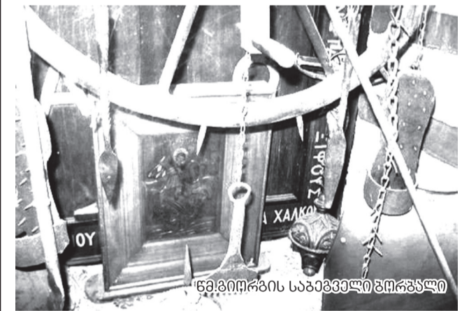
წმ. გიორგის საბამევილი ბორბალი

რა გახდა ქრისტიანე და მთელი ერის წინაშე აღიარა მხოლოდ ერთი ქვეყნის ღმერთი, ყოვლადწმინდა სამება. შემდგომო მრავალფეროთა სატანჯველთა, რომელიც არ არიან აღწერილი ამ წერილში, მიიყვანეს დიდმონაშენი გიორგი „ადგილსა მას წამებისასა“. (თვესა ძვ. სტ. 23 აპრილსა, ახ. სტ. 6 მაისსა — და ეტყოდა მებლმეებს, ანუ ჯალათებს „მკირედ მაცადეთ ძმანო, რათა ვილოცო. საუკუნოდ შეავედრა უფალს ქრისტეანთა მოდგმა და შენევათ მათთვისაც, რომელნი მოისენიებენ წმინდა მთავარმონაშენი გიორგიდ სახელს და მის ქრისტეს მიერ ვნებებს და შეეხებთან სარწმუნოებით ძვალთა მისთა, ხატთა მისთა, ტაძართა მის სახელზე აღშენებულთა, ყოველთა სინამდვილთა, წმინდა მარტოლის სახელზე ნოდებულისა და რათა მოეხიფოს მათ კურნება სულიერისა და ხორციელისა. ლოცვა