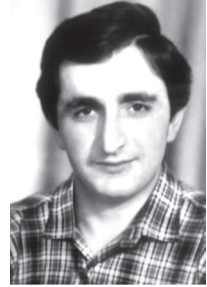
ამავე წლის ივლისიდან უკან აღარ დაბრუნებულა.

დაიბადა 1959 წლის 6 ნოემბერს ასპინძის რაიონის დაბა ასპინძაში. 1966 წლიდან 1976 წლამდე სწავლობდა ასპინძის საშუალო სკოლაში, შემდეგ სწავლას აგრძელებს თბილისის კომპერაციულ ტექნიკუმში, რომელიც დაამთავრა 1979 წელს. შემდეგ გაიარა სავალდებულო სამხედრო სამსახური და 1992 წლიდან მოხალისედ იბრძვის სამაჩაბლოში, 1993 წლიდან მუშაობას იწყებს ახალციხის 22-ე მოტომსროლელი ბრიგადის 21-ე ბატალიონში სასადილოს უფროსად. 1993 წლის ივნისში გაიწვიეს საბრძოლველად აფხაზეთში – ბრძოლის წინა ხაზზე. 1993 წლის ივლისიდან უკან აღარ დაბრუნებულა.