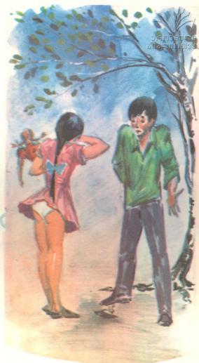
ნახატები ვახტანგ გულისაშვილისა

ახლა უფრო შეებრაღათ დაღუპული ჩიორა, წვეტიანი ჯოხით ღობის ძირში მიწა ამოთხარეს და ჩიტი დასაფლავეს.