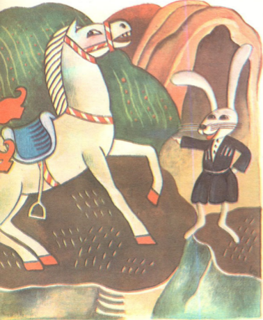
ქ. ბერიძის ნახატი

გაეკიდა მეფე თავხედს, გარბის ისარივით მარდი, სულ ქლოშინით მოატარა ხან აღმართი, ხან დაღმართი. მის ბედაც და მისძახილია: — ჰეცაცა და მართლა ნავსო, დამცაადე, დაგეწვიო, ვფიცავ, ცოცხლად გაგხდი ტყავსო! მზის ჩასვლამდე ასე სდიო, იზმოქრა, ოფლი ღვარა. სასაცილოდ არ უოფნიდა ჩვენს პურტყვიტას ეს მუქარა. ერთ დიდ კლდესთან, უცაბედად ისკუპა და განწე გახტა, ცხენი შედგა, ხოლო მეფე შურდულივით მოსწყდა ტახტას. გაიწვლდა მონადირე და პიტალოს შუბლი სთხლიშა, იქვე ხრამში გადაგორდა, დააცვივდა ქვა და ქვიშა. გაიქინა ხელი, ფეხი, აქშუტუნდა, როგორც სტვირი, დაიჩუტა ქონის გულა და წაიღო თქვენი ქირი. ამ ამბავმა ქვეშევრდომნი დიდად როდი შეაწუხა, მიათრიეს ლეში, სადაც ასწლოვანი იდგა მუხა. ამოთხარეს ხელად ორმო, შიგ ჩაუშვეს მეფე ფიფი, მიაყარეს შავი მიწა, დაფარეს ლოდი სიპი. გაიმართა წელში ხალხი, გაიძახის ერთხმად ყველა: —ადრე იყო სასიკვდილო, —ის მუწუკი, ის წურბელა. ლოცავს კურდღელს დიდ-პატარა, კაცი, ქალი, ძაღლი, ფისო: —რა ვეშაპი მოგვაშორა, ღმერთი იმას უშველისო.— დილით, როცა მთის მწვერვალი მზის სხივებით მოისირმა, ტპილ ბურანში გაიზმორა, დაამთქარა ჩვენმა გმირმა... შემოთვალა:—ჩირგვენი ვზივარ, მხურავს ცის კაბადონიო, ჩემთვის მძინავს, რას დამაკლებს მეფე, ანდა ბატონიო!