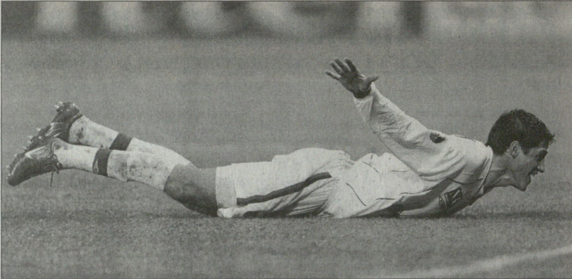
სოლო — ლიონი. ედმონსონის საგოლე სრიალი