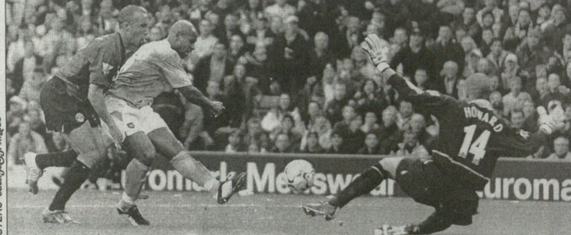
მანჩესტერ სიტი — მანჩესტერ იუნაიტედი. ტიმ ჰოვარდს შეცვალა ჰეილბრუნი