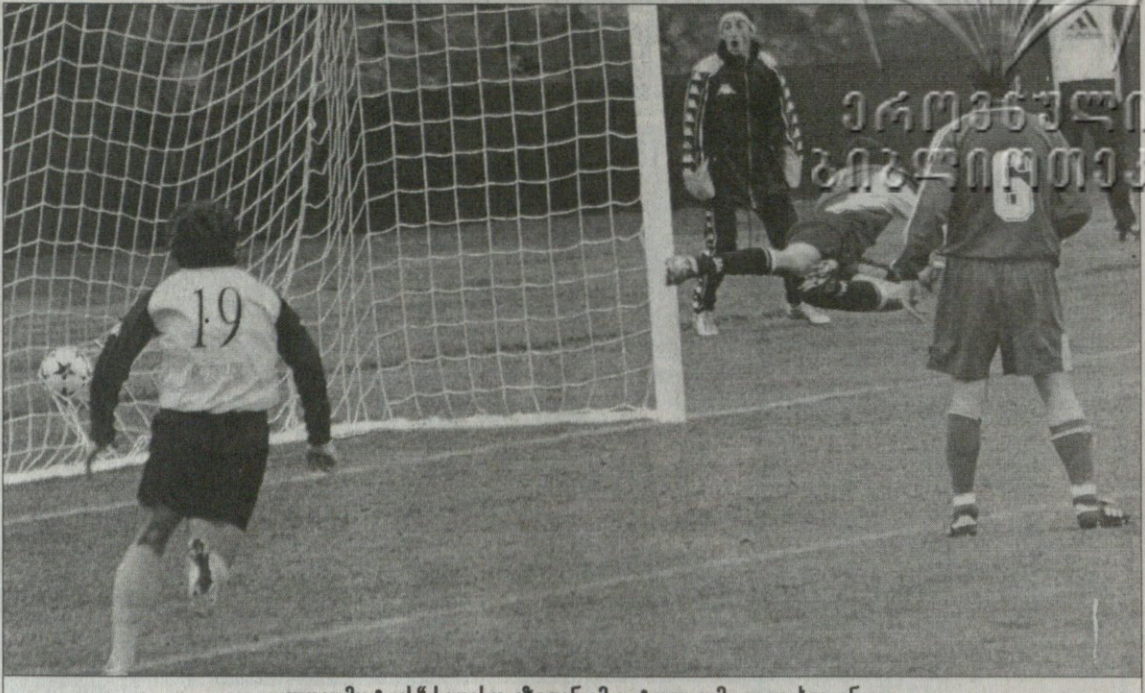
„ლოკომოტივს“ სათასო გზიდან ამ ავტოგოლმა გადაახვევინა