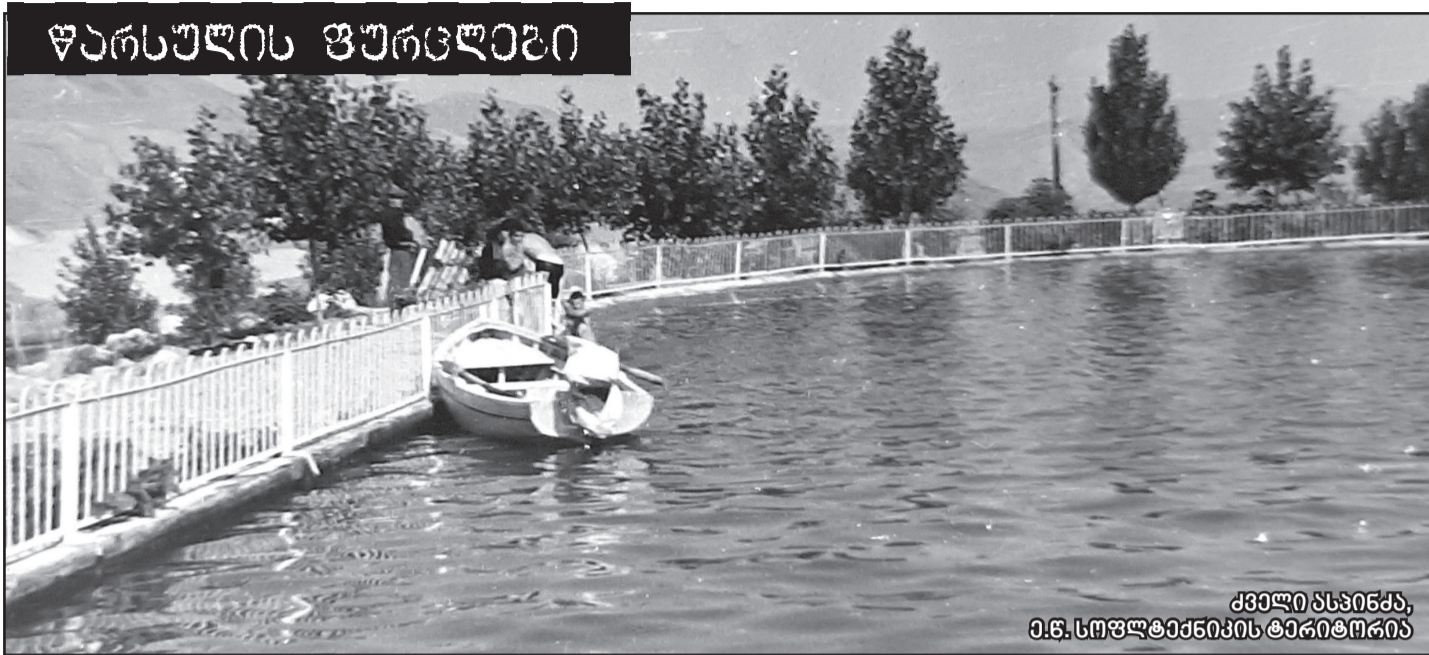
ქველი ბაზინჯა, ი.ნ. სოფლტაქნიკის ტერიტორია