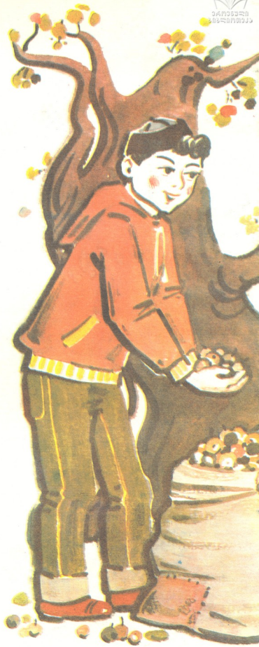
ნახატი ელშარდ აგბოკაძისა

— ხედავ, ნიკა, ეს ხე დიდი ტყის ნაშთია, უწინ აქ დაბურული ტყე იქნებოდა, ადამიან-ნებმა კი... ხედავ, წვიმასა და ნიაღვარს რა უქნია? რამდენიმე წლის მერე, აქ ისეთი დი-დი ხრამები იქნება, ვერც კი გადაახტები. უბედურება ის არის, რომ მოშიშვლებული ფერდობებიდან წვიმის წყალს მიწა მდინარე-ში ჩააქვს, ის კი სხვა ქვეყნისკენ მიაქანებს