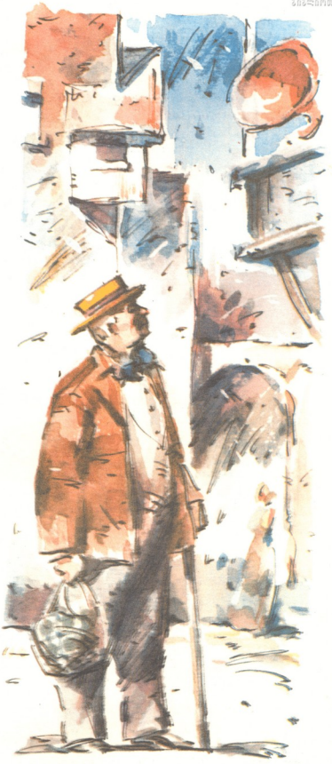
ნახატები თამაზ ხუციშვილისა

— კვერცხები რად უნდა გადაყაროთ? მომეცი ჩანთა, — უთხრა კაცმა, — ბევრი კვერცხი საშინელებაა, მაგრამ ცოტ-ცოტა ყველაფერი კარგია.