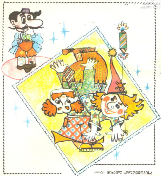
ნახატი მიხეილ სოლოვიოვისა

ძია ცხრაკლიტულამ ცირკეში ამ ორ ხუმარას სურათი გადაუღო. დააკვირდით და გააჩქვიეთ—როგორ ღვანან ისინი