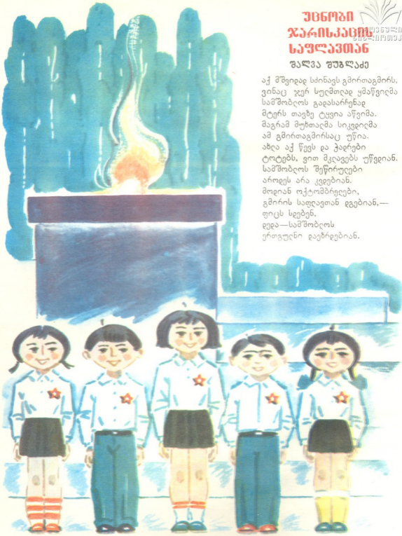
ნაიატი ელჟურა აგბოკაპინა

აქ მშვიდად სძინავს გმირთაგმირს, ვინაც ჯერ სულმთლად ყმაწვილმა სამშობლოს გადასარჩენად მტერს თავზე ტყვია აწვიმა. მაგრამ მუხთაღმა სიკვდილმა ამ გმირთაგმირსაც უწია. ახლა აქ წევს და ჭადრები ტოტებს, ვით მკვლავებს უწვდიან. სამშობლოს შეწირულები არიდეს არა კვდებიან. მოდიან ოქტომბრელები, გმირის საფლავთან დგებიან,— ფიცს სდებენ, დედა—სამშობლოს ერთგულნი დაებრდებიან.