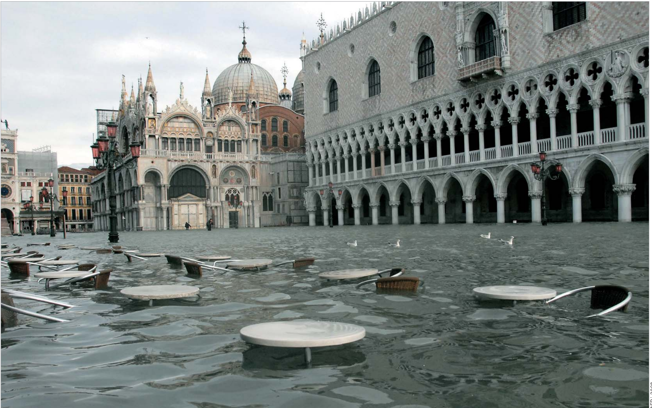
რა ეშველება ვენეციას? - ამ კითხვას სვამენ მეცნიერები და ასევე ისინი, ვისთვისაც ეს ქალაქი ძვირფასია. ასეთები კი ბევრი არიან. 2 დეკემბრიდან დღემდე ვენეციიდან მოსახლეობა გადის. მიზანიან ტურისტებიც. წყალდიდობა 2 დეკემბერს დაიწყო, თუმცა დღემდე ვენეციის პატარა ქუჩები და გასასვლელ-გამოსასვლელი დატბორილია. რთული წარმოსადგენია, მაგრამ მეცნიერები იმუნებებიან რომ ვენეციის ჩაძირვა შეუქცევადი პროცესია და 22 წელიწადში თუ არა, 30 წელიწადში ის აღარ იარსებებს. იარსებებს მოხლოდ მოგონებები, სან მარკოზე, დოყების სასახლეზე... და წყალს გაჰყვება ზაფხულის შეხვედრები ვენეციურ ფესტივალებზე. და მაინც, ნუთი ჩაიძირება?