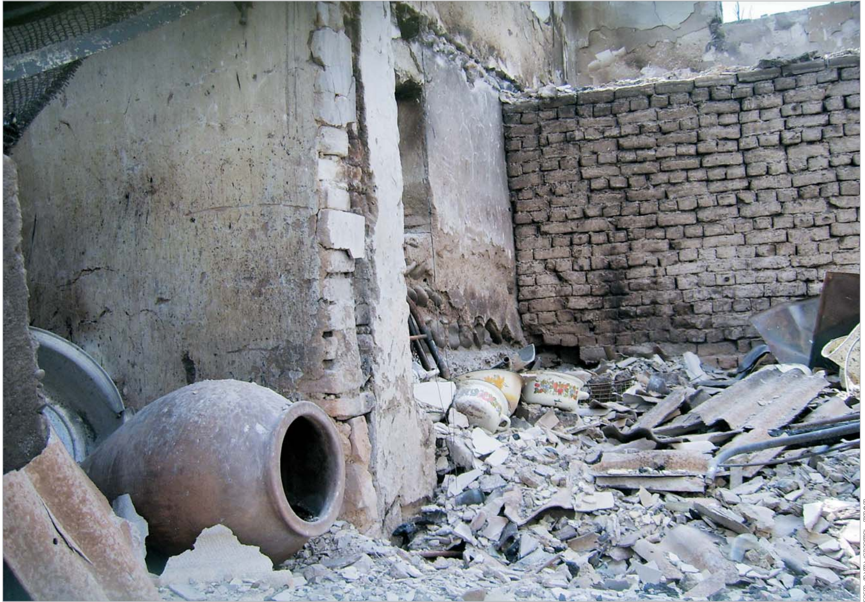
სოფელ ერგნეთში სახლების უმრავლესობა გადამწვრია. ხალხიც თითქმის არ ჩანს.

ზაქრო გინტური ამბობს, რომ აგვისტოს ომის შემდეგ სოფლის