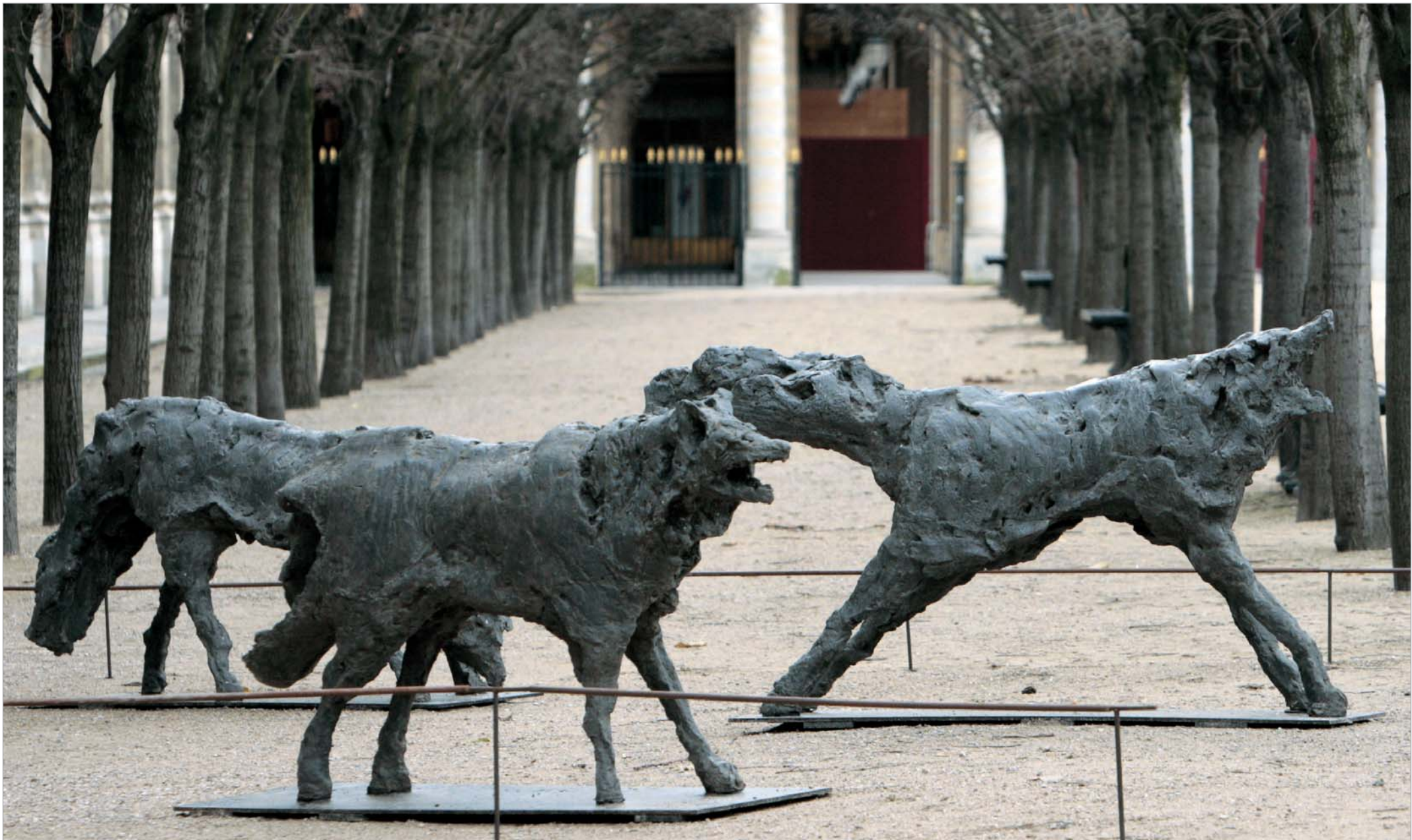
5 დეკემბერს, პარიზში, კონკრეტულად კი "პალე რუაიალში" თანამედროვე სკულპტურის გამოფენა გაიხსნა. ყველაზე დიდი ყურადღება ოივიე ესტამპის სკულპტურულმა ანსამბლმა დაიმსახურა. ამ მოქანდაკემ მთელი ხეივანი აავსო, თანაც აავსო მგლებით. მგლები რომლებიც გარბიან, მგლები, რომლებიც ყმუიან. გამოფენა რამდენიმე დღეს გასტან, ასე რომ, პარიზელებს სიმშვიდე რამდენიმე ხანს კიდევ არ დაუბრუნდებათ. შუაგულ ქალაქში ხომ მგლები დარბიან...