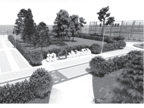
ბევრი სასიკეთო საქმე გვაკეთო ჩემი საყვარელი მუნიციპალიტეტისა და ქვეყნისათვის.

ვი სიკეთე, რაც მე ჩემ გუნდთან ერთად შევქმენი, იმედს მაძლევს, რომ შემწვევს იმის ენერჯია, ცოდნა, გამოცდილება და დიდი სურვილი, კიდევ