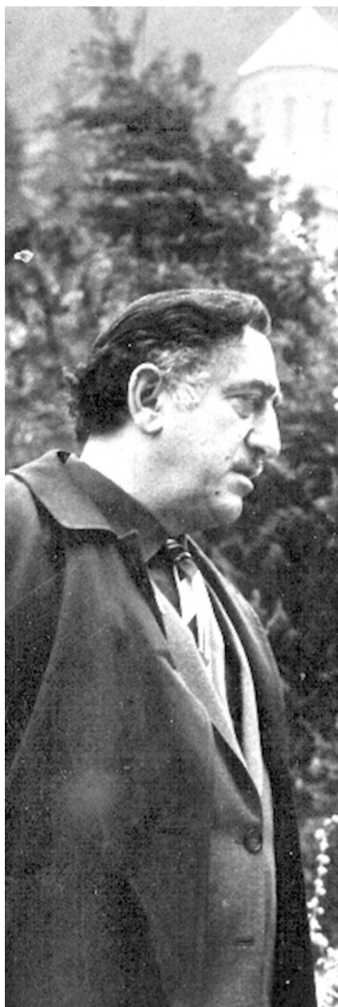
(დასაწყისი ნინა ნოშვილი)