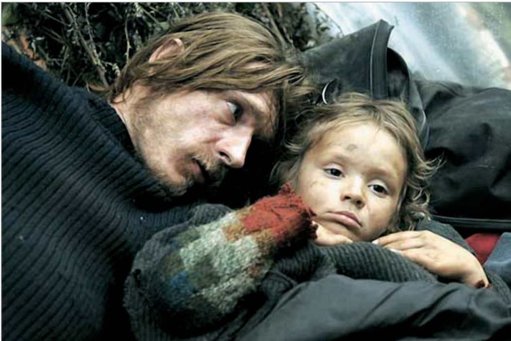
კადრი ფილმიდან "ვერსალი"

თბილისის საერთაშორისო კინოფესტივალის მორიგი საკონკურსო დღე