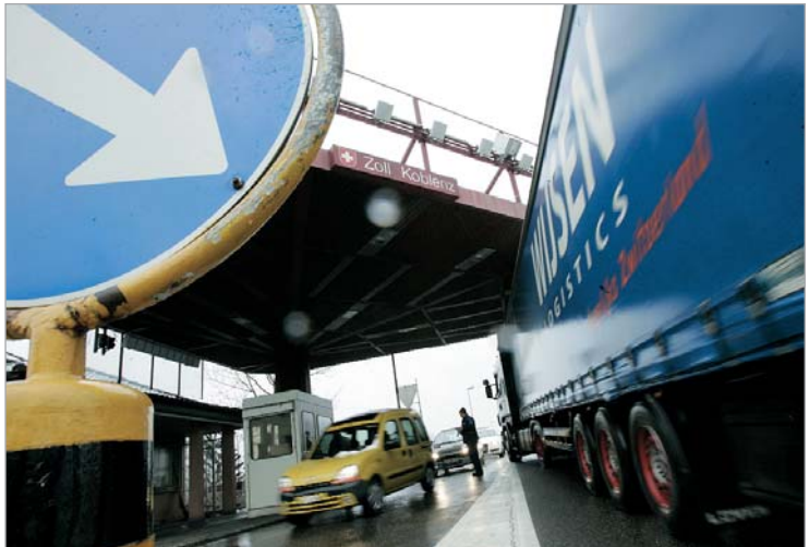
შვეიცარიაში ფუნქციონირებას განაგრძობს საბაჟო პუნქტები. სადაც შერჩევითი შემოწმება კვლავინდებურად გაგრძელდება.

შვეიცარია შენგენის ზონის 25-ე წევრი გახდა. ტრადიციულად ნეიტრალური სახელმწიფო რიგით მესამეა ნორვეგიისა და ისლანდიის შემდეგ, რომელიც შენგენის სივრცეს შეუერთდა და ევროკავშირის წევრ ქვეყანას არ წარმოადგენს.