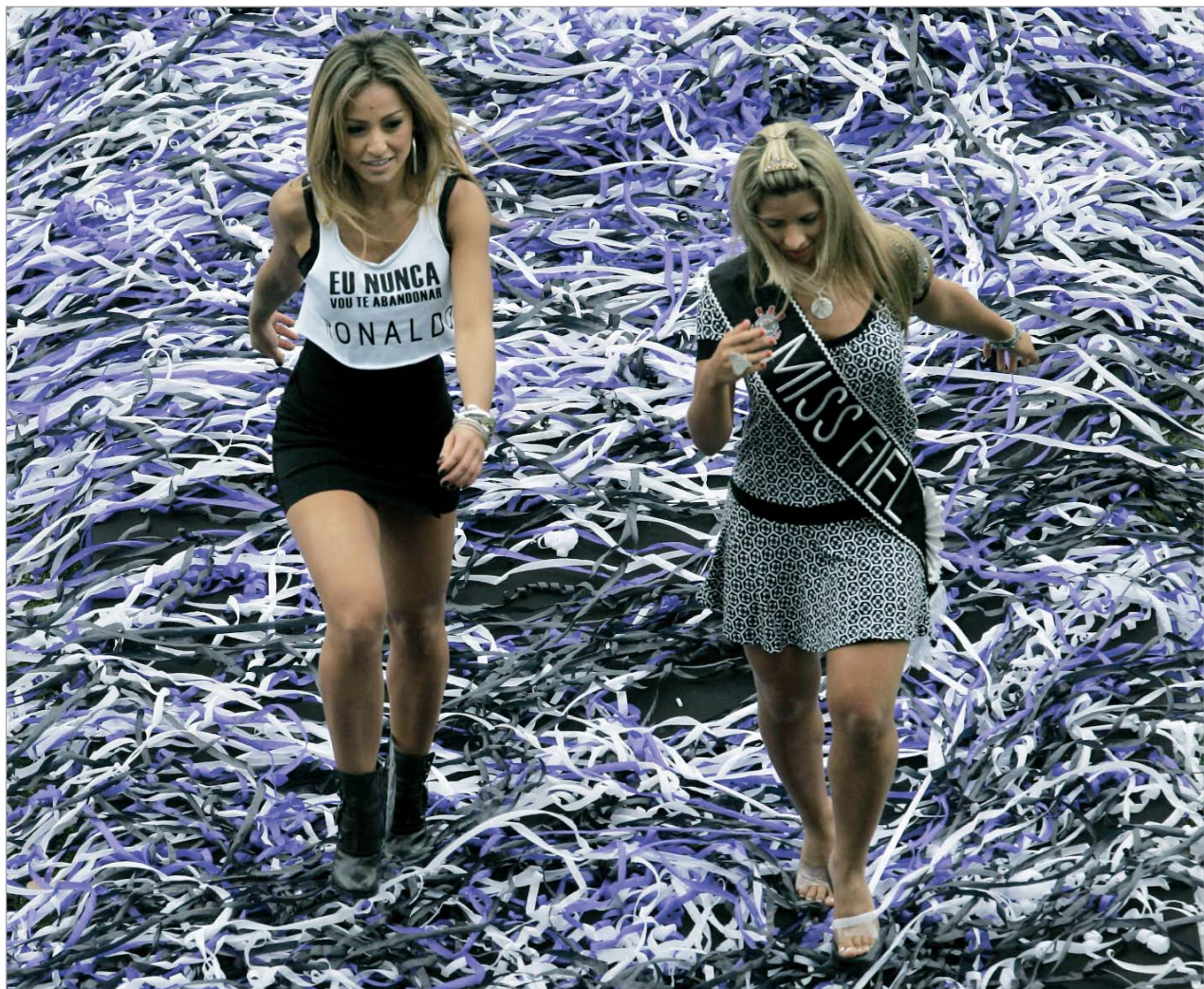
ფიფას მიერ სამჭერ დასახელებული წლის საუკეთესო ფეხბურთელი რონალდო "კორინთიასშია". უფრო სწორად, ბრაზილიელმა ბრაზილიურ კლუბთან ერთწლიანი კონტრაქტი გააფორმა. რონალდოს სამშობლოში დაბრუნება იმხელა აყიოტაყი გამოიწვია, რომ სტადიონზე წარდგენისას გულშემატკივრებს ტრიბუნებიდან პატივისცემისა თუ სიხარულის ნიშნად უამრავი ზონარი გადმოუშვია. რონალდოს წარდგენას ერთგვარ აპურტის უწევდნენ ჩირლიდერებიც. მაგრამ ვინ აცალა? ტრიბუნებიდან გადმოყრილმა რაღაც-რუღაცებმა მათი წარმოდგენა ჩაუშლია. ამიტომაცაა, რომ მოედანს უხალისოდ ტოვებენ.

გუშინ - ჩემპიონატის მეორე დღეს 800 მეტრზე თავისუფლაში მსოფლიოს რეკორდი დამყარა იტალიელმა ალესია ფილიპიმაც (8.04,53).