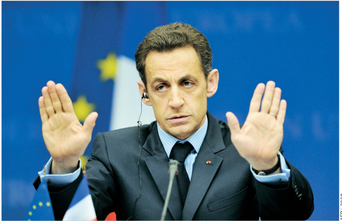
სარკოზი: "შლანეტის არც ერთ სხვა კონტინენტს კლიმატის დაცვის ამგვარი ამბიციური გეგმა არ გააჩნია."

ამ პროექტს ეწინააღმდეგებოდნენ ევროკავშირის აღმოსავლელი წევრები: პოლონეთი, ჩეხეთი, ლატვია, ლიტვა, ესტონეთი, უნგრეთი, სლოვაკეთი, რუმინეთი, ბულგარეთი და საბერძნეთი. ბრიუსელის სამიტამდე ვარაუდობდნენ, რომ 2013 წლიდან ევროკავშირის წევრები დამაბინძურებელი ნივთიერებების გამოყოფაზე კვლავ შეზღუდვას და აუქციონებზე დაინყებდნენ. გაერთიანების აღმოსავლური ქვეყნებისთვის, რომელთა ელექტროსადგურების 93 პროცენტი ქვანახ-