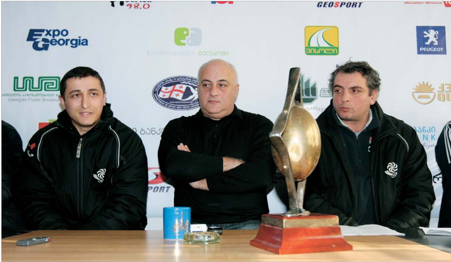
მწვრთნელები უშეღავათო ბრძოლას გვპირდებიან.