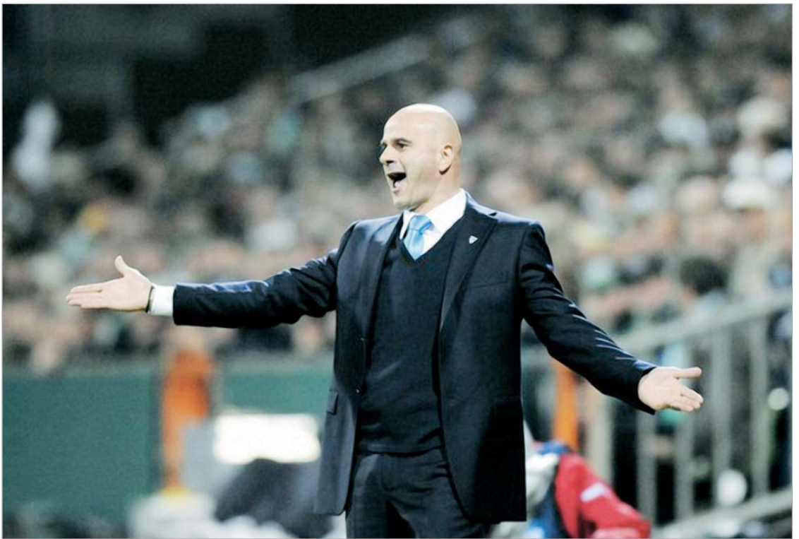
წლევიანდელი ჩემპიონთა ლიგაში ქაცხაიამ მთავარი სენსაცია შემოგთავაზებას

- მეორე წრეში განმეორებითი მატჩი “რაპიდთან”. საკუთარ მოედანზე მეტოქე 3:0 დავამარცხეთ, სტუმრად კი მატჩის დებიუტშივე შეეძელით გოლის გატანა. თუმცა 70-ე წუთისთვის “რაპიდმა” სამი გოლი გაიტანა. ბოლო 20 წუთი ძალიან მძიმე გამოდგა. არც “ოლიმპი-