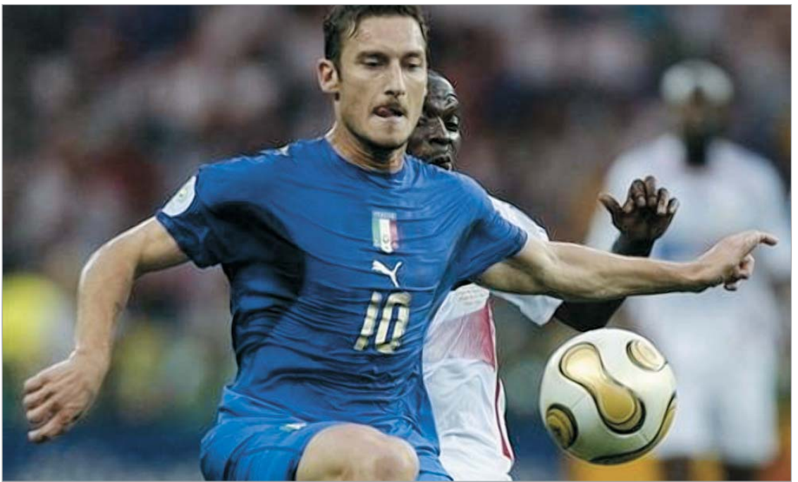
ტოტი ნაკრებში დაბრუნებაზე ალაპარაკდა

და თუ ნაკრებში დავეჭირდი, დაუფიქრებლად მივიღებ შემოთავაზებას”, - განუცხადა ტოტიმ “კორიერო დელო სპორტის” ჟურნალისტს.