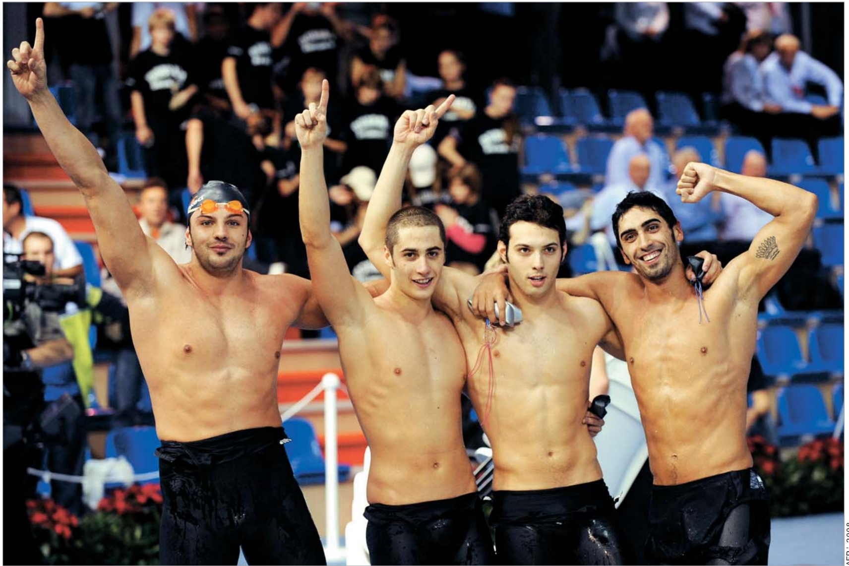
იტალიელთა კვარტეტმა რუსებს რეკორდით წაართვა და ოქროს მედლებიც

ბევრი რომ არ გავაგრძელოთ, კვალიფიკაციაზე მოვლენები წამის მესამე