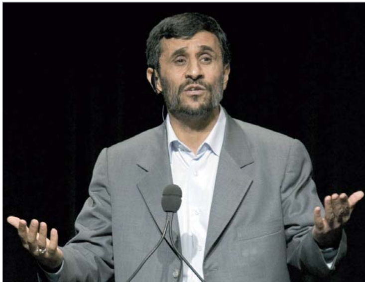
აჰმადინეჯადის თქმით, ირანი რეგიონული ზესახელმწიფოა.

აღსანიშნავია, რომ მიმდინარე წლის აგვისტოში "რუსეთის ლიბერალ-დემოკრატიუ-