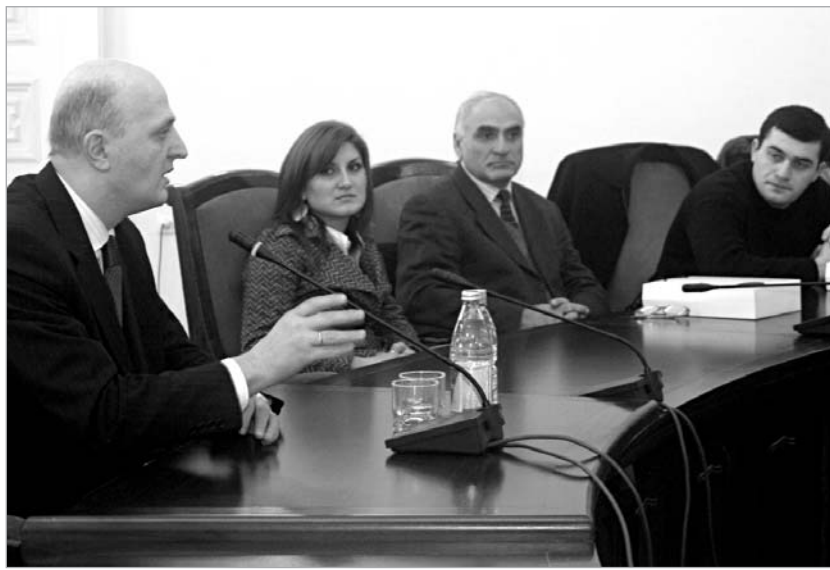
უზენაესი სასამართლოს თავმჯდომარე ნაფიც მსაჯულს შეხვდა.