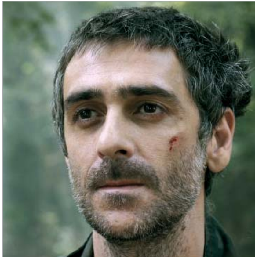
კადრები იაშკას ბოლო ფილმიდან

იაშკა - დათო იაშვილი, სრულიად ახალგაზრდა და თანამედროვე ქართული კინოს ერთ-ერთი სახე რამდენიმე დღის წინ მოულოდნელად გარდაიცვალა. შეწყდა მისი ცხოვრება და მასთან ერთად შეწყდა მისი ახალი, ჯერ კიდევ დაუსრულებელი როლებიც. იაშკამ ბო-