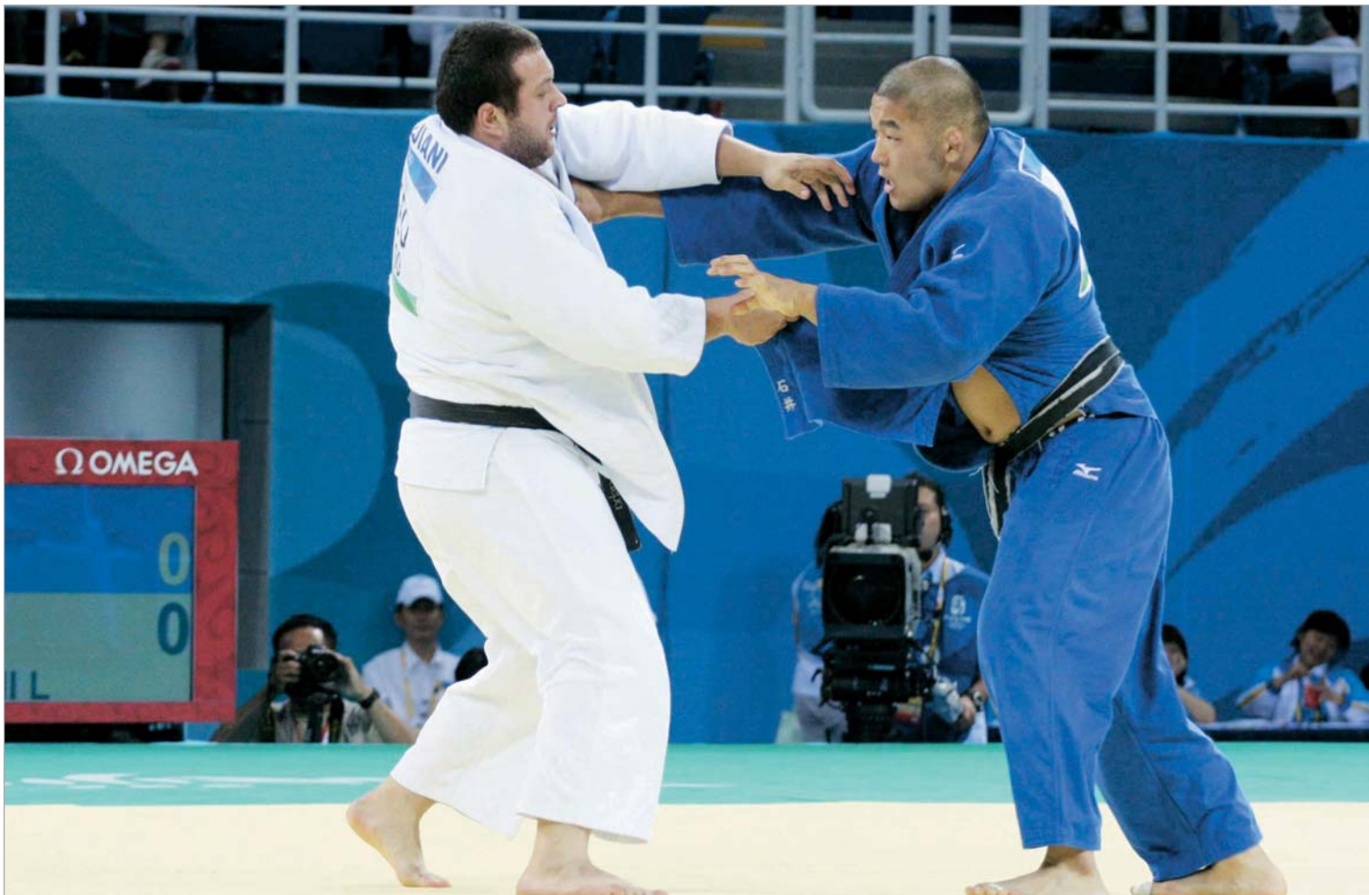
პეკინის ოლიმპიურ ტაბაში გუჯუიანისთვის სატოში იშის ნახევარფინალური ბარიერი გადალახავი აღმოჩნდა