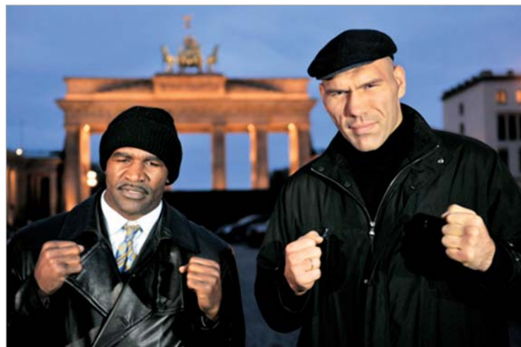
ჰოლიფილდი სიბერეს არ ეუბნება და ვალუევიან ბრძოლას აპირებს

გასული საუკუნის 90-იან წლებში ჰოლიფილდი სერიოზული ძალა იყო და მსოფლიოს აბსოლუტური ჩემპიონის ტიტულსაც ფლობდა, მაგრამ ახლა კრივისთვის მოხუცია, არ შესწევს ძალა რუს გოლი-