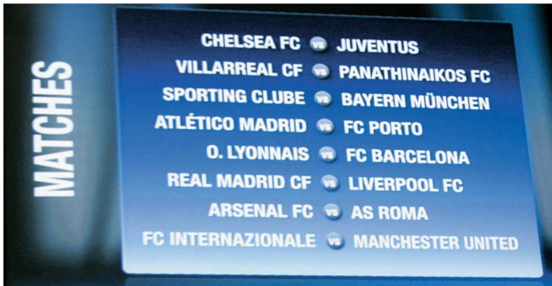
ჩემპიონთა ლიგაზე გუნდები დაწყვილდნენ

გუშინ გაიმართა ჩემპიონთა ლიგის პლეი-ოფის ნილისყრა. "ინტერის" ჯგუფში პირველ ადგილზე გასულ "პანათინაიკოსს" "ვილიარეალთან" მოუწევს თამაში, "ინტერი" კი "მანჩესტერს" დაუპირისპირდება. ფერგიუსონის გუნდმა სწორედ "ვილიარეალი" დატოვა ჯგუფში მეორე ადგილზე. ვფიქრობთ, განსხვავება თვალშისაცემია და ვისთან სჯობს პლეი-ოფის ამ ეტაპზე თამაში, გულშემატკივარმა კარგად იცის. ასეა თუ ისე, ყოფილი მოურინიოს "ინტერი" "მანჩესტერს" ხვდება. თანაც მანკუნია-ნელეს განმეორებითი მატჩი "ოლდ ტრაფორდზე" აქვთ გასამართი, რაც მათ მცირე უპირა-