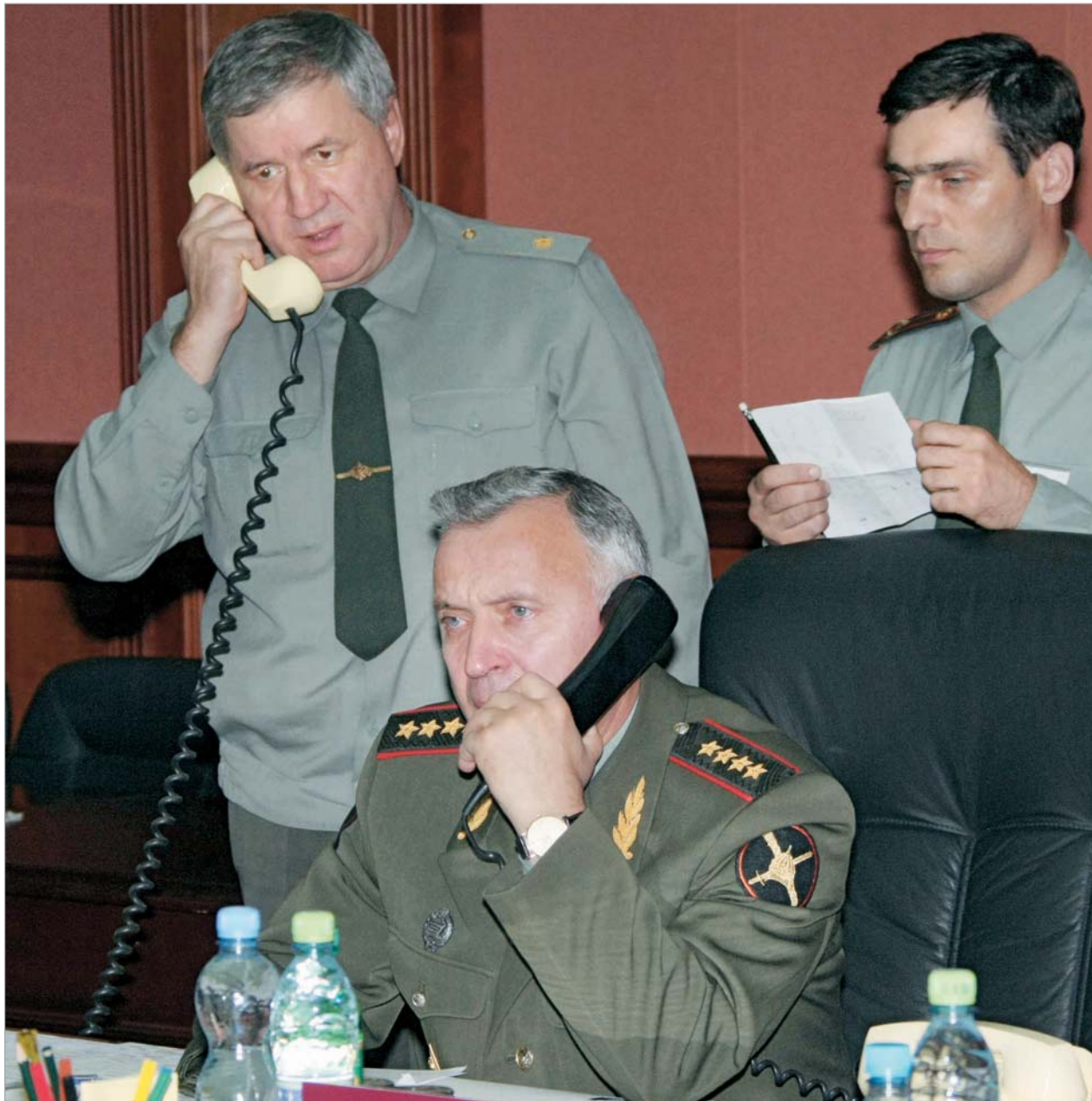
რუსეთის შეიარაღებული ძალების გენერალური შტაბის ხელმძღვანელ მაკაროვის თქმით, შეერთებულმა შტაბებმა "სამხედრო ბაზებით დახუნძლეს მსოფლიოს ყველა რეგიონი".

აქვე უნდა აღინიშნოს ერთი სენსაციური განცხადებაც, რომელიც ბოროვოეს შეხვედრის წინ ყირგიზეთის პრეზიდენტმა გააკეთა - კურმანბეკ ბაკიევი მანასში ამერიკული სამხედრო ბაზის დახურვას აპირებს. ინტერვიუ, რომელიც ბაკიევმა რუსეთში დარეგისტრირებულ ინტერნეტ-პორტალ "სვობოდანია პრესას"