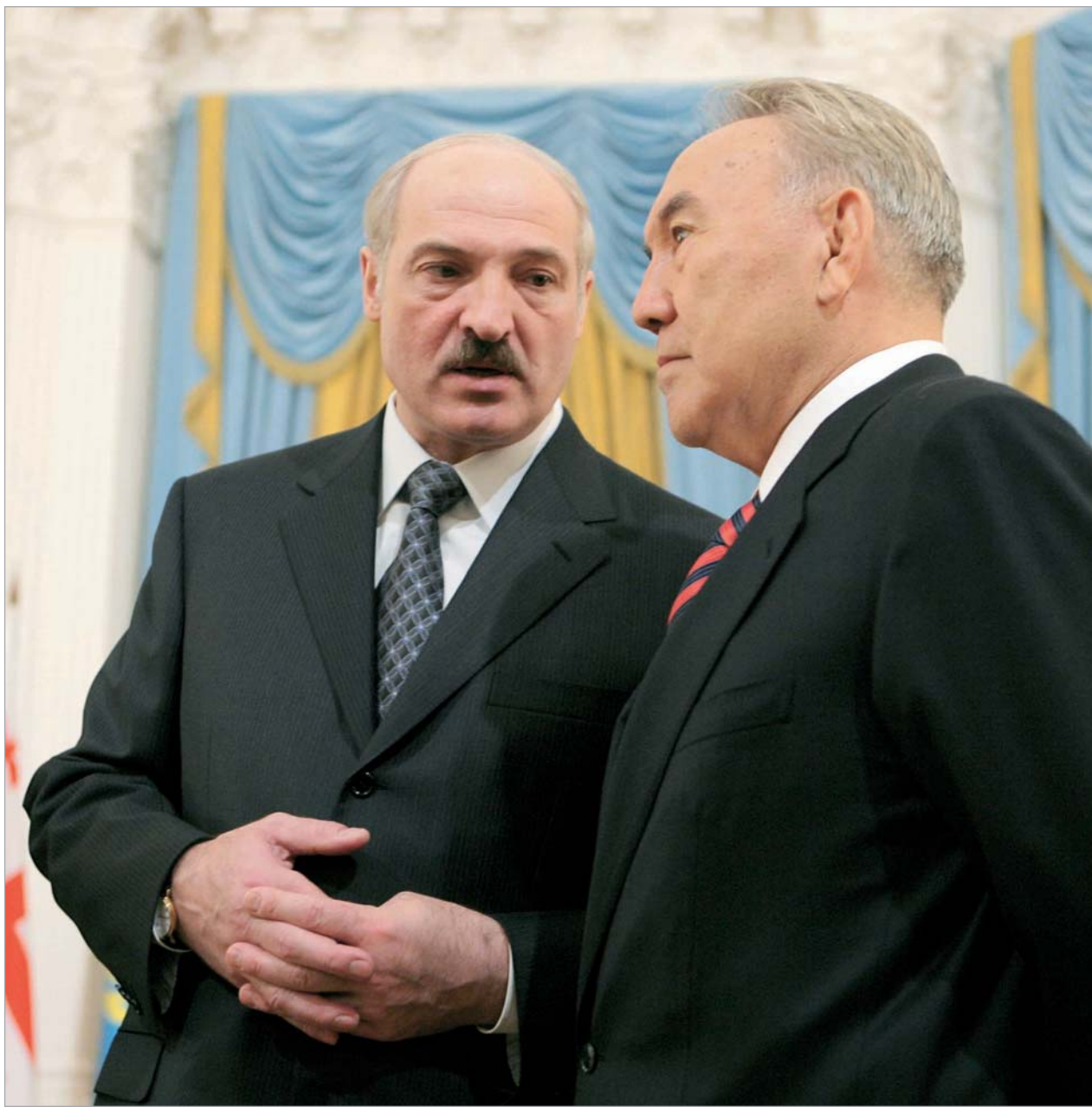
ლუკაშენკო, ნაზარბაევი და სხვა ლიდერები დსთ-ს სამიტზე რუბლის ზონასთან მიერთების საკითხს განიხილავენ.

"ავლანეთი ძალიან სერიოზული პრობლემაა, რომელთანაც მთელი ცენტრალური აზიის უსაფრთხოება დაკავშირებულია. ამიტომ, ყირგიზეთის ხელმძღვანელობა კარგად უნდა ხვდებოდეს, რომ ამერიკული ბაზის არსებობა მხოლოდ აშშ-სა და ყირგიზეთის შორის ურთიერთობების ჩარჩოებში არ ჯდება," - მიიჩნევს ყოფილი საგარეო საქმეთა მინისტრი.