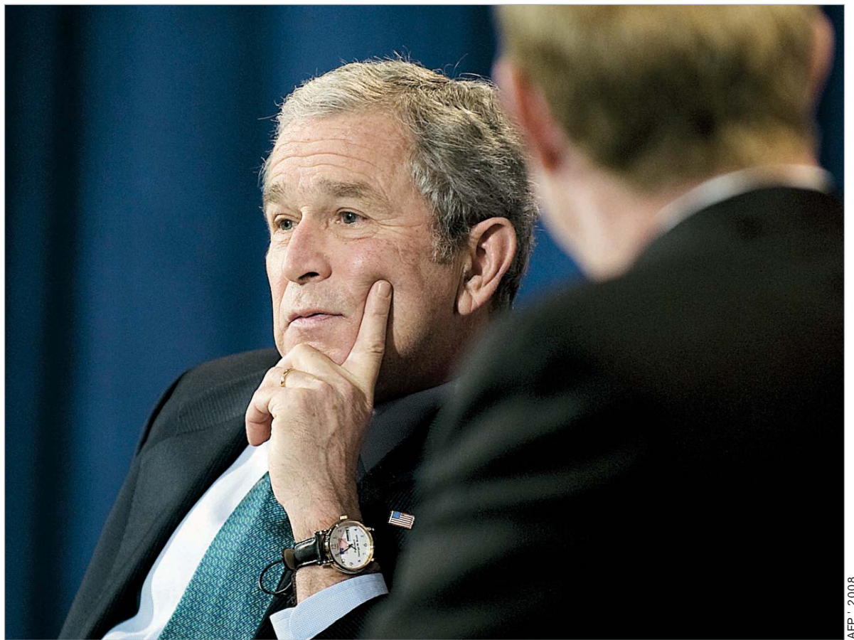
ბუშს გამოსამშვიდობებელი სიტყვის თქმა ჯერ გადაწყვეტილი არ აქვს