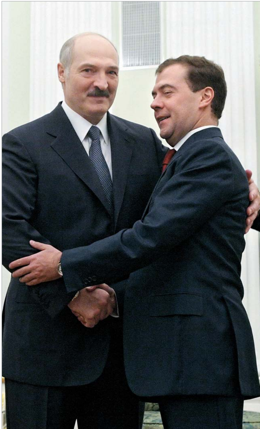
მედვედევის და ლუკაშენკოს ურთიერთობები ორმხრივი გაცუცურაკების ყოვლისმომცველ სურვილს ეფუძნება

"ფასი ბელარუსისთვის სავსებით მისაღები პირობებითაა შეთანხმებული," - თქვა მოსკოვში მოლაპარაკებებზე მყოფმა ბელარუსის დელეგაციის წარმომადგენელმა, მაგრამ კონკრეტული ციფრების დასახელებაზე უარი განაცხადა. ჟურნალისტებისა და ექსპერტების ვარაუდები იმის შესახებ, თუ ვინ ვის რას დაჰპირდა და რის ფასად, ჯერჯერობით ფაქტებს კი არა, ბუნდოვან ინფორმაციას ემყარება. ბელარუსული დელეგაციის წყაროები იუსყევიან, რომ "ორი ქვეყნის პრეზიდენტების შეხვედრაზე განხილულ საკითხებზე, მათ შორის სამხედრო-