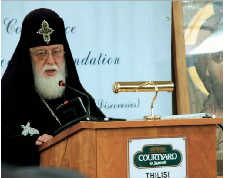
საქართველოს კათოლიკოს-პატრიარქი, უწმინდესი და უნეტარესი, ილია მეორე საერთაშორისო კონფერენციის მასპინძლობს

გუშინ სასტუმრო "ქორთიარდ მარიოტში" გაიხსნა საქართველოს კათოლიკოს-პატრიარქის, უწმინდესისა და უნეტარესის, ილია მეორის აღსაყდრების 31 წლისთავისადმი მიძღვნილი საერთაშორისო კონფერენცია, სახელწოდებით, "რწმენა და ცოდნა - მსოფლიო კულტურის საფუძველი". ფორუმს, რომელიც ოთხ საათს გაგრძელდა, ესწრებოდნენ მსოფლიოს მართლმადიდებლური ეკლესიების, საზოგადოების წარმომადგენლები, აგრეთვე ქართველი და უცხოელი პოლიტიკოსები. ამ უკანასკნელმა "კატეგორიამ" სასულიერო-კულტურული ღონისძიებას, გარკვეულწილად, პოლიტიკური დატვირთვა შესძინა. ეს "ტენდენცია", მნიშვნელოვანწილად, კონფერენციაში რუსული დელეგაციის მონაწილეობამაც განაპირობა.