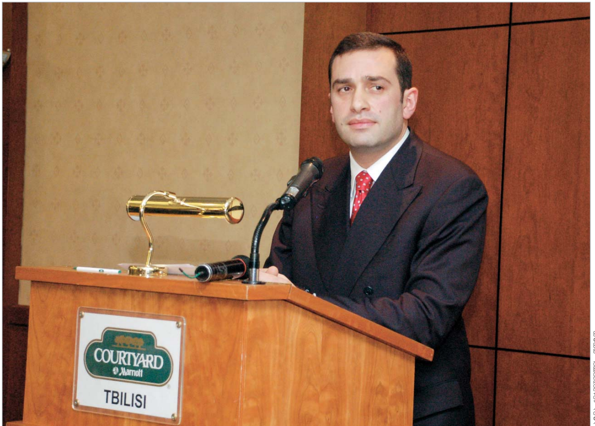
ირაკლი ალასანია: "ეს ცვლილება იქნება საქართველოს მოსახლეობის ნების გამოვლინება"