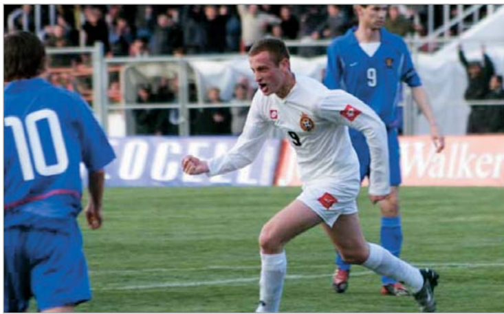
"ასკას" "დინამოში" სურს დარჩენა

- ახლა ალბათ ისვენებთ. თუ საიდუმლო არ არის, შევუხლებს რა დოკუმენტებს? - უბრალოდ ვისვენებ, არაფერს ვაკეთებ. - ალბათ დაქანცვული სეზონის შემდეგ თავს ქართული სამზარეულოს და ღვინისამოყვარების უფლება მიეცით... - შევბუღებულ ვარ და ახლა თავს ყველაფრის უფლებას ვაძ-