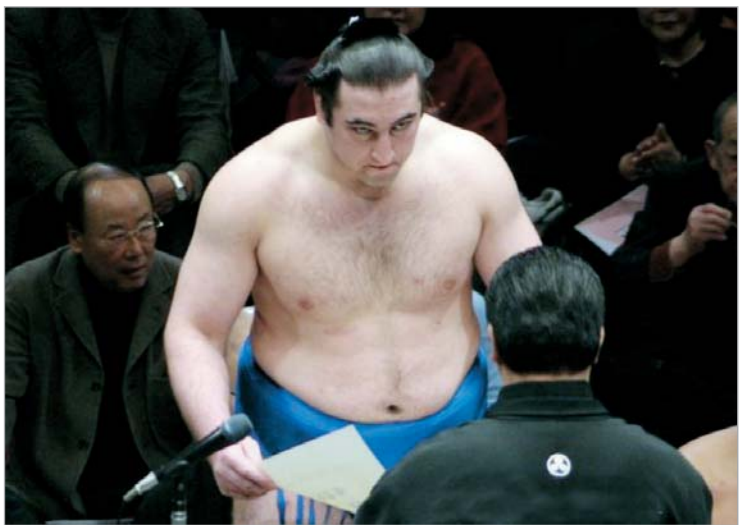
ტორინოში ელიტაში ადგილი დაიმკვიდრა

გუმინ სუმოს ასოციაციამ გამოაქვეყნა დეკემბრის ბანძუკე (სუმოსტო რეიტინგი), რომელშიც ლევან ცაგურია (კოკაი) მეოთხე მაეგაშირას რანგშია, ხოლო ლევან გორგაძე (ტორინოშინი) მეთერთმეტე მაეგაშირასი.