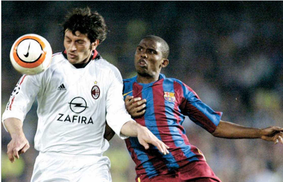
კალაძე სკუდეტოსა და უეფას თასის მოგებას შეეცდება

- 2008 წელი მეტოქის კარში გატანილი ხუთი გოლით დასრულეთ. ალბათ ახლა დასასვენებლადაც უფრო დიდი სიამოვნებით წახვალთ?