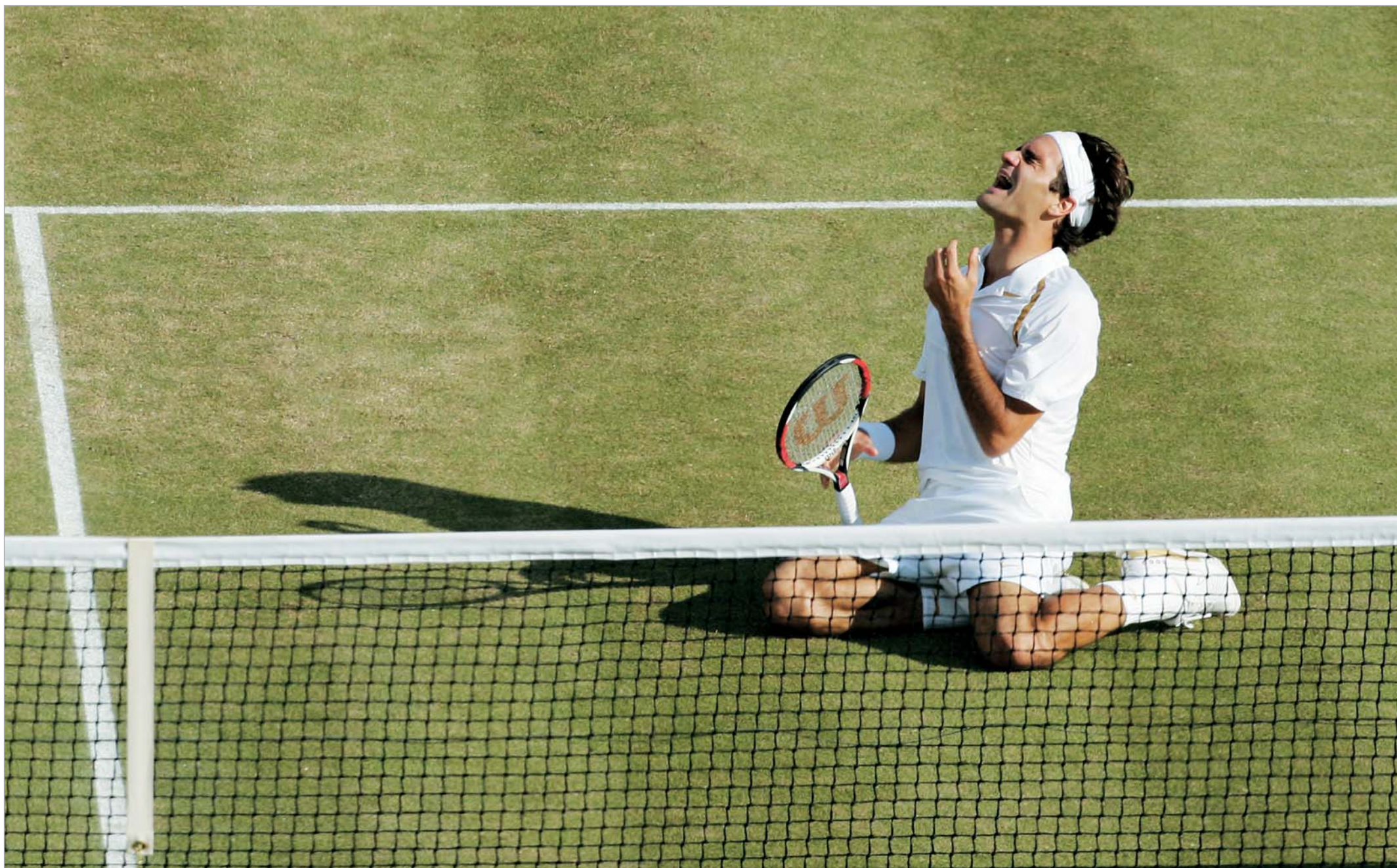
როტერ ფედერერი საკმაო ხნის განმავლობაში მსოფლიო სარეიტინგო რეიტინგს განაგებდა. მაგრამ რაფაელ ნადალის გამოცენის შემდეგ, პირველობა დაკარგა და დღეს მეორე ჩოგნად იწოდება. ერთი იმასაც ამბობენ, შვეიცარიელი მსგავს წარმატებებს ვეღარ მიაღწევსო. როგორც არ უნდა იყოს, ეს მომავლის საქმეა. გაისად გამოჩნდება როტერი ნაადრევად ჩამოწერეს თუ ზუსტ პროგნოზთან გვაქვს საქმე. დიდი სლემის არაერთი ტიტულის მფლობელი კი აცხადებს, თავდაუზოგავი შრომა და წარმატების მისაღწევად ბოლომდე დახარჯვის გამო მიყვარს საკუთარი საქმეო. შვეიცარიელმა არდადეგები მოილია და ახლა სეზონისთვის დასკვნით მზადების ეტაპს გადის. მერე სეზონიც გახურდება, რომელსაც ასე ელის ჩოგბურთის გულშემატიკვარი და პირველ ყოვლისა როტერ ფედერერი.