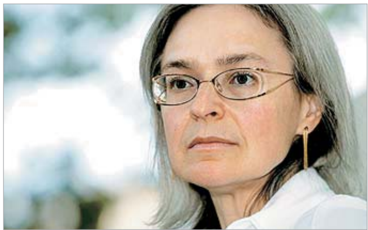
ანა პოლიტკოვსკაიას მკვლელობის საქმის სასამართლო პროცესი გრძელდება.

ანა პოლიტკოვსკაიას მკვლელობის საქმის განხილვისას სასამართლო პროცესზე გაირკვა, რომ მილიციამ შესული ანონიმური ზარი, რომლითაც ზარის ავტორი ყურნალისტი ცხედრის აღმოჩენას იტყობინებოდა, ზუსტად ემთხვევა მკვლელობის დროს.