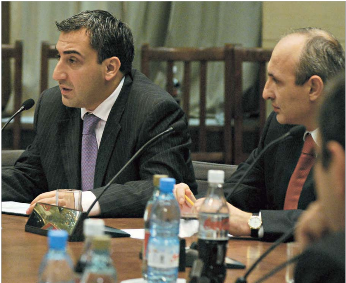
მთავრობამ პრეზიდენტს ანგარიში ჩააბარა.