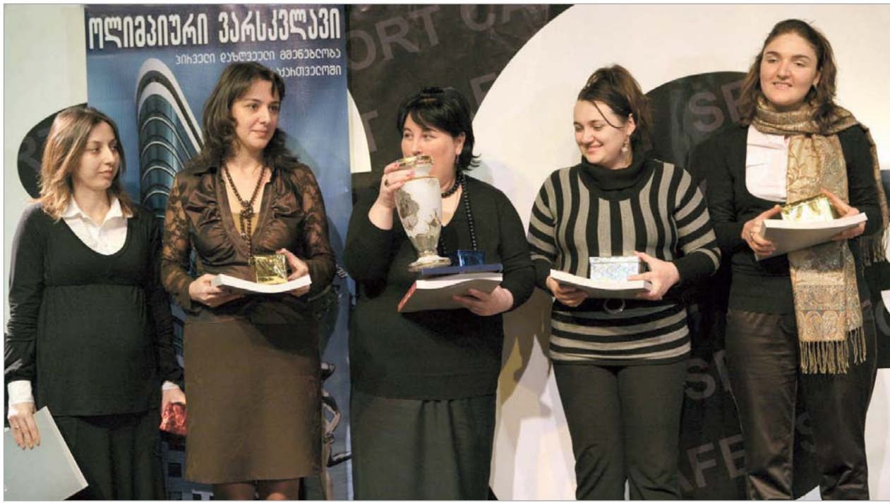
2008 წლის საუკეთესო გუნდი ქალ მოჭადრაკეთა ნაკრები გახდა.

ოს გუნდური ჩემპიონის ტიტული და ევროპის ჩემპიონატის ბრინჯაოს მედალი (შარშან ამავე გამოკითხვაში მეორე იყო).