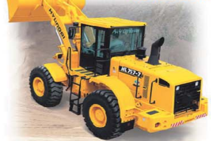
გარანტია 1 წელი