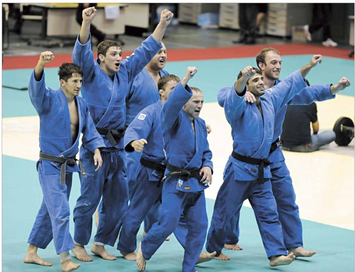
ქართველმა ძიუდოსტებმა მსოფლიოს გუნდური ჩემპიონატი ზედიზედ მეორედ მოიგეს.