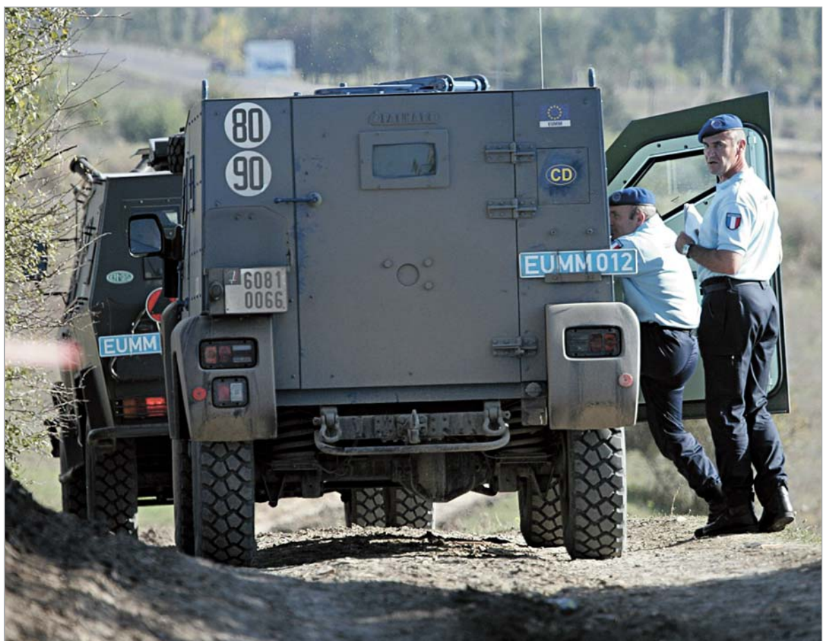
ევროკავშირის სადამკვირვებლო მისიის გზა სავსეა წინააღმდეგობით და ნაღმებით.