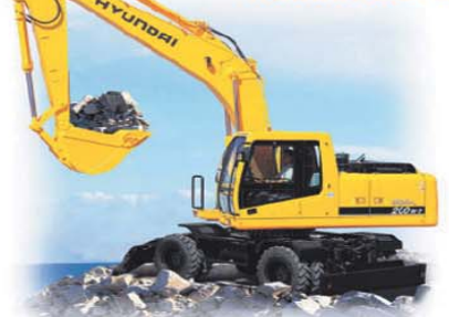
გარანტია 1 წელი