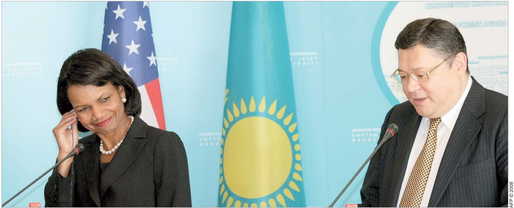
კონდოლიზა რაისი და მისი ყაზახი კოლეგა მარატ ტაჟინი.

“ყაზახეთთან ოფიციალური ვაშინგტონის ეკონომიკური და პოლიტიკური ურთიერთობები გამჭვირვალობის პრინციპებს ემყარება. ყაზახეთის საგარეო უწყების ხელმძღვანელთან შეხვედრის შემდეგ შეიძლება დასკვნის სახით აღინიშნოს, რომ ენერგეტიკის სფეროში ყაზახეთთან მეგობრული ურთიერთობები-