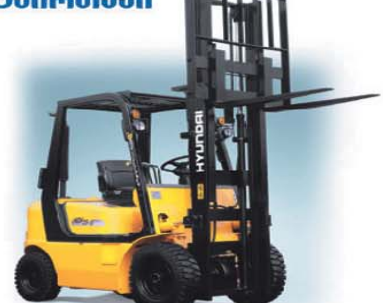
გარანტია 1 წელი

თბილისი, აღმაშენებლის გამზ. 86/90; ტელ/ფაქსი: (822) 954767, მობ.: (877) 450345, ვებ-გვერდი: www.hyundaiggmc.ge