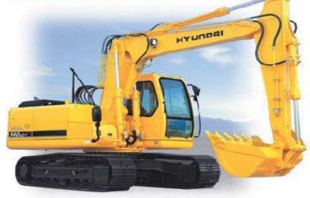
გარანტია 1 წელი