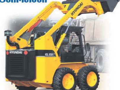
გარანტია 1 წელი