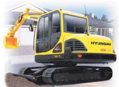
გარანტია 1 წელი