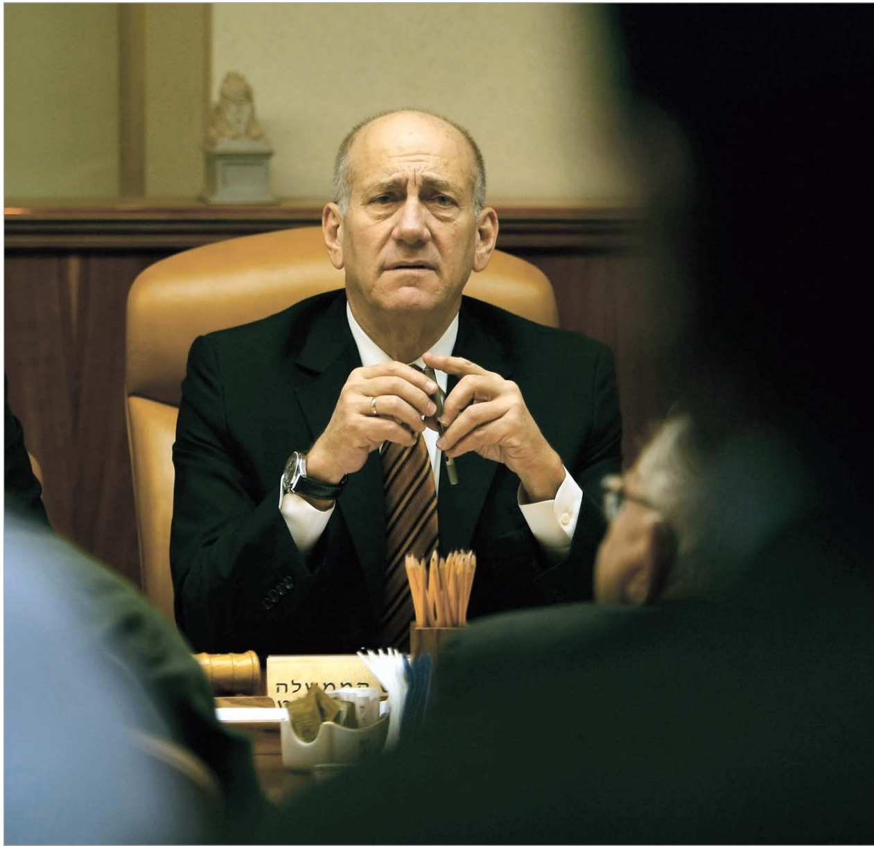
ვაშინგტონისგან უარის შემდეგ ოლმერტმა თავად გადაწყვიტა ირანის ბირთვული ობიექტის წინააღმდეგ ოპერაციის განხორციელება.

სენჯერი აღნიშნავს, რომ სწორედ პენტაგონის ანგარიშმა აიძულა ისრაელის ხელისუფლება, დაეწყო საკუთარი ოპერაციისთვის მზადება: გაეცნო რა დოკუმენტის შინაარსს, ოლმერტმა დაასკვნა, რომ ბუში ირანის ბირთვულ პროგრამას არ შეეხებოდა და თავად გადაწყვიტა, ხელი მოეკიდა ამ საქმისთვის. თუმცა, ამერიკულმა მხარემ მტკიცე უარი განუცხადა ისრაელს თხოვნაზე, მიეწოდებინათ ავიადარტყმებისთვის საჭირო ტექნიკური საშუალებები და ნება დაერთოთ ერაყის საჰაერო სივრცეზე ფრენების