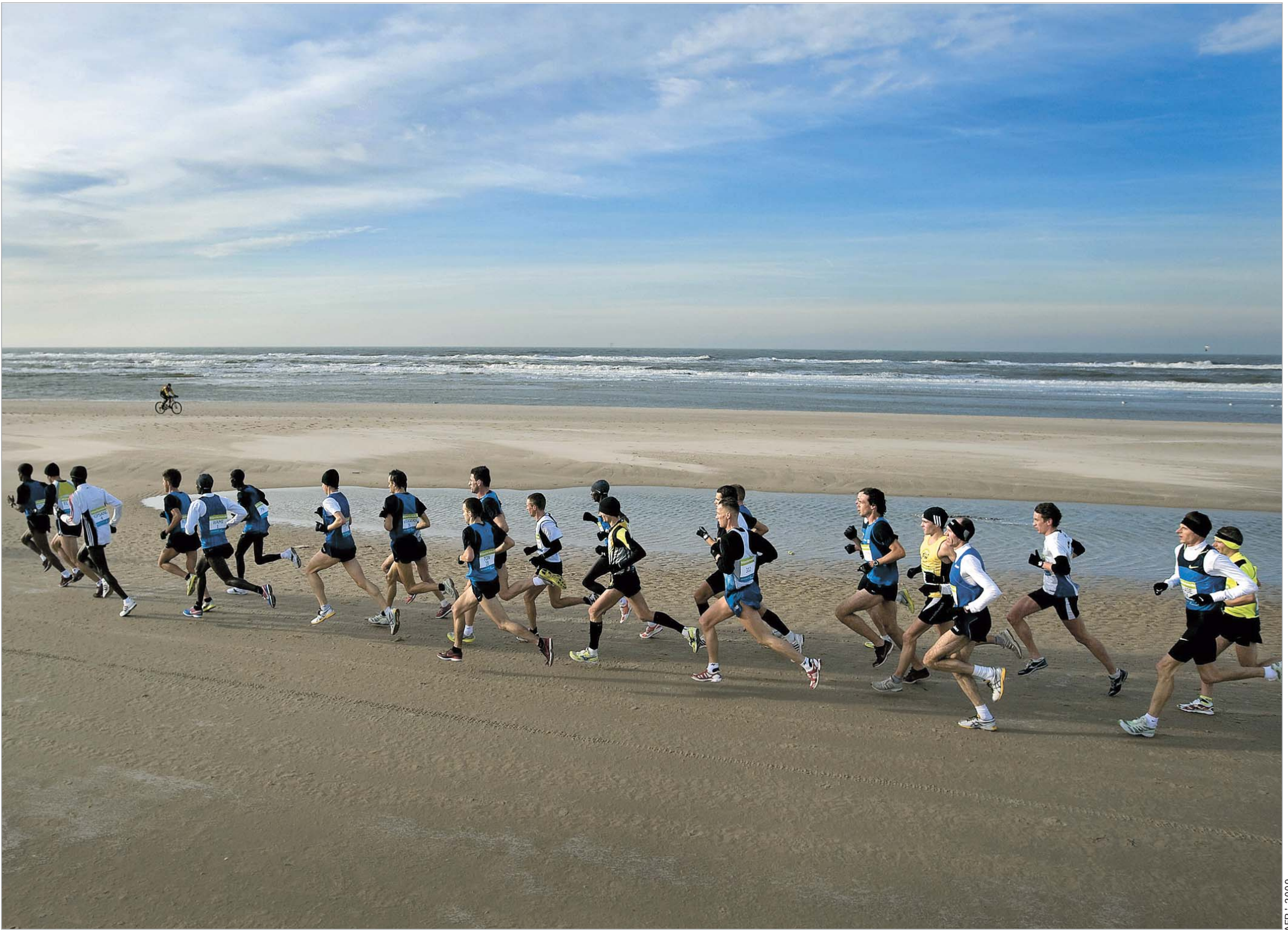
ჰოლანდიაში ეგმონდის სანაპიროს გასწვრივ, ამავე სანაპიროს სახელის მქონე მარათონი შემდგარა. ბევრი ირბინეს თუ ცოტა, ფინიშის ხაზი პირველს გადაუკვეთავს კენიელ უილსონ კიპსანგს. აშკარაა, შავი კონტინენტის წარმომადგენლებს მარათონში ბადალი არ ჰყავთ.