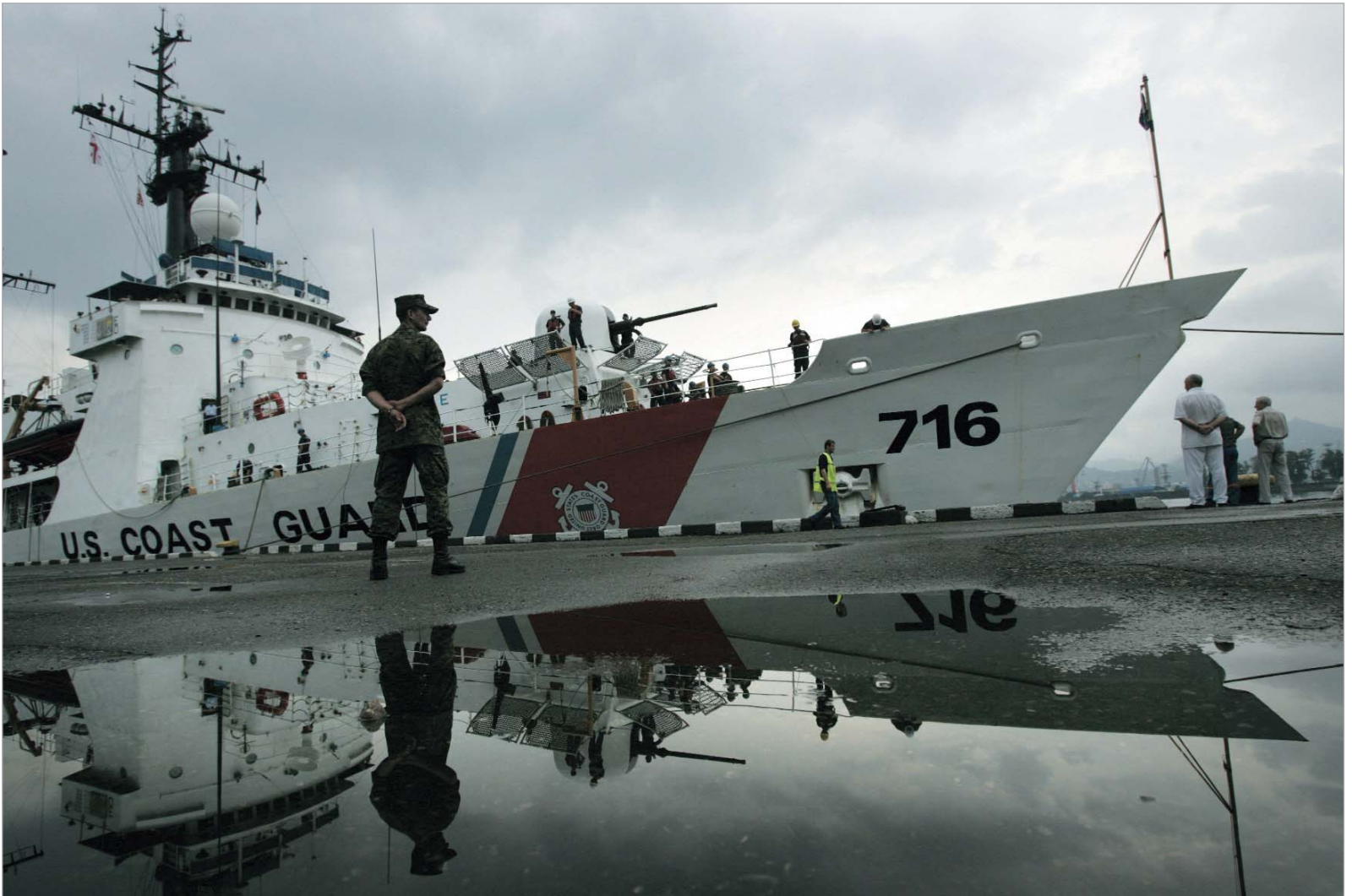
აშშ-ს სამხედრო-საზღვაო ფლოტი ბათუმში.

დავიდ ჯ. სმიტი სპეციალურად „24 საათისთვის“