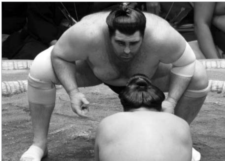
კოკაიმ და ტოჩინოშინმა სეზონის პირველი ბაშო გამარჯვებით დაიწყეს.

ლევან ცაგურიას მეტოქე კი აღმოსავლეთის მეხუთე მაიგაშირა ფუტენო იყო. კოკაიმ, ისევე როგორც მისმა ახალგაზრ-