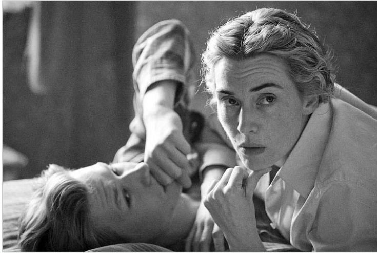
"ქეთ უინსლემის ფილმში 'შეთხვევითი'"

ვიჩნით. "შემთხვევითი მილიონერი" ის ძლიერი კომპონენტები ქმნიან, რომლებიც ზემოთ ჩამოვთვალეთ: საოცრად თბილი და მეტად ორიგინალური სტრუქტურის მქონე სცენარის სახასიათო და ეგზოტიკური მუსიკა ერთვის, ხოლო დენი ბოლის რეჟისურა ერთ მთლიანობაში აქცევს წლების განმავლობაში მიმდინარე ისტორიის პატარა დეტალებს.