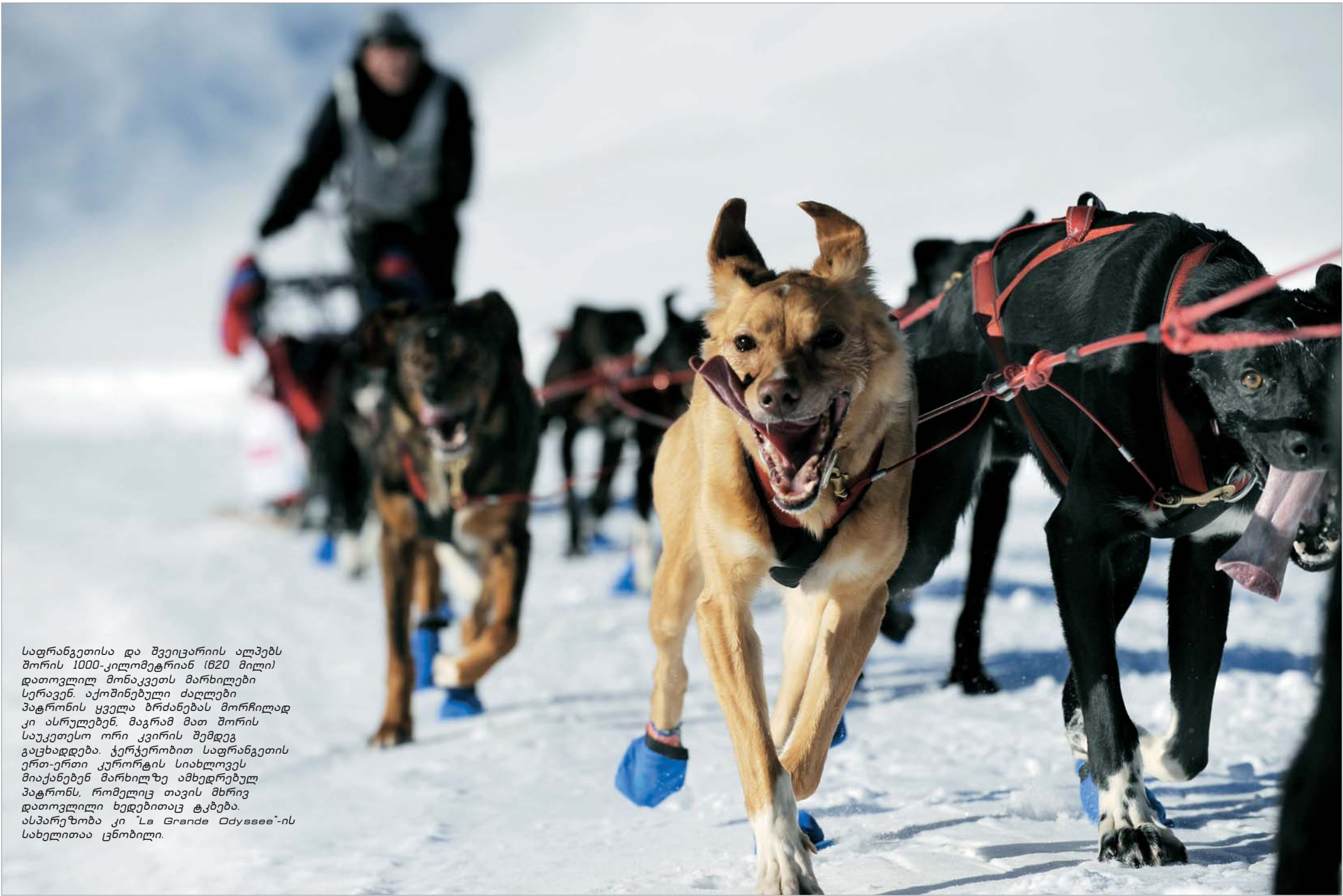
საფრანგეთისა და შვეიცარიის ალპებს შორის 1000-კილომეტრიან (620 მილი) დათოვლილ მონაკვეთს მარხილები სერავენ. აქოშინებული ძაღლები პატრონის ყველა ბრძანებას მორჩილად კი ასრულებენ, მაგრამ მათ შორის საუკეთესო ორი კვირის შემდეგ გაცხადდება. ტერტერობით საფრანგეთის ერთ-ერთი კურორტის სიახლოვეს მიაქანებენ მარხილზე ამხედრებულ პატრონს, რომელიც თავის მხრივ დათოვლილი ხედებითაც ტკბება. ასპარეზობა კი 'La Grande Odyssee'-ის სახელითაა ცნობილი.