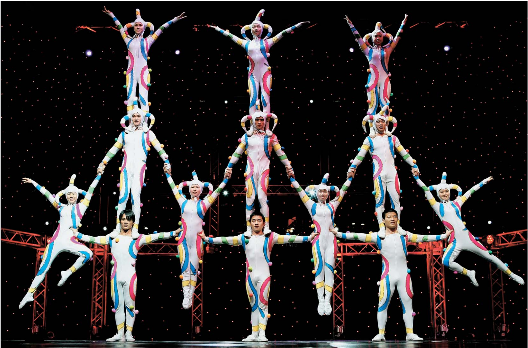
ავსტრალია. სიდნეის დიდმა ცირკმა ახალი წლის დასაწყისიდანვე ახალი პროგრამა შესთავაზა მაყურებელს. მსოფლიოს პრესა აღაპარაკდა ამ პროგრამის სილამაზესა და მსახიობთა მიერ ვირტუოზულად შესრულებულ ტრიუკებზე. თუმცა, ყველაზე საინტერესო ისაა, რომ ახალი პროგრამა ესტეტიკით გამოირჩევა. სიდნეის საცირკო თეატრის მაგალითზე, შეიძლება კიდევ ერთხელ აღინიშნოს ის, რაც ისედაც ცნობილია: თანამედროვე ცირკი მაღალი და რაფინირებული ხელოვნების სიმალღებებისკენ მიისწრაფვის და ვინ იცის ამ გზაზე რა შეუძლით ხელს მსახიობებს, რომლებიც თუნდაც სიდნეიში, ყოველ საღამოს ასრულებენ დადგმას "ჰაეროვანი სიზმრები". - ნარმოდგენას ჰაერში, რომელსაც უახლოეს ხანებში მსოფლიოს დიდ ქალაქებშიც იხილავენ.