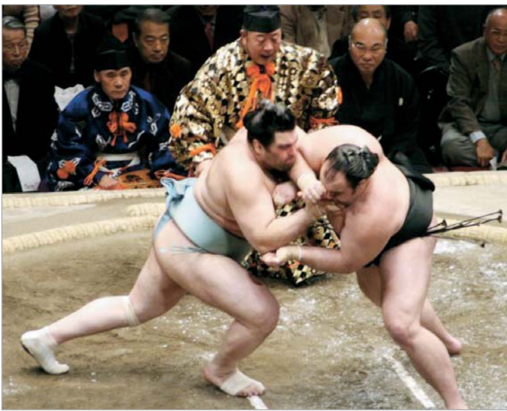
ქართველებმა ბაშოზე ვერ იყოჩაღეს

ტოკიოში მიმდინარე სუმოს სუპერთურნირის მეექვსე დღე ქართველი სუმოსტებისთვის ნაწილობრივ გამოდგა - კოკაიმი და ტოჩინოშიმა დამარცხებულმა დატოვეს დოჰო. სამაგიეროდ, კვლავაც დაუმარცხებელია დაბალ დივიზიონში მოასპარეზე გაგამარუ. უმაღლეს - მაკუშიტა დივიზიონში დასავლეთის მეთხუთხე მთავარს აარანთან იორიკირით წააგო და 2 გამარჯვების წილ 4 მარცხი დაუგროვდა. არანი იგივე ალაბა გაბარა და, ცხადია, ტოკიოს "რიოგოკუ კოკუგიკანში" რუსეთს წარმოადგენს. მონღოლ ტამაგაშისთან დამარცხდა ლევან გორგაძე. ქართველი გოლიათი ტოკიოში დასავლეთის მე-11 მაგამარუს წოდებით გამო-