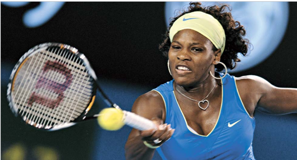
უილიამსმა რუსები არ გაახარა.

სერენა უილიამსის წყალობით ავსტრალიის ღია პირველობის ფინალი ქალთა გათამაშებაში წმინდა რუსული არ იქნება. არადა არსებობდა დიდი შანსი იმისა, რომ მელბურნში სწორედ რუსებს გაეთამაშათ ავსტრალიის ღია პირველობის გამარჯვებულის ტიტული. თავად განსაჯეთ, გუშინ განმართულ ნახევარფინალებში სამი რუსი გოგონა ასპარეზობდა. საბოლოოდ კი ფინალში სერენა უილიამსი და დინარა საფინა გავიდნენ, ალსანიშნავია, ისიც, რომ ამ ორი ჩოგბურთელის დაპირისპირებაში არა მხოლოდ ტურნირის გამარჯვებული არამედ რეიტინგის პირველი ჩოგანიც გაიკვეცა. ავსტრალიის ღია პირველობაზე კი სულ რამდენიმე მატჩი დარჩა გასამართი, დავინჯოთ ქალბები, რომლებმაც გუშინ ფინალისტები გაარკვიეს. თავდაპირველად კორტზე სერენა უილიამსი და ელენა დემენტიევა გავიდნენ. მიუხედავად იმისა, რომ დემენტიევა მთელი ტურნირის განმავლობაში მაღალი დონის ჩოგბურთის აჩვენებდა, ხოლო სერენა ორჯერ მარცხს ძლივს გადაურჩა, ნახევარფინალური დაპირისპირება მთლიანად ამერიკელის კარნახით წარმართა და უილიამსმა მატჩი ორ სეტში ანგარიშით 6:3, 6:4 მოიგო.