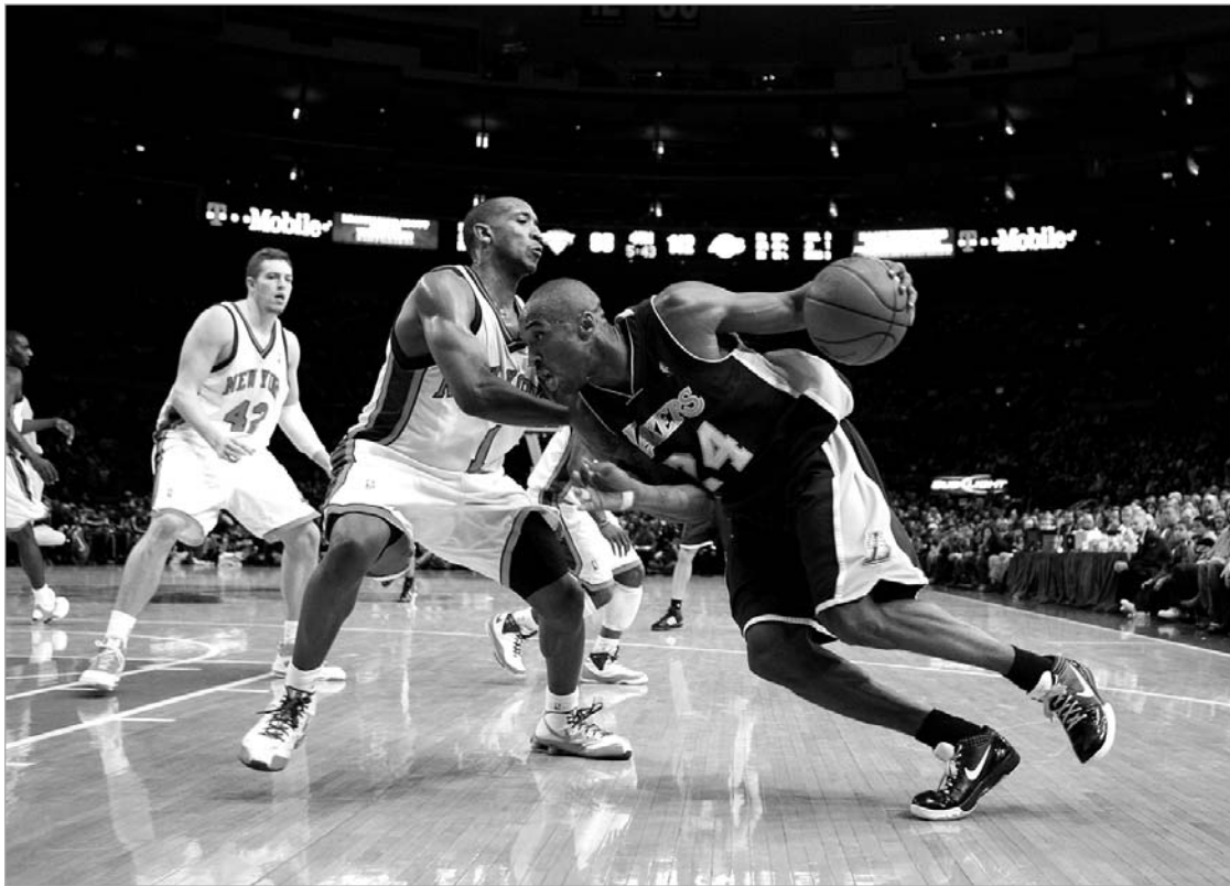
"მედისონ სკვერ გარდენში" კობი ვერ შეაჩერეს

ორიოდე სიტყვა რეკორდებზე, რომელთაგან ერთი ბრაიანტმა ლეგენდარულ მაიკლ ჯორდანს ჩამოართვა. ლიგის ისტორიაში "ნიქსის" წინააღმდეგ თამაშში ერთ კალათბურთელს აქამდე 55 ქულაზე მეტი არ ჰქონდა ჩაგდებული. ეს რეკორდი ჯორდანს ეკუთვნოდა. ახლა კი 61 ქულით ბრაიანტია რეკორდსმენი. "მედისონ სკვერ გარდენში" კი შედეგიანობის რეკორდი ეკუთვნოდა ბერნარდ კინგს, რომელმაც 1984 წელს 60 ქულა დააგროვა. კობი ეს მაჩ-