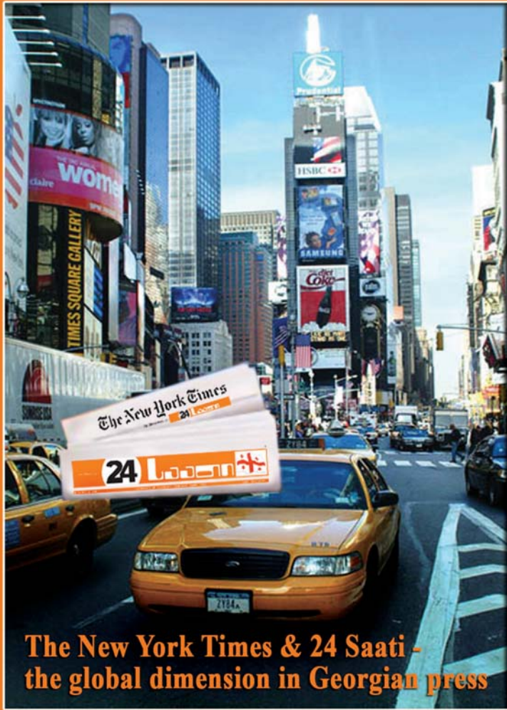
The New York Times & 24 Saati - the global dimension in Georgian press