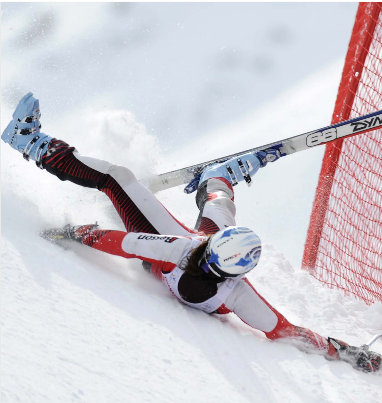
საფრანგეთის ალპებში, ამ შემთხვევაში ვალ დ'იზარში მიმდინარე სამთომოთხილამურეთა მსოფლიო ჩემპიონატი ვისთის წარმატებულია და ვისთის წარუმატებელი. ასე მაგალითად, ბელგიელმა იზაბელ ვან ბაინდერმა სუპერგიგანტში ასპარეზობისას წონასწორობა ვერ შეინარჩუნა და დამცავ ბადესთან აიჩორჩხლა. წარმატებას კი ამერიკელმა ლინდსეი ვონმა მიაღწია, რომელსაც ფეხდაფეხ მიყვანენ მასპინძელი მარი მარშან-არვიე და ავსტრიელი ანდრეა ფიშბახერი.

From January 2009, "24 Saati" newspaper is a corporate partner of "The New York Times" and enjoys the right to use information, photo and graphic base of "The New York Times".