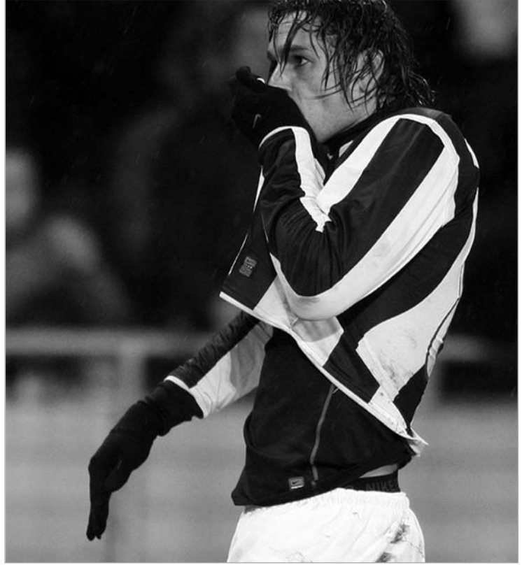
ამაური კვლავ არჩევანის წინაშეა

დუნგას გამოძახების შემდეგ ამაური სწორედ ბრაზილიის ნაკრების ფეხბურთელი გახდებოდა, რომ არა ერთი დეტალი. საქმე ის არის, რომ ტურნირის “იუვენტუსის” მესვეურებმა ამაური ნაკრებში არ გაუშვეს, მიზეზად კი ის დაასახელეს, რომ ფეხბურთელი დაგვიანებით გამოიძახეს.