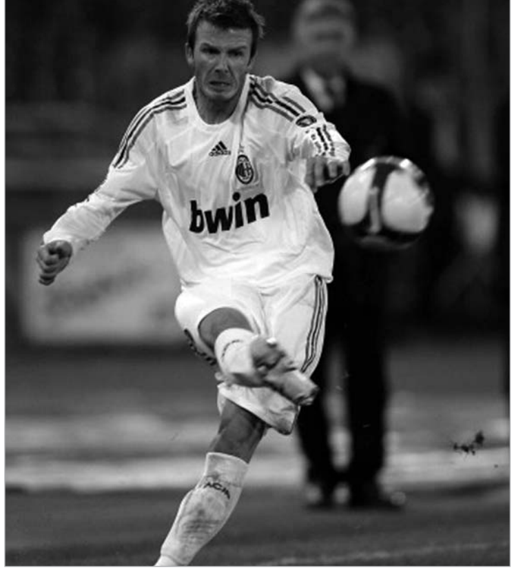
ბექსემ “მილანის” დატოვება არ უნდა

“მილანის” ვიცე-პრეზიდენტი ადრიანო გალიანი აცხადებს, რომ ყველაფერი გაკეთდება იმისთვის, რომ დევიდ ბექსემი, რომელიც კარგად მოერგო გუნდს და რამდენიმე საგოლე გადაცემა მიითვალა, დარჩეს იტალიურ გუნდში. “ლოს ანჯელეს გელექსისთან” დადებული ხელშეკრულებით ინგლისელი ფეხბურთელი “როსონერიში” მარტამდეა განათხოვრებული. “ჩვენ ვმუშაობთ, რომ ბექსემი შევიწინარწუნოთ. ვფიქრობ, ეს მისი სურვილიცაა. “მილანი” ყველაფერს გააკეთებს იმისთვის, რომ ბექსემი ჩვენთან დარჩეს უფრო მეტ ხანს, ვიდრე ეს კონტრაქტითაა გათვალისწინებული. ცხადია, ჩვენ გვინდა მისი შენარჩუნება და სრულფასოვანი კონტრაქტის გაფორმება. თუ “გელექსი” მოსურვებს ჩვენთან მოლაპარაკებას, მოხარულნი ვიქნებით. ბუნებრივია, მას აქვს ბექსემზე მთავარი უფლება. დევიდ გუნდში 9 მარტს უნდა დაბრუნდეს. ჩვენც ამ