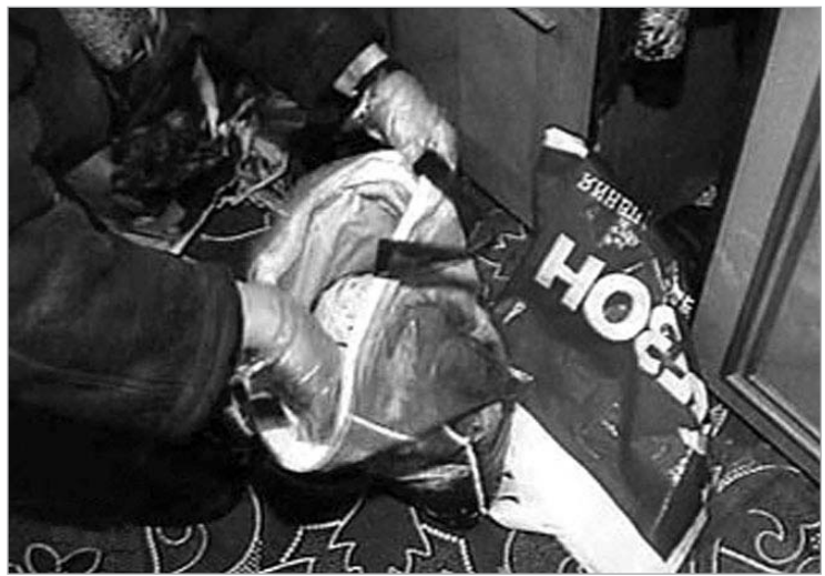
ადგილი, სადაც პოლიეთილენის პარკები იპოვეს

პეტერბურგში, მოსკოვის რაიონში შემთხვევითი გამგლე- ლები საშინელი აღმოჩენის მომ- სწრეები გახდნენ. ორჯონიკის ქუჩაზე, №21-ე კორპუსთან, აღმოჩენილი შიგნულსა და კანის ნაფლეთებით სავსე ორი პოლიეთილენის პარკი იპოვეს.