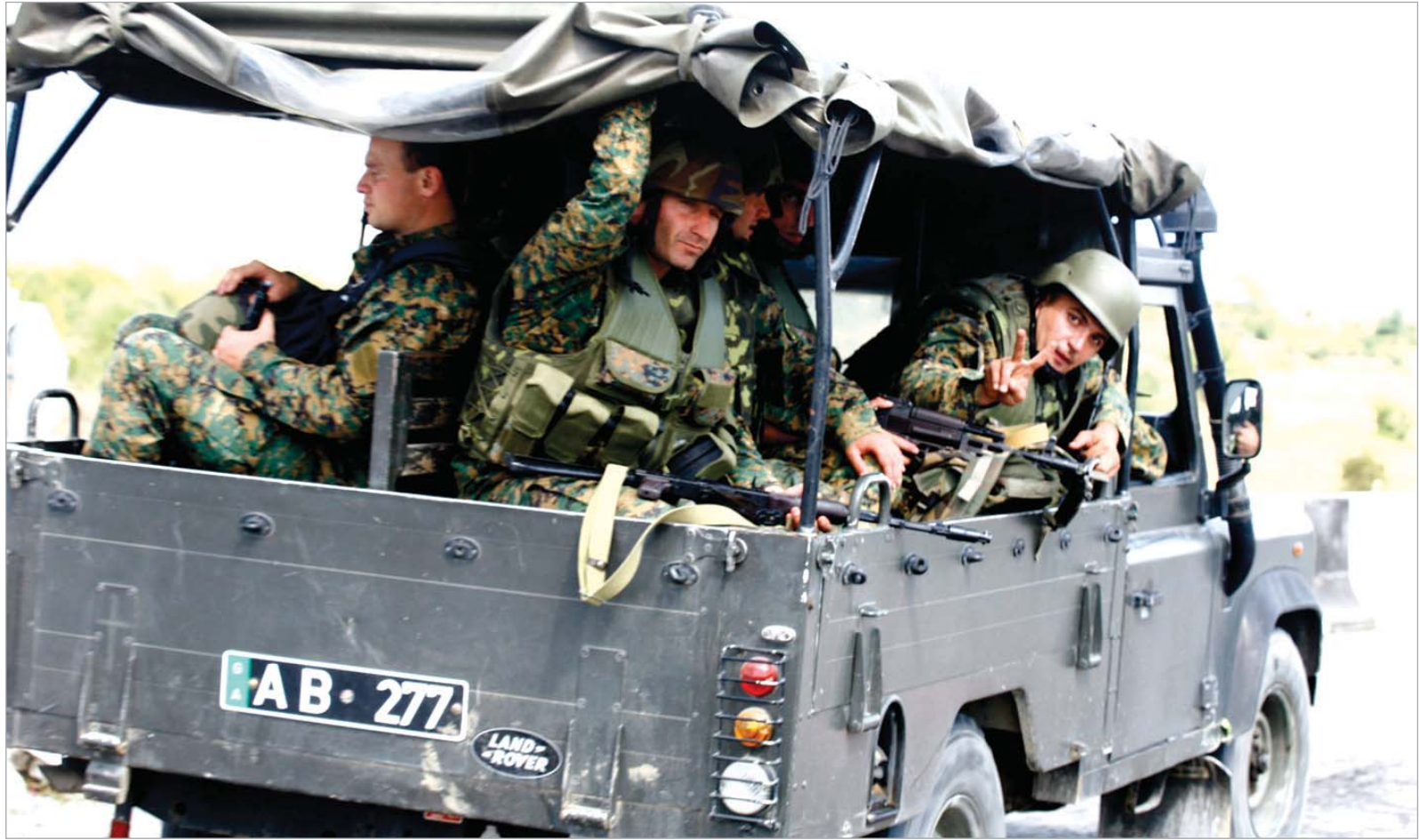
ქართული რეგულარული ჯარი ვაჟაკურად და მოხერხებულად იბრძოდა და ცხინვლიდან პოლიტიკური ხელმძღვანელების ბრძანების შესაბამისად გავიდა.

რუსმა სამხედრო და პოლიტიკურმა ექსპერტმა პაველ ფელგენგაუერმა ჟურნალ "კონტინენტი" გამოაქვეყნა ვრცელი სტატია, რომელიც რუსეთ-საქართველოს ომის ანალიზს მიეძღვნა. ექსპერტი ვრცლად მიმოიხილავს რუსეთის მზადებას საქართველოსთან ომისთვის და იმასაც აღნიშნავს, რომ საქართველოს წინააღმდეგ ახალი აგრესია გამოიწვევს არ არის. გათვალისწინებულია ფელგენგაუერის სტატიიდან.