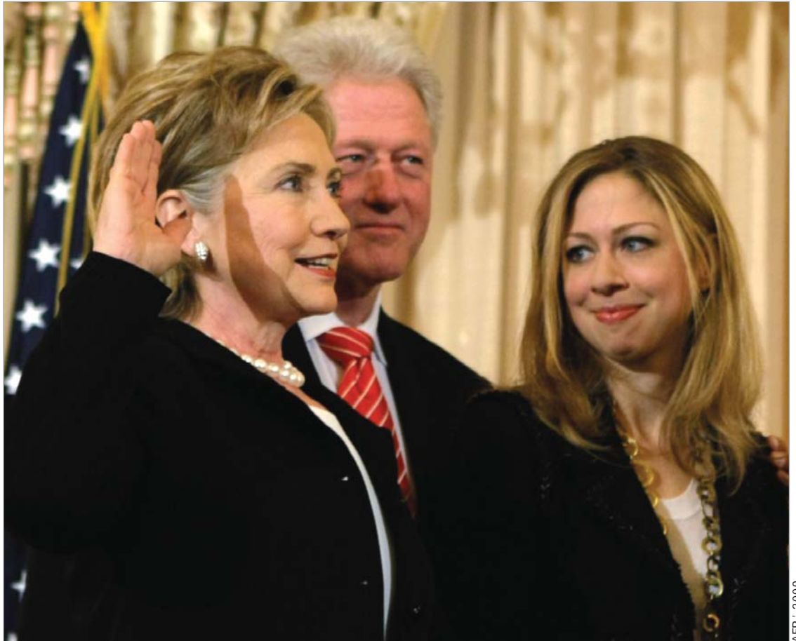
ჰილარი კლინტონი ფიცს დებს

ბარაკ ობამას ადმინისტრაციის ოფიციალური წარმომადგენლის თქმით, რომელმაც ჟურნალისტებთან საუბარში ანონიმურობის შენარჩუნება არჩია, თეთრი სახლის მეთაურმა ერაყის პრეზიდენტსა და პრემიერ-მინისტრთან 2 თებერვალს სატელეფონო საუბრისას ბაღდადში ამჟამინდელ ელჩ რაიან კროკერის შემცვლელის კანდიდატურა განიხილა. რაიან კროკერი ერაყში ელჩად ორი წლის წინათ დაინიშნა. ჯერჯერობით უცნობია, ოფიციალურად როდის დასახელდება ერაყში ელჩის თანამდებობაზე კარიერული დიპლო-