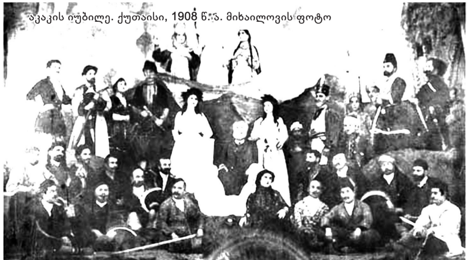
აკაკის იუბილე. ქუთაისი, 1908 წ.წ.

ძნელი შესამჩნევი არაა, რომ პოემაში ამ ეპიზოდის შეტანა დამოუკიდებლად იმისა, მართლა მოხდა ასეთი ამბავი თუ იგი ავტორის გამოგონილია, მონშობს პოეტის მიერ იმ მაღალი აზრის აღიარებას, რომლის მიხედვით ისტორიაში გადამწყვეტ როლს ხალხთა მასები ასრულებდა და რომ სწორედ უბრალო ხალხია ისტორიის შემოქმედი, მისი მთავარი მამოძრავებელი ძალა. აქედან თავისთავად ცხადია, თუ რატომ მიაჩნდა აკაკი წერეთელს ხალხის სამსახური პოეზიის უმაღლესი დანიშნულებად. ხალხი და სამშობლო იყო დიდი პოეტის სიყვარულის მთავარი საზრუნავი და სწორედ მათი ბედნიერებისა და თავისუფლებისთვის უხმობდა იგი გარდასულ დროთა სახელოვან გმირებს.