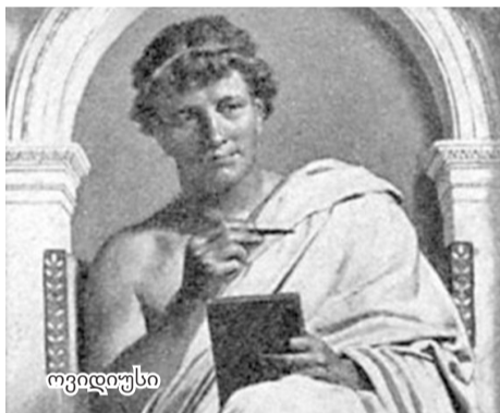
ოვიდიუსი მტიკინულად თანამედროვე ოვიდიუსი ჩემი ცოდვა ისაა, რომ მქონდა თვალები.

ავგუსტუსის მმართველობის პერიოდი, ე.წ. ოქროს ხანა, რომელიც ლიტერატურისა და ხელოვნების აყვავების ხანა იყო. ამ დროს მოღვაწეობდნენ ვერგილიუსი (ძვ. წ. აღ-ით 70 - ახ. წ. აღ-ით 19), ჰორაციუსი (ძვ. წ. აღ-ით 65 - ახ. წ. აღ-ით 8), ოვიდიუსი (ძვ. წ. აღ-ით 43 - ახ. წ. აღ-ით 17). სწორედ მათ შექმნეს რომაული პოეზიის კორიფთა კოლეგიუმი, რომელმაც შემდეგ დიდი როლი ითამაშა ევროპული ლიტერატურის ისტორიაში.