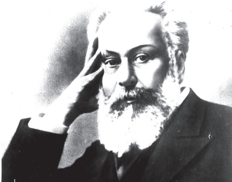
სამშობლოს სიყვარული, რომელიც ყოველგვარ სისასტიკეზე ძლიერი აღმოჩნდა.

მაგრამ აკაკის ეს სიხარული, სამწუხაროდ, ნაადრევი აღმოჩნდა: მოკლე მუცლის ნაცვლად ხალხს მოევიწია უხეშობით სახელგანთქმული ალექსანდრე III, რომელმაც მთელ რუსეთში სასტიკი რეპრესია გაამეფა. განსაკუთრებით ძნელ მდგომარეობაში აღმოჩნდნენ რუსეთის მიერ დაჩაგრული ქვეყნები, მათ შორის – საქართველო. ქართველი ერის მრავალსაუკუნოვანი ისტორიაში ძნელია დავასახელოთ იმაზე უფრო მძიმე დრო, ვიდრე ალექსანდრე მესამის ხანა იყო. მისი ჩიონიკები აბუჩად იგდებდნენ ქართულ კულტურას და ისტორიას, ეროვნულ ტრადიციებს. აიკრძალა ქართული ენა, აიკრძალა თვით ჩვენი სამშობლოს სახელის ხსენებაც კი. „საქართველოს“ ნაცვლად გაზეფეს უნდა ეწერათ „თბილისის გუბერნია“ და „ქუთაისის გუბერნია“. ერთი სიტყვით, ქართველი ერის სიკვდილ-სიცოცხლის საკითხი დადგა. ასეთ ვითარებაში ერის სასიცოცხლო ინტერესების დასაცავად თავგანწირული ბრძოლა გაჩაღეს საქართველოს ეროვნულ-განმათავისუფლებელი მოძრაობის სახელოვანმა მოღვაწეებმა, რომლებსაც სათავეში ილია ჭავჭავაძე და აკაკი წერეთელი ჩაუდგნენ. რუსეთის უხეშ ძალადობას მათ დაუპირისპირეს