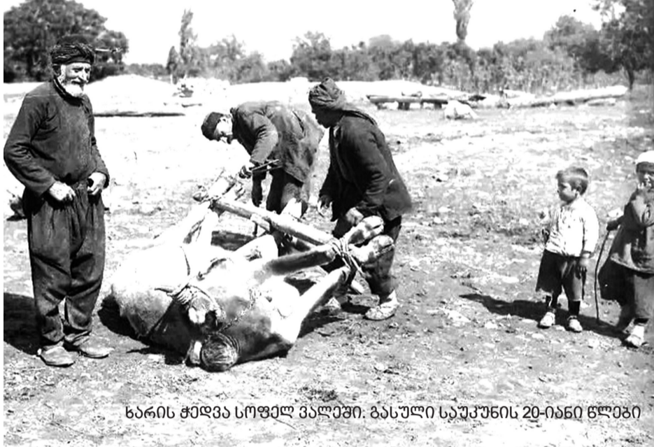
ხარის ჭადვა სოფელ ვალეში. გასული საუკუნის 20-იანი წლები