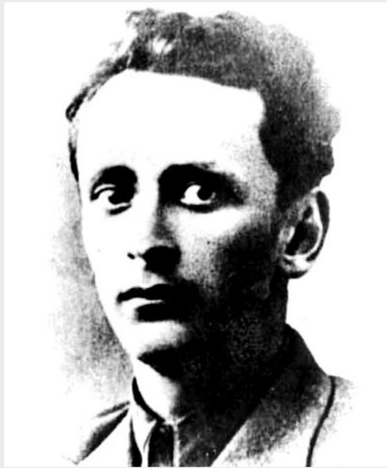
ამქვეყნად როცა ავიდგი ენა, პირველი სიტყვა იყავი დედა, დედა სიზმრებმა არ მომასვენა შენს ბნელ საკანში გადმომახედა.