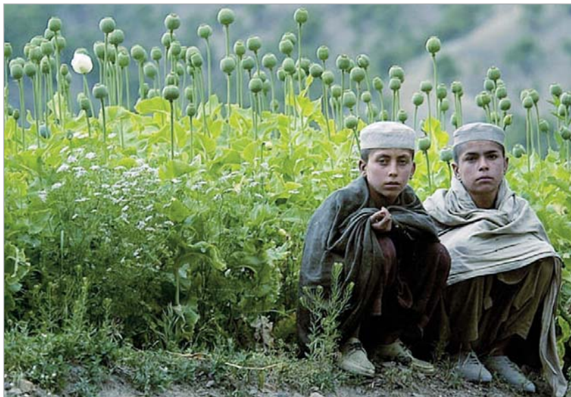
განსაკუთრებით სერიოზული ვითარებაა ავღანეთის სამხრეთ ნაწილში, სადაც ნარკოტიკული მცენარეები იზრდება და ადვილად ხელმისაწვდომია.

განსაკუთრებით სერიოზული ვითარებაა ქვეყნის სამხრეთ ნაწილში, სადაც ნარკოტიკული მცენარეები იზრდება და ადვილად ხელმისაწვდომია. გილმენდის მოსაზრებზე ყან-