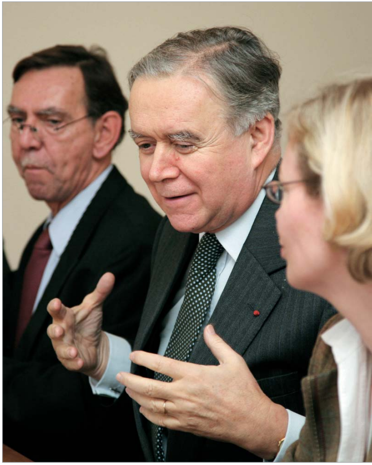
პიერ მორელი: "ეს იყო ყველაზე პროდუქტიული და წარმატებული მოლაპარაკება."

ხელმძღვანელმა, სახელმწიფო მდივნის თანაშემწემ დენიელ ფრიდმა მოლაპარაკებების შემდეგ გამართულ პრესკონფერენციაზე მიღწეული შეთანხმება დადებითად შეაფასა. იმავდროულად, მან აღნიშნა, რომ აუცილებელია დენიელთა დაბრუნების საკითხის მოგვარება.