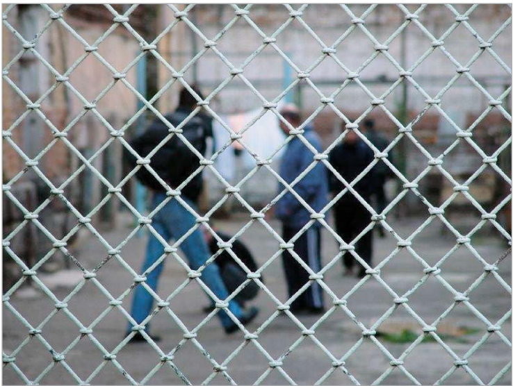
"პატიმრობის კოდექსის" მიზანი პენიტენციური სისტემის რეფორმირებაა.