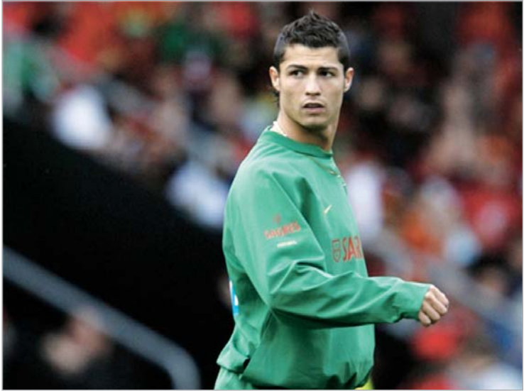
ხანდახან რონალდუსაც უსტვენენ

გასული წელი "მანჩესტერის" პორტუგალიელ ვასკულავ კრიშტიანუ რონალდუსთვის წარმატებული გამოდგა. 24 წლის შემტევმა ჩემპიონთა ლიგაშიც იმარჯვა, ინგლისის ჩემპიონის ტიტულიც მოიგო, ამას მსოფლიოს საკლუბო ჩემპიონატიც გამარჯვება დაუმატა და ყველა ინდივიდუალური პრიზიც დაისაკუთრა. მოკლედ, 2008 წელი შეიძლება რონალდუს წლადაც ჩაითვალოს, თუმცა ისიც უნდა ითქვას, რომ ფეხბურთელი მიდნაულზე შეჩერებას არ აპირებს. ანდა რატომ უნდა შეჩერდეს, როდესაც მხოლოდ 24 წლისაა და თითქმის მთელი კარიერა წინ აქვს. ინტერვიუ, რომელსაც ვთავაზობთ, რონალდუმ "მანჩესტერის" ოფიციალური ვებგვერდის ჟურნალისტს მისცა და "რეალში" შესაძლო გადასვლაზე საუბრისგან თავი შეიკავა.