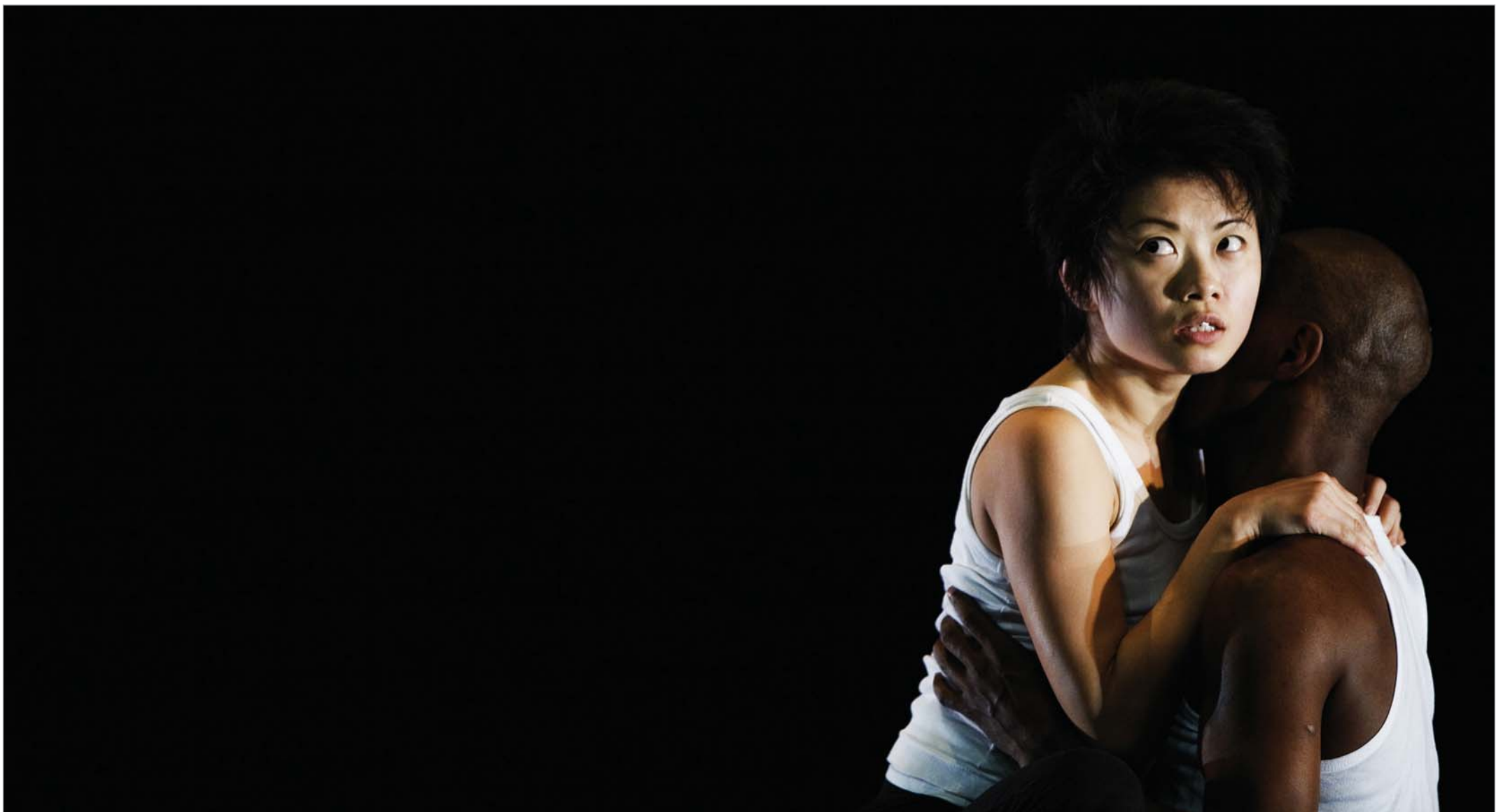
სამხრეთ აფრიკის დედაქალაქ იოჰანესბურგში ცეკვის ცნობილი ფესტივალი FNB Dance Umbrella გაიხსნა. აღნიშნული ფესტივალი A კატეგორიის ლონისძიებებს განეკუთვნება და მსოფლიოს საუკეთესო პროფესიონალ მოცეკვავეებს აერთიანებს. სპეციალურად ფესტივალისთვის იოჰანესბურგში 21 საცეკვაო სცენა ააგეს, ყოველი მათგანი კი თანამედროვე ცეკვის საუკეთესო კოლექტივებსა და ინდივიდუალურ მოცეკვავეებს ეთმობა.