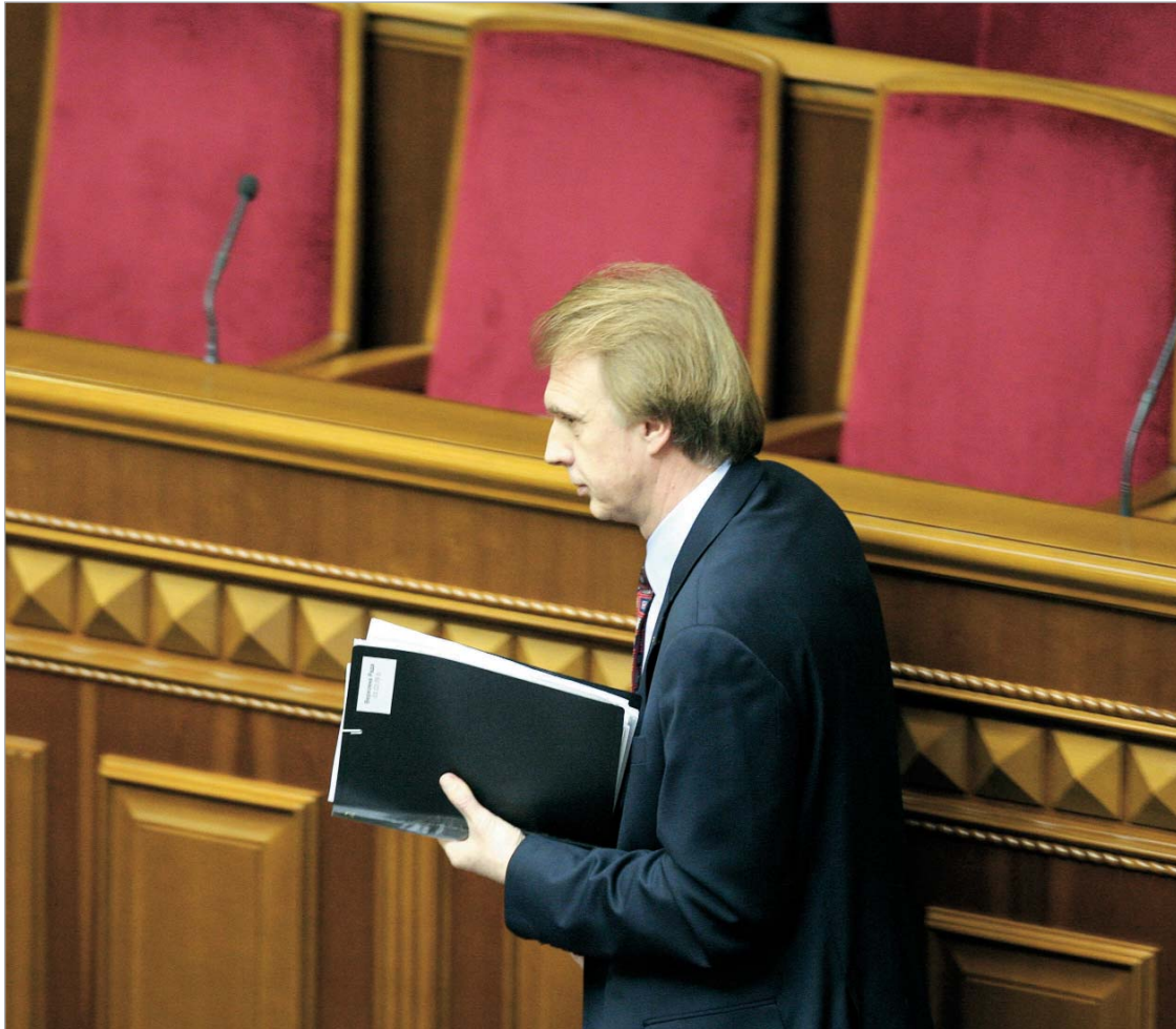
ვლადიმერ ოგრიზკოს გადარჩენა ვერც პრეზიდენტმა და ვერც თანაპარტიელებმა ვერ შეძლეს.

ექსპერტებისა და პოლიტიკოსების აზრი საგარეო საქმეთა მინისტრის გადაყენებაზე ძირითადად ორად გაიყო. თითქმის არ დარჩენილა პოლიტიკური ძალა და მეტ-ნაკლებად გავლენიანი პოლიტიკოსი, ამ თემაზე აზრი რომ არ გამოეთქვა. ყველაზე რადიკალურები, ცხადია, "ნაშა უკრაინას" წევრები და მათი მომხრე ექსპერტები იყვნენ. ისინი მიიჩნევენ, რომ ქვეყანაში ძლიერდება პრორუსული ორიენტაცია, ქვეყნის პარლამენტის 250 (450-დან) წევრი მზად არის, შეასრულოს რუსეთის შეკვეთა, იულია ტიმოშენკოს ბლოკი ამ შეუთანხმებელი გადაწყვეტილებით არღვევს კოალიციას და სხვა. "რეგიონების პარტიისა"