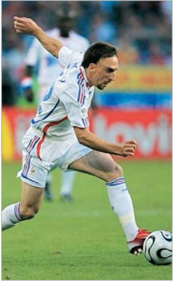
რიტიკებს. "მე დავიჩივლე მწვრთნელთან, რომ მარცხენა ფრთიდან შეტევისას საკმარისი მხარდაჭერა არ მაქვს, - უთხრა მან "ბილდს", - მან მიპასუხა, რომ მართალი ვარ." "გასულ სეზონში ხუთი მანსიდან სამს გოლით ვავიგრძენებ-

სხვა მხრივ, ბეკენბაუერი უერთდება "ბაიერის" კრიტიკას და თვლის, რომ გუნდი მეორე წრეში არც ისე დამაჯერებლად გამოიყურება. "ბრემენში ფრე ურიგო შედეგი არ არის, მაგრამ როცა 75 წუთის განმავლობაში ერთი მოთამაშით მეტი გყავს, ფრე მიუღებელი ხდება. 5 შეხვედრაში 4 ქულა ძალიან ცოტაა და, ცხადია, ამაზე პასუხი მწვრთნელსაც მოეთხოვება და მოთამაშებსაც, - განაცხადა მან ერთ-ერთი ბაიერნული ტელეარხით გამოსვლისას, - თუ შედეგები არ გაუმჯობესდება, კლინსმანი მშვიდ გარემოში ვერ იმუშავებს."