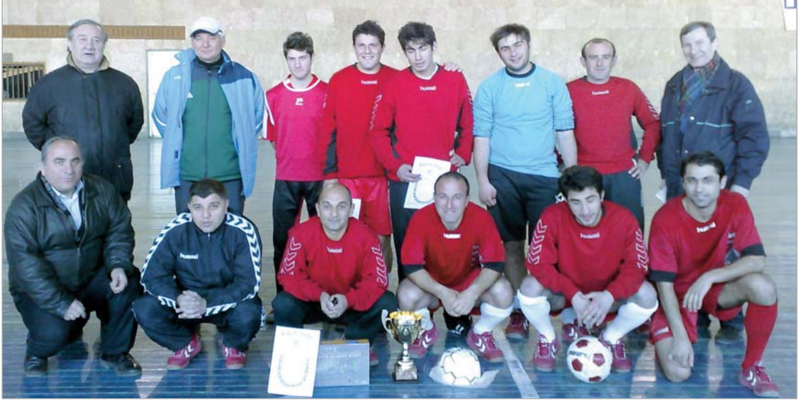
თავდაცვის სამინისტროს გუნდის წევრი გახდა. საქართველოს სპორტსმენთა