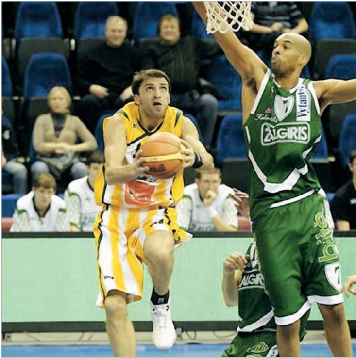
"მანუს" მორიგი შეტევა