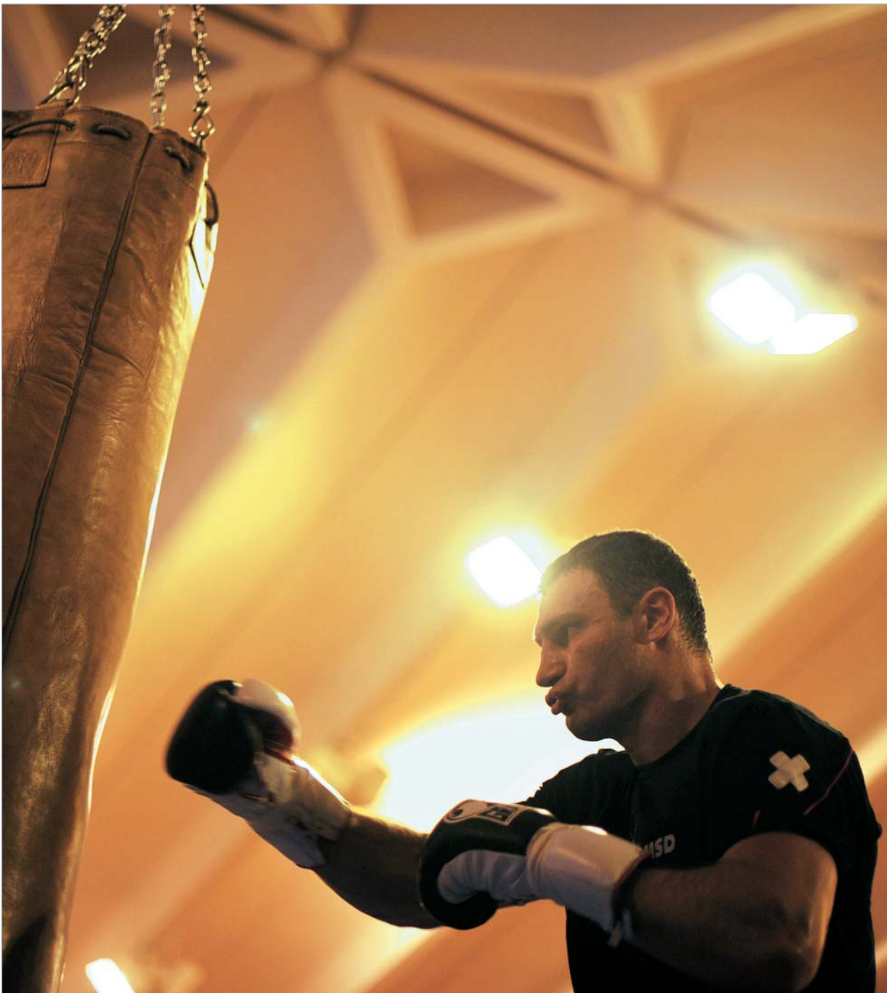
მძიმე წონაში დაბრუნებული კრივის მსოფლიო საბჭოს (WBC) სპატიო ჩემპიონს ვიტალი კლიჩკოს, რომელმაც სპატიო წოდება ნიგერიელ სემიუელ პიტერზე გამარჯვების შემდეგ დამსახურებული ჩემპიონის წოდებაზე გაცვალა, მორიგი შერკინება ელის. 21 მარტს შტუტგარტში უკრაინელი გიგანტი კუბელ ხუან კარლოს გომესს ხვდება. კაცმა არ იცის, რითი დამთავრდება მათი შერკინება. ერთი რამ ფაქტია: თუ უკრაინელმა საბჭოს ქამარი წააგო, მისი დამბრუნებული აღარ არის, რადგან რინგზე მუშტების ქნევა მოხერხდება. თუ მაინც გადაწყვიტა, მხოლოდ იმიტომ, რომ რინგიდან ჩემპიონად წავიდეს. ასე კი შეიძლება დაუსრულებლად გაგრძელდეს.

From January 2009, "24 Saati" newspaper is a corporate partner of "The New York Times" and enjoys the right to use information, photo and graphic base of "The New York Times".