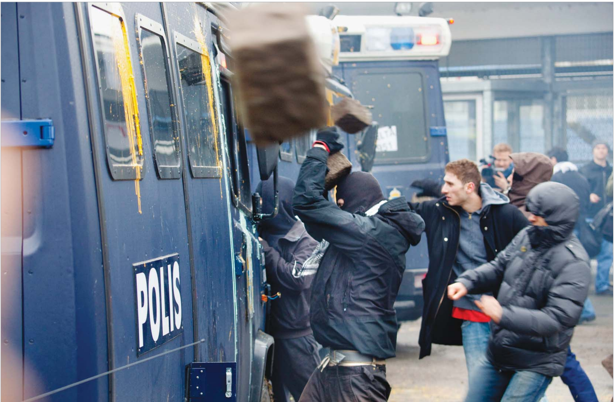
ამ უქმეებზე მსოფლიო საჩოგბურთო სამყაროს დევისის თასის გათამაშების ტაქტამ გადაუარა. ყურადღება მიიპყრო შვედეთისა და ისრაელის ნაკრებთა დაპირისპირებამ. მალმოში (შვედეთი), "ბალტიკ არენაზე", მასპინძელთა და ისრაელის ნაკრებთა დაპირისპირებას წინ უძღოდა საპროტესტო აქცია, რომლის მონაწილეები ისრაელის ნაკრების გათამაშებიდან მოხსნის მოთხოვნით გამოდიოდნენ. მოწოდება ასე ყლურდა: "შენყვიტეთ მატჩი", "არა ძალადობას" (ისრაელის მხრიდან ღაზას სექტორზე განხორციელებული სამხედრო ოპერაცია იგულისხმება). აქციის მონაწილენი თანდათან ისე ახმაურდნენ, რომ მათ დასაშოშმინებლად სამართალდამცავებს უხმეს. მათ გამოჩენას კი ის მოჰყვა, რომ ნ ათასამდე პროტესტანტმა პოლიციას ქვები დაუშინა.

From January 2009, "24 Saati" newspaper is a corporate partner of "The New York Times" and enjoys the right to use information, photo and graphic base of "The New York Times".