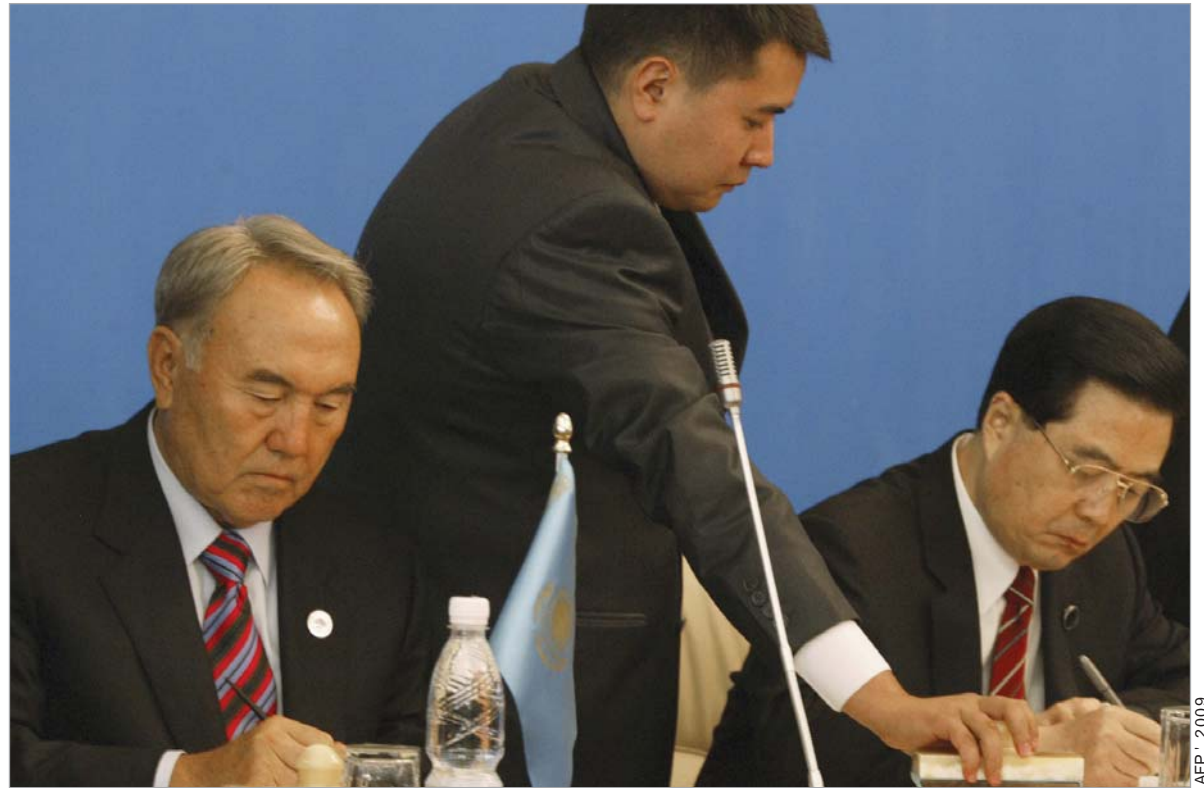
ყაზახეთის და ჩინეთის ლიდერები.