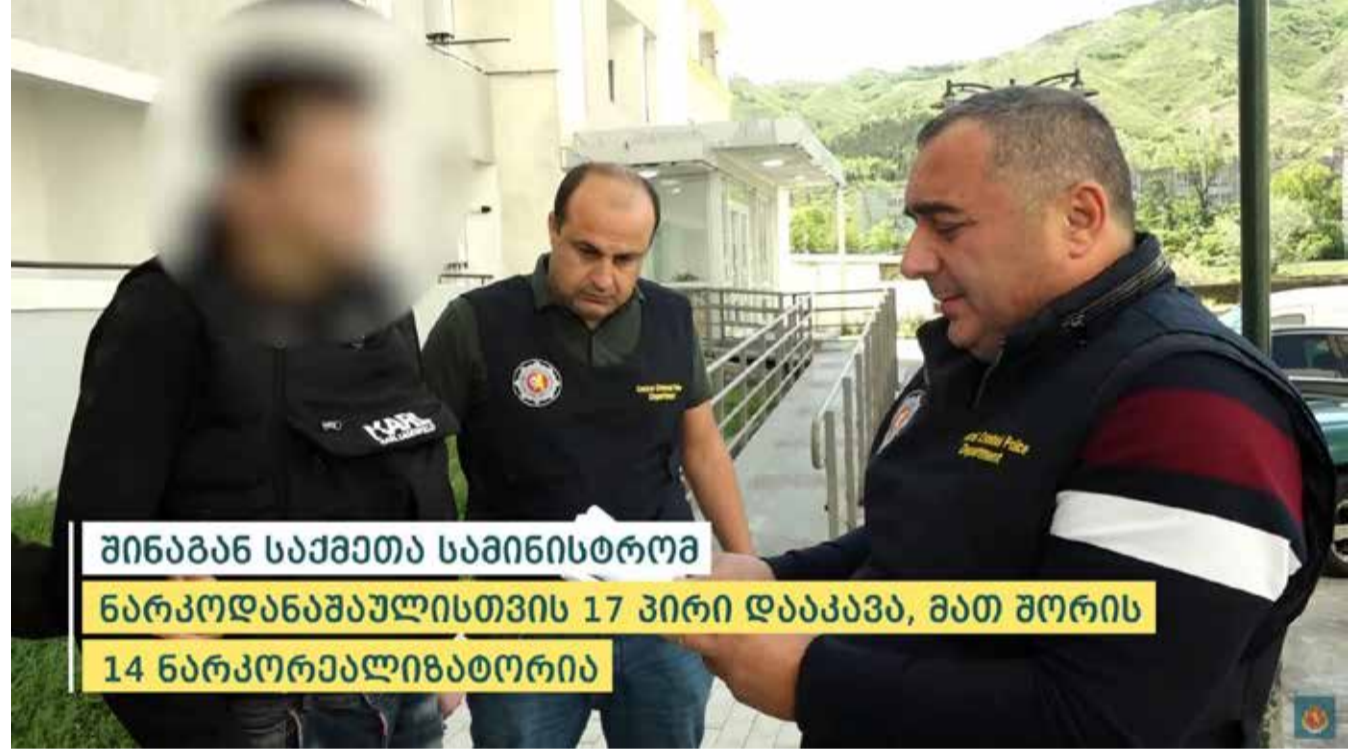
შინაგან საქმეთა სამინისტრომ ნარკოდანაშაულისთვის 17 პირი დააკავა, მათ შორის 14 ნარკორეალიზატორია

დიდი და განსაკუთრებით დიდი ოდენობით ნარკოტიკული საშუალებების უკანონო შექმნა-შენახვის, გასაღების, გასაღების მცდელობის, მცენარე კანაფის ან მარიხუანას უკანონო გასაღებისა და ცეცხლსასროლი იარაღის მართლსაწინააღმდეგო შექმნა-შენახვის ფაქტებზე გამოძიება საქართველოს სისხლის სამართლის კოდექსის 260-ე მუხლის 1-ლი, მე-3, მე-4, მე-5 და მე-6 ნაწილებით, 19-260-ე მუხლის მე-4 და მე-5 ნაწილებით, 273-ე პრიმა მუხლის მე-8 ნაწილით და 236-ე მუხლის მე-3 ნაწილით მიმდინარეობს.