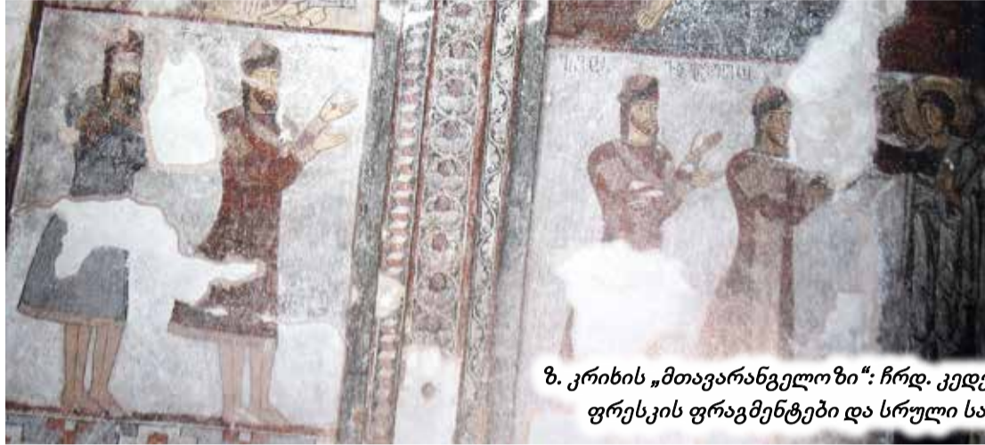
ზ. კრიხის „მთავარანგელოზი“: ჩრდ. კედელზე არსებული ოთხი ქტიტორის ფრესკის ფრაგმენტები და სრული სახე 1991 წლის მინისძვრამდე და ...