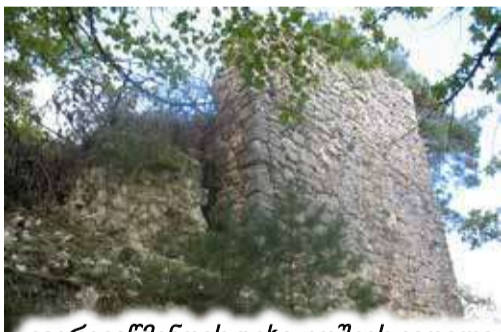
კვირიკეწმინდის ციხე-კოშკის კედელი და ტაძრის ფასადი სამხრეთიდან

იქმნება ასეთი სურათი: გვიან შუასაუკუნეებში კრიხის ხევს იაშვილები დაეუფლნენ, კვირიკეწმინდას – კვიტაშვილები, ხოლო ორთავე გვარს 1493 წელს (წარწერაში აღნიშნულია „რჰა“) ერთობლივად აღუშენებიათ და მოუხატავთ მეზობლად მდებარე ბეთლემის საყდარი.