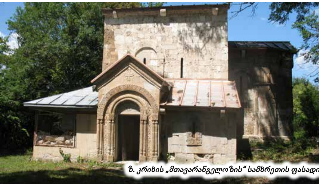
ზ. კრიხის „მთავარანგელოზის“ სამხრეთის ფასადი და მისი კარიბჭის ფრაგმენტი

ვთქვათ, ფრესკაზე გამოსახული დიდებულები XI საუკუნის პირველი ნახევრის ნარწომადგენლები არიან. ასეთ შემთხვევაში რა ვუყოთ რატი ბაღვაშს და მის ძეს კახაბერს – რაჭის პირველ ორ ერისთავთ-ერისთავს, რომლებიც სწორედ ამ დროს მოღვაწეობდნენ? მართალია, მათი თავდაპირველი რეზიდენცია (მცირე ციხესიმაგრე და პატარა ორის ორი ეკლესია) ზემო კრიხიდან მოშორებით იყო, მაგრამ ეს იმას როდი ნიშნავს, რომ დანარჩენ რაჭას ვერ აკონტროლებდნენ – ნიკორწმინდას, წესს, ძველ ბარაკონსა და მინდას ციხეს თავიანთ საბატონოდ არ მიიჩნევდნენ; კრიხის სხვა კი იქვე მდებარეობდა და არამგონია, კახაბერ რაჭის ძეს უშფოთველად ეყურებინა ყურისძირში მცხოვრები ვასალის ზვაობისთვის. აქ სამი ვერსია იბადება: 1) ტაძარი, შესაძლოა, იმ დროს მოიხატა მეორეულად, როცა რაჭის ბაღვაშთა, კონკრეტულად კი რაჭის ძალაუფლება მყარი არ იყო, ხოლო ვაჩიანები, როგორც ჩუბინის (იგივე სკვიმინის) ერთ-ერთი ერისთავები, ბაღვაშთა აქ გამოჩენამდე ფლობდნენ კრიხის ხეობას. მაგრამ ამ ვერსიასთან წინააღმდეგობაში მოდის ფრესკის ნარწერის მონასმი: „ესე არს ვაჩიანი“ ლიგატურითაა შესრულებული, ასეთი ფორმის ლაპიდარული ნარწერები კი XI ს-ის შუახანებამდე არ შეინიშნება ჩვენში და ისიც იშვიათად. 2) XI საუკუნის დასაწყისიდან რაჭის საერისთავო თანდათან იკლებოდა ახალი ტერიტორიებით. ჭანჭახის ხეობა (გლოლას თემი) შესაძლოა ოდნავ მოგვიანებით გადავიდა სვანეთის ერისთავის ხელიდან რაჭის ერისთავის ხელში. ასეთ შემთხვევაში გასაკვირი არ იქნება, თუ გლოლას თემის ხევისთავს საკომპენსაციოდ ქვემო რაჭაში გადასცემდნენ კრიხისხევის ტერიტორიას; 3) ხომ არ ვივარაუდოთ, რომ ფრესკაზე გამოსახული ოთხი პიროვნება სხვა-