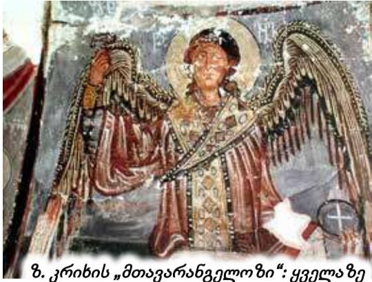
ზ. კრიხის „მთავარანგელოზი“: ყველაზე ძველი ფრესკები საკურთხევის აბსიდში

დასხვა დიდი გვარის წარმომადგენელია და თავში მდგარი, შედარებით განსხვავებული, მდიდრული კაბის მქონე კაცი, რომელსაც განმარტებითი წარწერა არ შემორჩა, სწორედ რატი ან კახაბერ რატის ძე ბაღვაშია? 4) ანგარიშგასანვივია ის მოსაზრება, რომ „მთავარანგელოზი“ მეორედ მაშინ მოიხატა, როცა ერისთავი კახაბერ რატის ძე კირილეს სახელით, ბერად იყო აღკვეცილი. იქნებ ამ პერიოდში ვაჩიანებს დამოუკიდებლობის და თავის გამოჩენის დრო დაუდგათ, ამით ისარგებლეს, მაგრამ მალევე ჩაქრნენ და აქედან წავიდნენ კიდევ? ისინი რატის ისტორიაში ამის მერე არსად არ იხსენიებიან..!