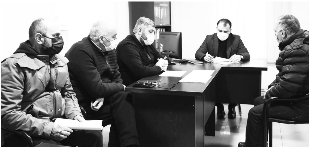
გამოიყო იმ საკითხების მოსაწესრიგებლად, რომელთა შესახებაც მოსახლეობამ მიმართა ბათუმის მერიას. ეს არის როგორც გზებისა და სპორტული მოედნის რეაბილიტაცია, ასევე, საავტომობილო ხილების მშენებლობა და სკვერის მოწყობა.

ამ ეტაპზე, კახაბრის ადმინისტრაციულ ერთეულში, ათეულობით მისამართზე მიმდინარეობს მნიშვნელოვანი სამუშაოები - სტიქიის სალიკვიდაციო და ფერდსამაგრი კედლის მოწყობა. ასევე, როგორც მისამართებზე - სანიაღვრე სისტემის რეაბილიტაცია. როგორც არჩილ ჩიქოვანმა აღნიშნა, გასულ წელს ხუთ მილიონზე მეტი ლარი