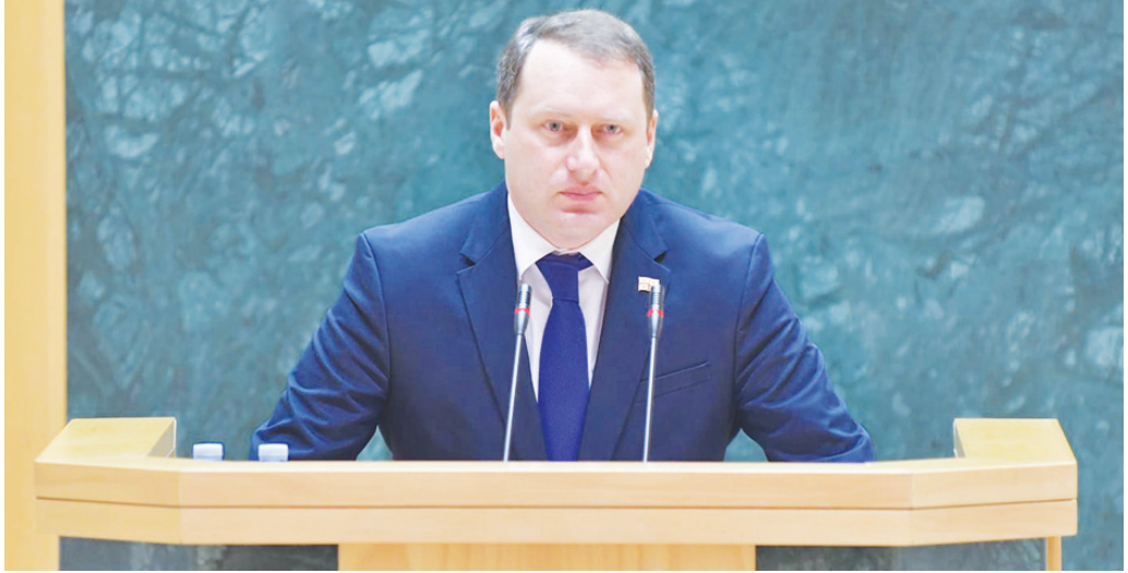
„კანონპროექტის მიზანი აჭარაში დასაქმებისა და ახალგაზრდული სფეროს ხელშეწყობის საბიუჯეტო პროგრამებში მონაწილე მოქალაქეების კეთილდღეობის ზრდაა.“