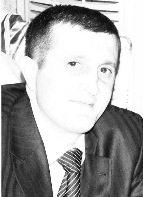
კანონის ფარგლებში უნდა მოექცეს, რეველუციური გზით ქვეყნის განვითარება კარგს არაფერს მოიტანს.

- ოპოზიციურ ფლანგზე მათ მაღალი რეიტინგი აქვთ, მაგრამ პარლამენტში შეუსვლელია ეს რეიტინგი შეასუსტა. პარლამენტის ტრიბუნის არგამოყენება, ჩემი აზრით, ძალიან დიდი შეცდომა იყო, რამაც კიდევ უფრო დააზარადა ერთიანი ნაციონალური მოძრაობა. პარტიამ შარლ მიშელის დოკუმენტზე ხელის მოწვევით ასევე დაკარგა კოალიციური ოპოზიციური მოძრაობის ჩამოყალიბების შანსი. პოლიტიკური პროცესები