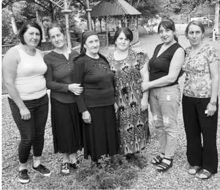
გაშენებას მივბრუნებოდით. იმდენს მაინც ვაწარმოებდით, რომ რომანს სიგარეტის შექენაში ფული აღარ დაეხარჯებოდა. პირველ წელს 600 კვადრატულ მეტრზე გავაშენეთ. 180 კი-

იყო წლები, როცა სხვათა მსგავსად, მეთამბაქოეობას მისდევდა. გასული საუკუნის 80-იან წლებში წარმოე-