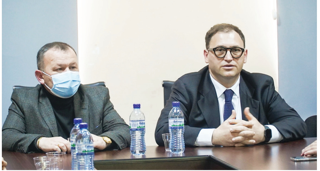
შანდელთან შედარებით, გაორმაგებულია სოფლად მეწარმეობის განვითარების ფარგლებში დასაფინანსებელი პროექტების რაოდენობა, რაც არანაკლებ 24 პროექტის 3 197 640 ლარით დაფინანსებას გულისხმობს. ეს მნიშვნელოვან სარგებელს მოუტანს როგორც თავად მეწარმეებს, ისე მუნიციპალიტეტსა და რეგიონს.