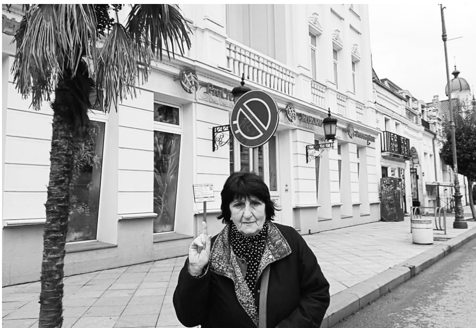
გაზეთი «აჭარის» («აღჭარის») ყოფილ შენობასთან, რომლის დაკარგვა მანსაკუთრებულად გვტკივა

სიხარულით ხედება ახალგაზრდების გამოჩენას ჟურნალისტის სარბიელზე, ყოველმხრივ ეხმარება მათ პროფესიის უკეთ დაუფლებაში, საინტერესო თემატიკის მოძიებაში, უბრალოდ, ადამიანური კეთილგანწყობით აძლევს სტიმულს, არ შეუშინდ-