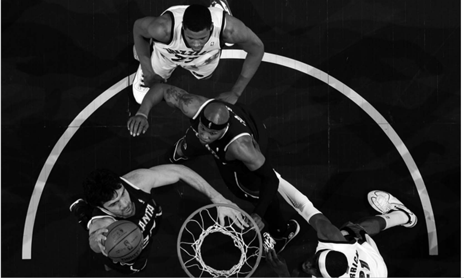
ფაჩულიას სლემ დანკი

ატლანტა ჰოუსქმა NBA-ს რეგულარული სეზონი მემფისში გასვლითი მატჩით დაასრულა. იმის გამო, რომ ამ თამაშს ქორებისთვის არავითარი მნიშვნელობა არ ჰქონია, ჯორჯიელთა მწვრთნელმა ძირითადი შემადგენლობა დაასვეს. მაიკ ბიბი, ალ ჰარფორდი, ჯო ჯონსონი და მარვინ უილიამსი მოედანზე არ გამოჩნდნენ. იმ კალათბურთელებიდან, რომლებიც რეგულარული სეზონის განმავლობაში ჯორჯიულ გუნდში ამინდს ქმნიდნენ, მხოლოდ ჯომ სმიტმა, ზაზა ფაჩულიამ და ფლიპ მურეიმ ითამაშეს. ვუდსონს მაინც-