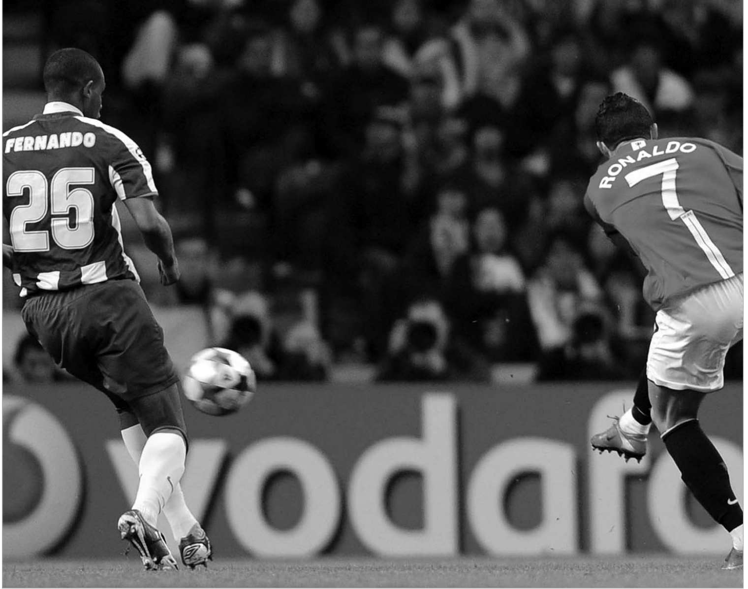
რონალდუს ამ გოლმა "მანჩესტერს" ნახევარფინალის საგზური მოუტანა

გაირკვა იმ ოთხი გუნდის ვინაობა, რომლებიც ჩემპიონთა ლიგის მოგებისთვის გააგრძელებენ ბრძოლას. კვლავ ინგლისური დომინაციის მომსწრენი ვართ - ნახევარფინალებში სამი ინგლისური და ერთი ესპანური გუნდი გავიდა. ბარსელონას პრემიერლიგური დიდი ოთხეულის სამ მოწინააღმდეგე მოუწევს ჭიდილი.