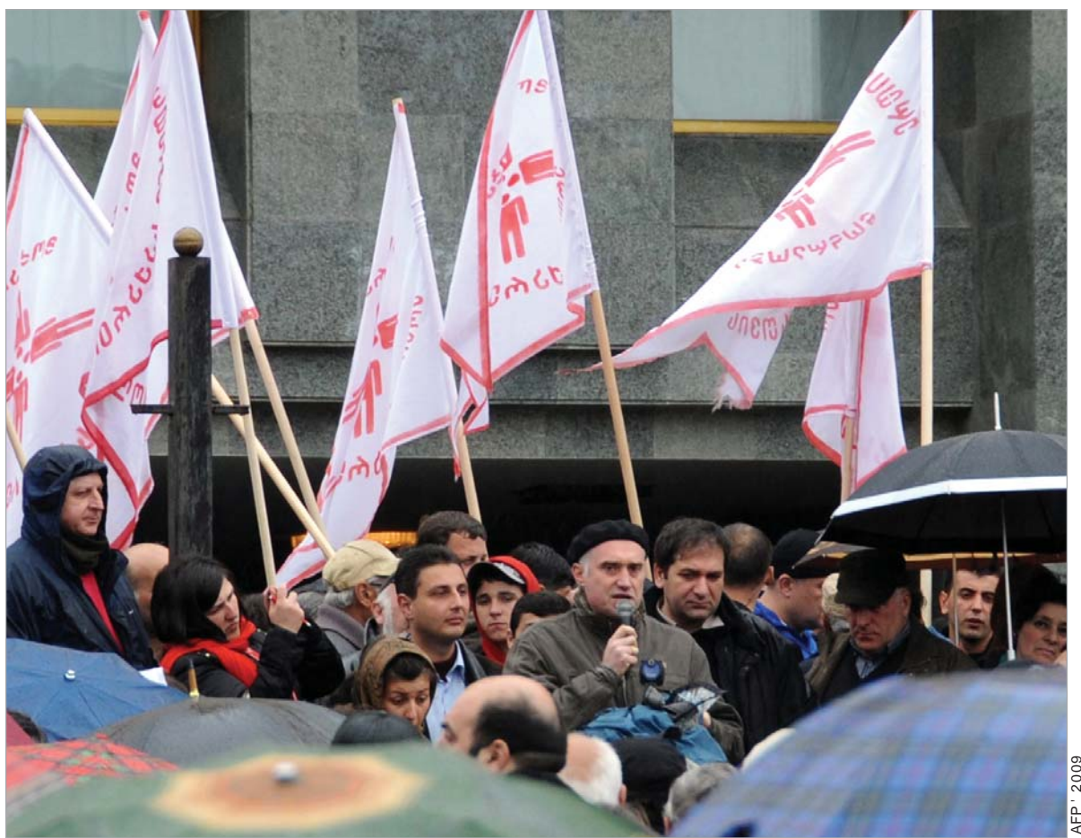
AFP · 2009