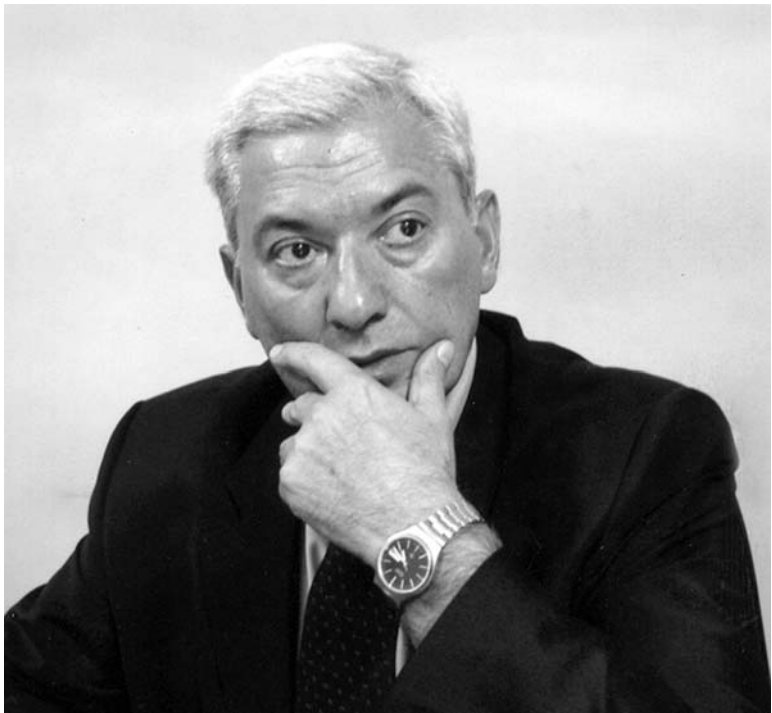
„თითოეული ადამიანი საკუთარი სახეობით უნდა აღას- ტურებადეს საკუთარ წოდებას“