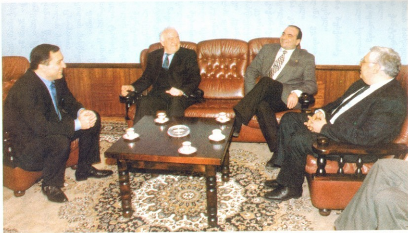
ღაჯილღოვის ტერაპონის შემღებ

1997 წლის 16 აპრილს საქართველოს პრეზიდენტმა ელპარო შვეარდნაძემ ღირსების ორდენი გადასცა საქართველოს სახალხო არტისტს ვაბა ბურჭულაძეს.