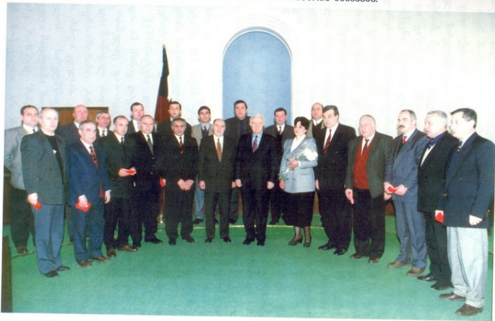
დაჯილდოების ცერემონიის შემდეგ გადაღებული საგახსოვრო ფოტოსურათი.

1997 წლის 7 მარტს საქართველოს პრეზიდენტმა ელვარდ შიშკარდნაძემ სახელმწიფო ორდენები და მედლები გადასცა დაჯილდოებულთ - საქართველოს პროკურატურის მუშაკებს.