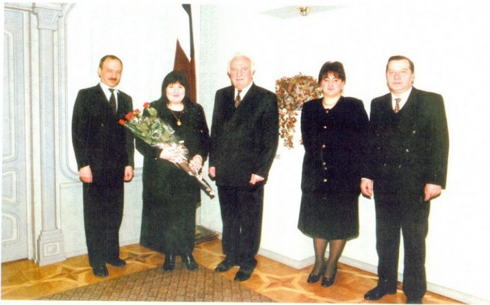
ღაჯილდოების ცერემონიის შემდეგ გადაღებული საგახსივრო ფოტოსურათი.

1997 წლის 22 ნოემბერს საქართველოს პრეზიდენტმა ელვარდ შევარდნაძემ ღირსების ორდენი გადასცა გამორჩენილ ქართველ მომღერალს, მოსკოვის დიდი თეატრის სოლისტს, საქართველოს სახალხო არტისტს მამვალა ქასრაშვილს.