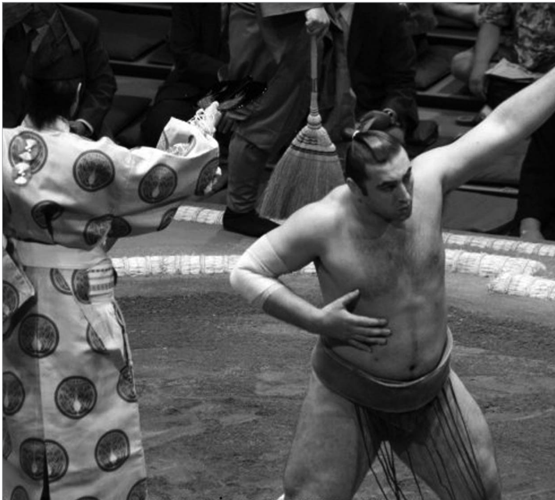
დღეს ტოჩინოშინს დიდი გამოცდა ელის

ზედზედ მერვე გამარჯვება იხიმა იოკოჰუნა ჰაკუჰომი. ასევე ასპროცენტინი შედგით ინონებს თავს დასავლეთის ოქტი ჰარუმუფანიც. იოკოჰუნა ასოშორიუს ერთი მარცხი აქვს და იმის-