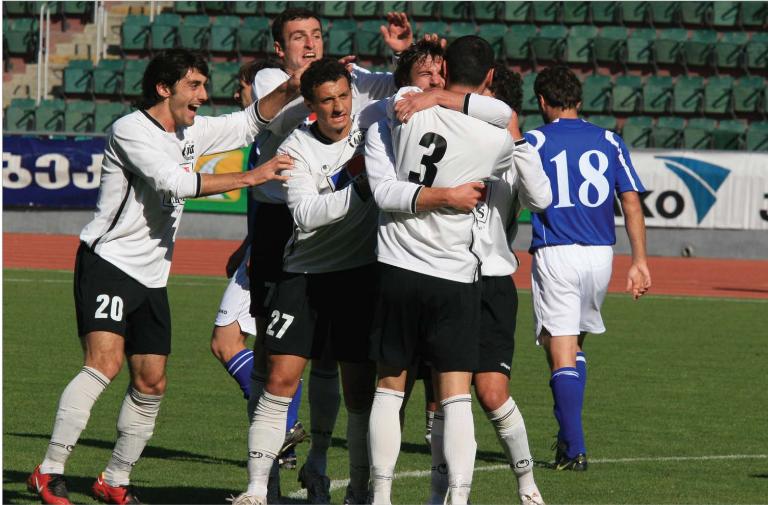
ვიტ ჯორჯია ორგზის ჩემპიონია