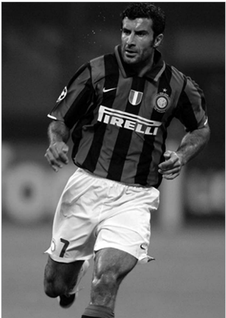
პორტუგალიელმა ლეგენდამ კარიერა დაასრულა

ნერაძურიში პორტუგალიელი გადავიდა 2006 წელს, მას შემდეგ, რაც მასზე უარი თქვა მადრიდის რეალმა. ფიგუ ჯერ გადასვლას აპირებდა ახლო აღმოსავლეთში, კლუბ ჰალიფაში, სადაც სეზონში მილიონ დოლარზე მეტი უნდა გადაეხადათ. ამ