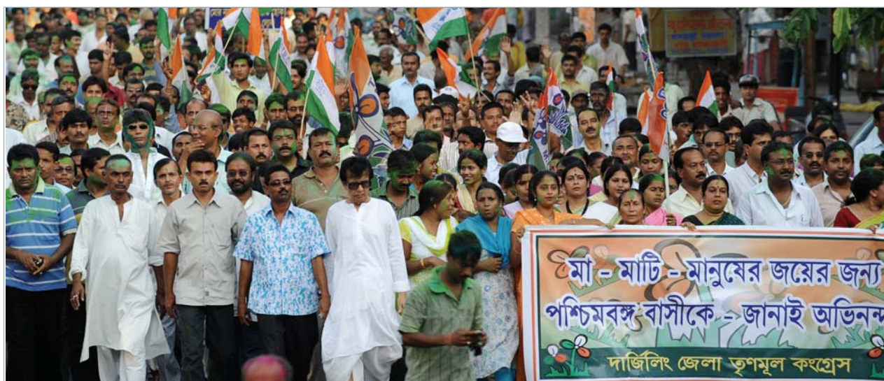
მმართველი პარტია გამარჯვებას ზეიმობს.

შაბათს ინდოეთში არჩევნები ჩატარდა, უფრო სწორად, დასრულდა 16 აპრილს დაწყებული 5-ეტაპიანი საპარლამენტო არჩევნები, რომელშიც დამაჯერებელი გამარჯვება მოიპოვა მმართველმა „გაერთიანებულმა პროგრესულმა ალიანსმა“, რომლის მთავარი ძალა ტრადიციული „ინდოეთის ეროვნული კონგრესი“ - მემარცხენე-ცენტრისტული საერო პარტია. პირველ ადგილზე გასულმა ალიანსმა 543-კაციან პარლამენტში 260 მანდატი მოიპოვა. მეორე ადგილზე გასულმა მათმა ძირითადმა კონკურენტმა ეროვნულ-დემოკრატიულმა ალიანსმა, რომლის ლიდერია პარტია „ბხარატია ჯანატა“, 157 მანდატი აიღო და უკვე აღიარა თავისი დამარცხება. მესამე ადგილზე პარტია „მესამე ფრონტი“ - 60 მანდატი. დანარჩენი ადგილები უფრო წვრილმა, ძირითადად, რეგიონული მნიშვნელობის პარტიებმა მოიპოვეს. არჩევნების წინასწარი შედეგები შაბათსალამოსვე გახდა ცნობილი, რადგან „მსოფლიოში ყველაზე დიდ დემოკრატიულ ქვეყანაში“ (ასე უწოდებენ ხშირად ინდოეთს, რომელშიც 714 მილიონი ამომრჩეველია) წელს გამოიყენეს ხმის მიცემისა და შედეგების