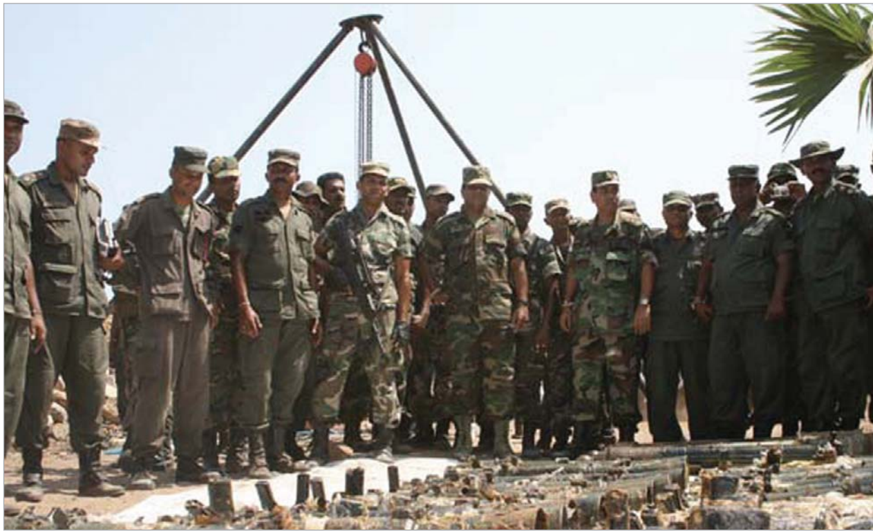
არმია ჯერ კიდევ განაგრძობს „თამილის ვეფხვების“ წინააღმდეგობის კერებთან ბრძოლას.

მემამბოხეთა მიერ მითვისებული მთელი ტერიტორიის საბოლოოდ გათავისუფლების ერთადერთ ბარიერად მშვიდობიანი მოსახლე-