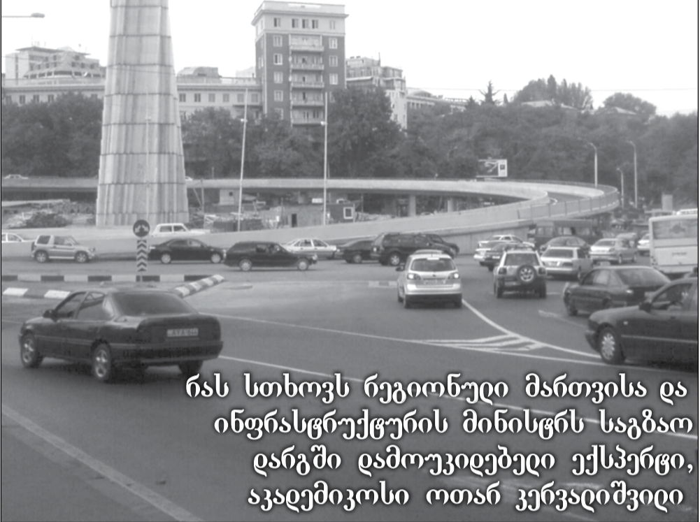
რას სთხოვს რეგიონული მართვის და ინფრასტრუქტურის მინისტრს საგზაო დარღვივებების მინისტრს ექსპერტი, აკადემიკოსი ოთარ კერვალიშვილი