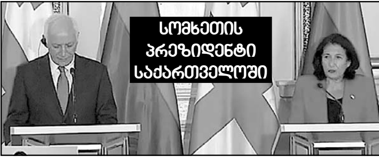
სომხეთის პრეზიდენტი საპარტეზლოში