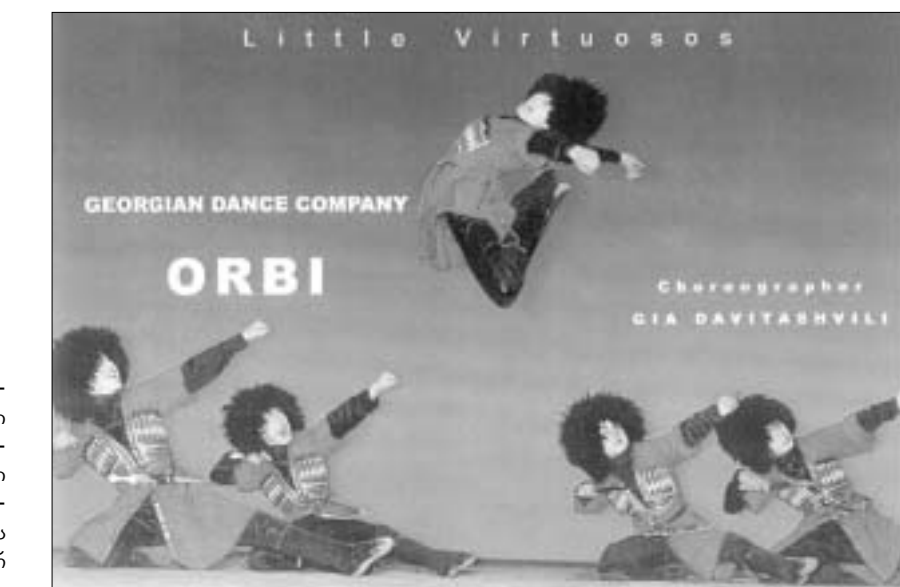
ამ პლაკატით უნებდნენ რეკლამას 'ორბის' ამერიკაში

ეს არის თანამედროვე ფოტოგრაფიისა და ვიდეოს საშუალებით წარმოდგენილი სახვითი ხელოვნების უძველესი ფანრის - პეიზაჟის, ლანდშაფტის ახლებური ხედვა და მისი დატვირთვა სოციალური, გეოპოლიტიკური ანდა ისევე და ისევე, ეს-თეტიური თვალსაზრისით.