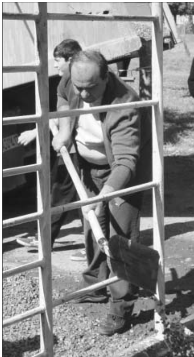
ფანია და პატარები ქვეყნის დალაგებას გლდანიდან იწყებენ

“ხომ იცით, ბავშვებო, ვინც მუშაობს, ის ჭამს”