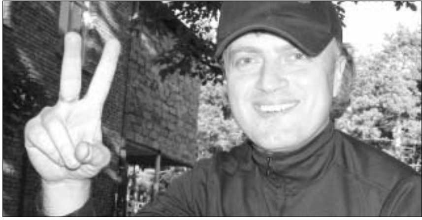
„არ გავცვლი სალს კლდეებსა უკვდავებისა ხეზედა, არ გავცდი მე ჩემს სამშობლოს სხვა ქვეყნის სამოთხეზედა“

საქართველო 10 წლის შემდეგ აცნობიერებს, რომ ემიგრაციაში წასული მილიონი ახალგაზრდა, რომელია უმრავლესობაც აღარასდროს დაბრუნდება უკან, თავისი ცოდნით, ენერჯით, ინტელექტით და იმ უამრავი პრობლემის გადაჭრის უნარით, რომლის გასაღებებიც მათ თან წაუღიათ ევლურ დასავლეთში, თურმე ასე საჭირო ყოფილა ისეთი პატარა ქვეყნისთვის, როგორც ჩვენი სამშობლო.