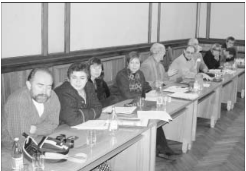
რუსი ჟურნალისტები კონფერენციაზე

ჩვენი გაზეთი უკვე წერდა იმის შესახებ, რომ ლიკანში რუსი და ქართველი ჟურნალისტების კონფერენცია მიმდინარეობს სახელწოდებით - "რუსეთი და საქართველო - დიალოგი კავკასიის ქედთან." ორგანიზატორების მისამართით უნდა ითქვას, რომ რუსეთიდან ჟურნალისტების ძალზე წარმომადგენლობითი შემადგენლობა ჩამოვიდა. ახლა ბევრს საუბრობენ რამდენიმე რუსეთის არსებობაზე. კონფერენციის მონაწილეთა საუბრებიდან შეიძლება ერთი კარგი დასკვნა გამოვიტანოთ: არსებობს მხოლოდ ერთი რუსეთი, მაგრამ მას შვავს ბოლომდე არარეფორმირებული საბჭოთა ხელისუფლება, რომელიც საქართველოს ასევე ბოლომდე არარეფორმირებულ საბჭოთა ხელისუფლებას ემრძები.