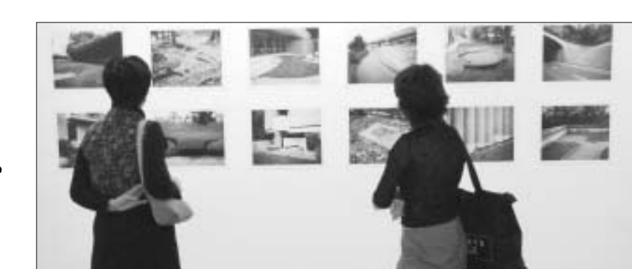
ქართველი ლანდშაფტები საქართველოში

დირექტორია. სწორედ ამ ცნებების - „ტერიტორიისა“ და „პეიზაჟის“ შეხების წარმოჩენას ყოველდღიური ბასთან ცდილობენ ქართველი და შვეიცარული ავტორები. თითქმის, რომ საქართველოსათვის „ტერიტორია“ უფრო მწვავე გეოპო-