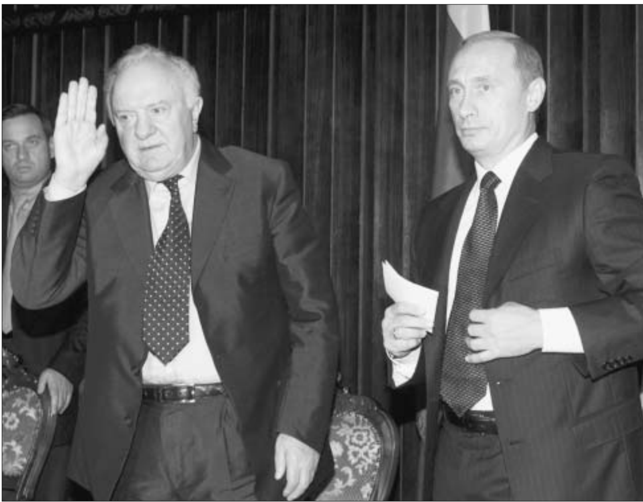
შეხვედრის მთავარი შედეგი - რუსეთის დეზურთულთა ნაკრები თბილისში ითამაშებს.