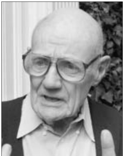
ჯონ ფენი - ჩინა