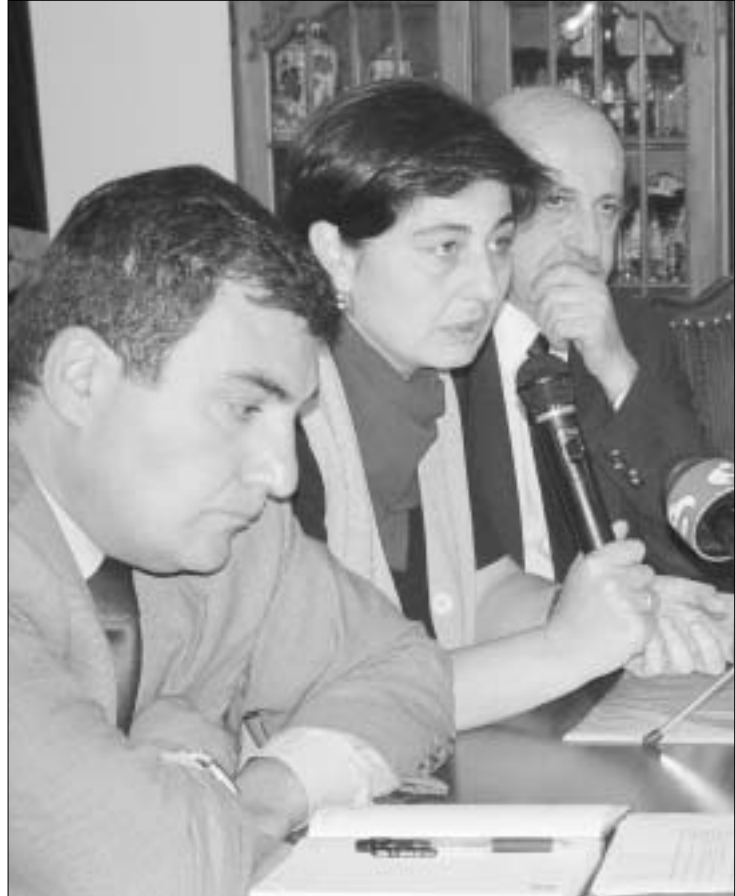
ფარმაცევტებს ბევრი გასარკვევი ჰქონიათ

რესოდ გაიფურა მედიკოსთა და პაციენტთა ღირსების დაცვის ასოციაციის პრეზიდენტის, სულხან ქემოკილის განცხადებამ, ბაზრობებზე ისეთი წამლები იყიდება, ქილელებმა რომ იცოდნენ, იარაღს ხელსაც არ ახლებდნენ, ერთი ინეციაა საჭირო და ადამიანი ცოცხალი აღარ იქნებაო. შრომის, ჯანმრთელობისა და სოციალური დაცვის სამინისტროს წარმომადგენელთა რეაქციით თუ ვიმჯავდებით, ამანი მათთვის ახალი არაფერი იყო. სამაგვიროდ, სიახლე გამოჩნდა ის, რომ ადამიანებს ეჭვი აღმო, საქართველოში მწარმოებულ ქვეყანაშიც კი დაურეგისტრირებ-