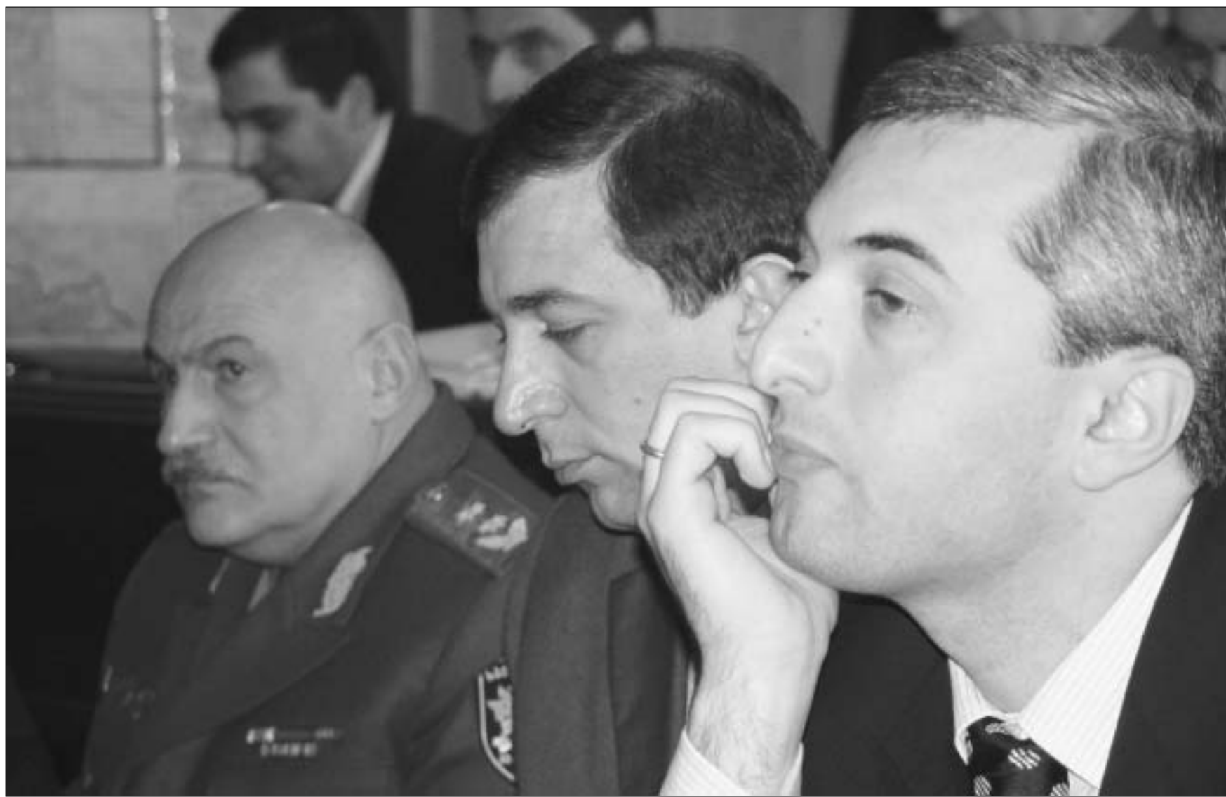
მათი უსახსრობა სახელმწიფოს უფრო ძვირი დაუბადებს