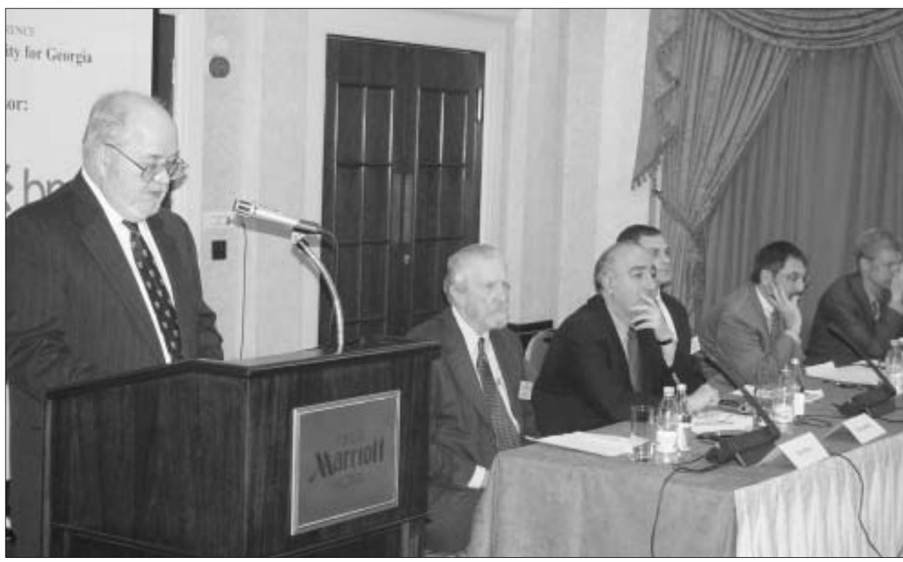
კონფერენციის განხილვისას სასტუმრო “მარიოტში”

საქართველო, დღემდე უცნობ ტერორიზმის საფრთხეს, ქვეყნის თავდაცვითი სისტემის მიზერული დაფინანსებითა და ერთიანი სახელმწიფოებრივი მიდგომის გარეშე ხვდება. იმის მიუხედავად, რომ საქართველოს უმაღლესი ხელისუფლება და ძალიან უწყებების პირველი პირები პანკისში მიმდინარე ანტიტერორისტულ და ანტიკრიმინალურ ოპერაციას წარმატებულს უწოდებენ, მაინც არსებობს რეალური საშიშროება, რომ, ოპერაციის დასრულების შემდეგ, ტერორიზმის პრობლემა კვლავ აქტუალური დარჩება და “პანკისის სინდრომი” ნებისმიერ წუთს შეგვახსენებს თავს.