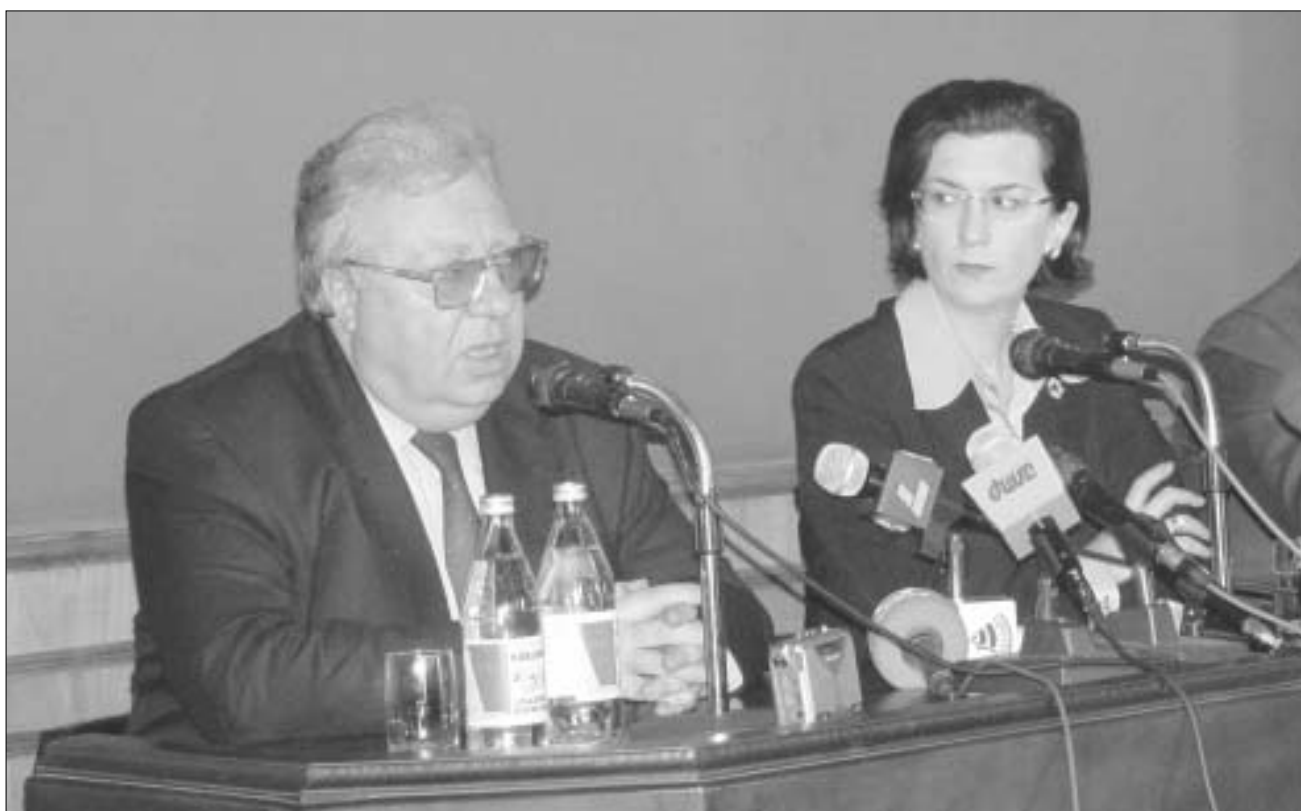
არმენ ხაჩატრიანი და ნინო ბურჯანაძე

თბილისში ოფიციალური ვიზიტით მყოფი, სომხეთის პარლამენტის ეროვნული ორგების თავმჯდომარის, არმენ ხაჩატრიანის მიერ საქართველოს პარლამენტში გამართული პრეს კონფერენციაზე გაულერებულმა მკვეთრმა გამოხატვაიმემა საკმაოდ უსიამოვნო გრძნობა დატოვა.