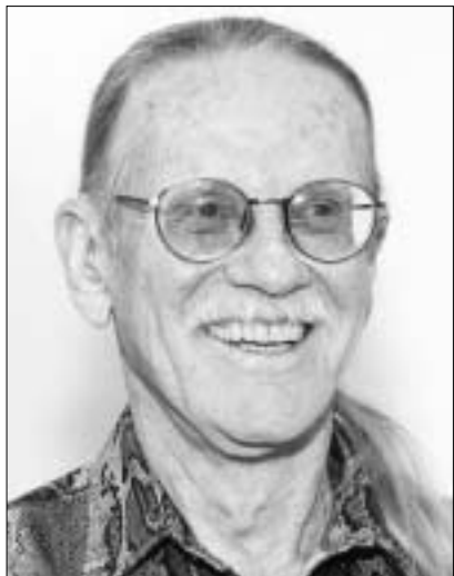
ვერნონი სმიტი - ეკონომიკა