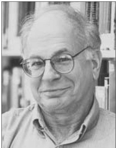
დენიელ კანემანი - ეკონომიკა