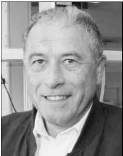
კურტ ვიჩირინი - ჩინა

2002 წლის ნობელის პრემია ლიტერატურაში ("ლიტერატურული ნაწარმოებისათვის, რომელიც ცალკეული პიროვნების ისტორიის ბარბაროსულ სვლასთან დაპირისპირების ამბავს გადმოგვცემს") გუშინ, შვედეთის სამეფო აკადემიამ უნგრელ მწერალს, იმერ კერტევს გადასცა. ხანგრძლივი ვნებათაღელვის ასეთ შედეგს ლიტერატურულ წრეებში არავინ მოელოდა. მართალია, კულურულ წრეებში მას ერთ-ერთ კანდიდატად ყოველთვის ასახელებდნენ, მაგრამ მხოლოდ ერთ-ერთ და, თანაც, მეორეხარისხოვან კანდიდატად.