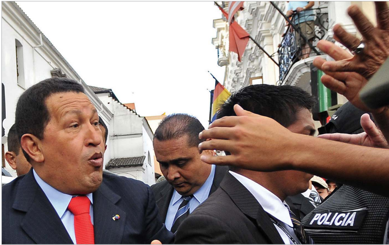
AFP - 2009

ჩავესის თქმით, გადაცემა "ხუთშაბათს დაიწყება, ჯერ არ