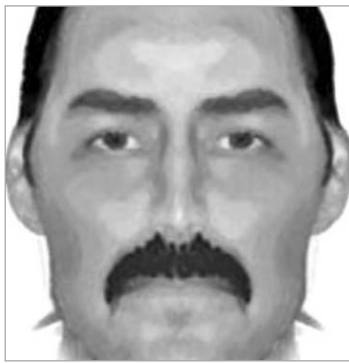
ჯეკ მფატრავის ფოტორობოტი.

დეტექტივი აქციენტს აკეთებდა იმ ორ საზარელ მკვლელთაზე, რომლებიც თითქმის ერთდროულად, 10 წუთის შუალედში მოხდა. დეტექტივის ვერსიით, დამნაშავე, რომელიც პირველი მკვლელობა ჩაინიშნა, შეეცდებოდა კვალი დაეფარა, რასაც, დრო დაჭირდებოდა 17 წლის ახალგაზრდამ თანატოლ გოგონას მიმართა. გაბრაზებული გოგონა კი მას ამ მიმართვისთვის დაემუქრა, მეგობარ ოთხ ბიჭს შეუთანხმდა და შეურაცხყოფელი მათ სასტიკად აცემინა. მკვლელობაში ეჭვმიტანილებიდან ერთ-ერთი ახალგაზრდა პოლიციამ თავად გამოცხადდა აღიარებითი ჩვენებით. დანარჩენები კი მიიმალნენ.