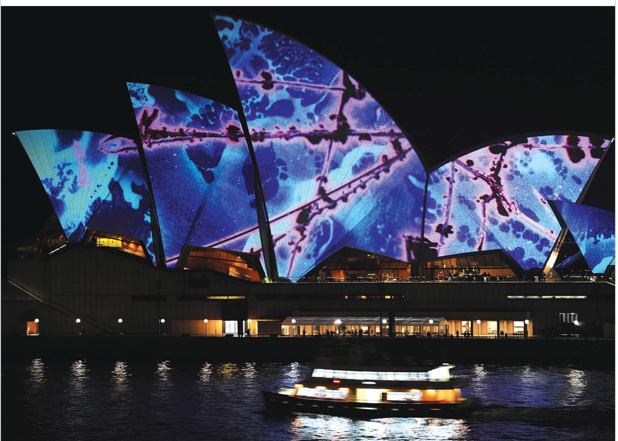
უნიკალური არქიტექტურის მქონე სიდნეის ოპერის შენობა ამ დღეებში კიდევ უფრო დამშვენდა. ლეგენდარულმა მუსიკოსმა ბრაიან ინომ აქ არა მხოლოდ თავისი მუსიკა, არამედ ილუმინაციის ხელოვნებაც წარმოადგინა. ამ სანახაობით სიდნეის ხელოვნების ფესტივალი Vivid Sydney გაიხსნა, რომელშიც პრაქტიკულად ყველა სფეროს ხელოვნები მონაწილეობენ და მსოფლიოს ერთ-ერთ ყველაზე მასშტაბურ ღონისძიებად მიიჩნევა.