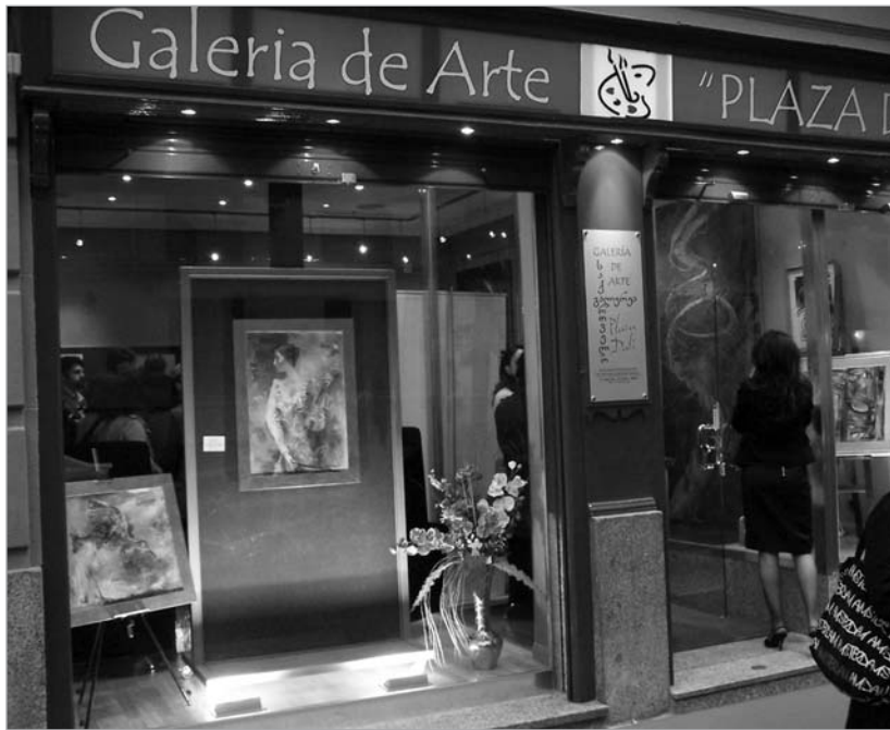
გალერეა "საქართველო" მადრიდში

- ვფიქრობ, რომ ამ თვალსაზრისით საერთაშორისო კონტაქტების