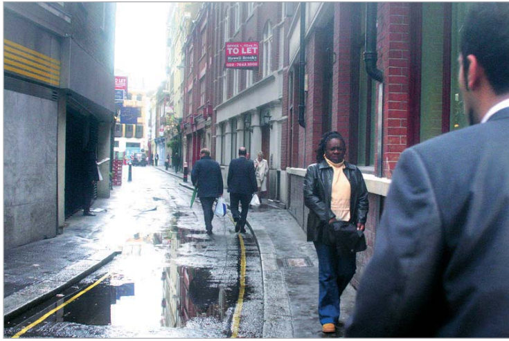
კვარტალი. სადაც მკვლელობები ხდებოდა.

"ამით ჟურნალისტს სურდა გაემყარებინა საკუთარი ვერსია სერიული მკვლელის ჯეკ მფატრავის არსებობის შესახებ," - აცხადებს ენდრიუ კუკი. მისივე მტკიცებით, ჯეკ მფატრავის სისხლიანი დანაშაულების თაობაზე პრესაში ატეხილი აჟიოტაჟი ჟურნალ-გაზეთებს მაშინ დიდ მოგებას აძლევდა, რადგან სერიული მანი-