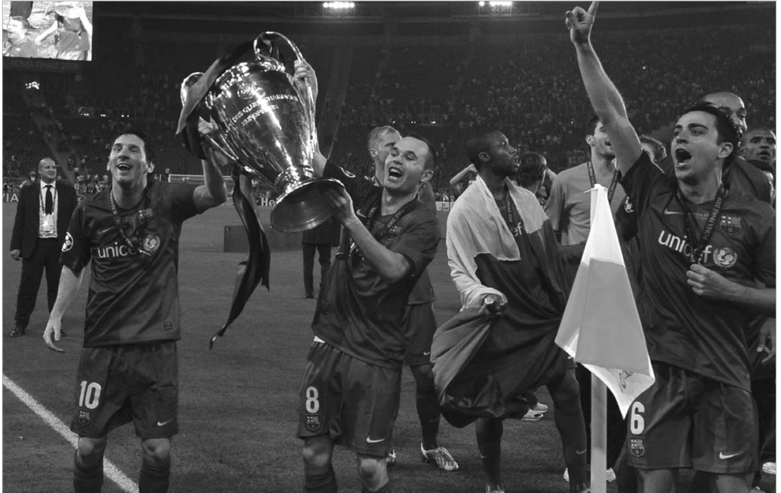
"ბარსელონა" ევროპის საკლუბო ჩემპიონია

სამი ტიტული რვა თვეში - ასეთია პეპ გვარდიოლას სადებიუტო სეზონის შედეგი, რომლის გამეორება პრაქტიკულად შეუძლებელი იქნება. ალბათ სწორედ ამიტომ იხუმრა კატალონიელთა მწვრთნელმა ფინალური მატჩის შემდეგ გამართულ პრესკონფერენციაზე: ხვალვე გადავდგები. აბა, ამაზე მეტი რაღა უნდა ვქნაო. თუმცა პეპს ჯერ ყველაფერი წინ აქვს. ვინ იცის, ის, რაც წლეულს სერ ალექსმა ვერ მოახერხა, იქნებ მომავალ სეზონში გვარდიოლამ გააკეთოს და ბარსასთან ერთად ჩემპიონთა ლიგის გამარჯვებულის ტიტული შეინარჩუნოს.