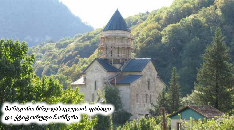
ბარაკონი: ჩრდ-დასავლეთის ფასადი და ქტიტორული წარწერა