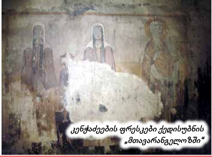
კენჭაძეების ფრესკები ქედისუბნის „მთავარანგელოზში“

საყდრის ეზოში კი შევიდვართ დაუბრკოლებლად, მაგრამ მერე და მერე საქმე გვირთულდება, ნაგაზების გაავებული ყეფისა და წინააღმდეგობის გამო ტაძრის დასავლეთის კარს ვერ ვუახოვდებით, რომ შიგ შევიდეთ, არც არავინ გვეხმიალება. ეზოში დიდი სიფრთხილით დავდივართ, მაგრამ XI ს-ის ნაეკლესიარის საძირკველის წარჩენებისაკენ გზას ვერანაირად ვერ ვიკვლევთ. ადრე ვთქვი, რომ ის ეკლესია აუცილებლად რაჭი ბაღვაშის ან მისი ძის კახაბერ რაჭის ერისთავის აგებული იქნებოდა, იმ კახაბერისა, რომელიც ბერად აღკვეცილა. ამ ამბავს ნიკორწმინდის ჯვარცმის ხატის წარწერა გვეუბნება: „მე კახაბერყოფილმან კირილე ძემან სულკურთხეულისა ერისთავთ-ერისთავისა რაჭისამან მოვჭედე ხატი ესე...“ რამ დაშთო ის ძველი ეკლესია უცნობია. რაჭის ერისთავთა პირველი დინასტიის მიერ აგებული და იავარქმნილი ტაძრის ნაცვლად ბოლო დინასტიის ერთ-ერთმა ბოლო ერისთავმა როსტომ ჩხეტიძემ ახალი, ჯვარგუმბათოვანი