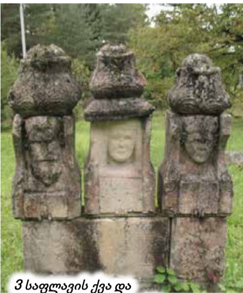
3 საფლავის ქვა და ახალი ტაძარი ნკადისში

რაკი ქვემო რაჭაში ვმოგზაურობთ და წინა წარკვეცი „კვირიკეწმინდის“ აღწერით დავასრულებთ, უმჯობესია ამ ადგილებს დიდად არ დავცილდეთ და ამბროლაურის სამხრეთ სიახლოვეში მდებარე სოფლები მოვიხაზოთ. თუმცა, სიტყვა „სიახლოვე“ მანძილს სწორედ ვერ ასახავს. რაჭის ფიზიკურ-გეოგრაფიული რუკა დიდი სატყუარაა. ორი სოფელი, რუკაზე რომ გვერდი-გვერდაა, სინამდვილეში მინიმუმ სამჯერ შორსაა. დასახლებებს ერთმანეთისგან ღრმა ხეხვი გამოყოფს. ამასთან ერთი სახლი რომ მთის ძირშია, ბოლო სახლი, შეიძლება, ამ მთის ზურგზე ან კორტოხზე იდგეს. მათალია, რაჭის მთის სასოფლო გზები საქართველოში, ალბათ, ყველაზე უკეთესიც კია და