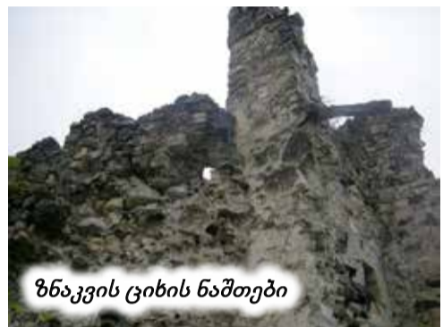
ზნაკვის ციხის ნაშთები

ქვევრებში პირადად გაცნო ლენინს, უმაღლესი განათლება მიიღო და საბჭოთა პერიოდში კურორტ შოვის მშენებლობის მოთავე და ხელმძღვანელი იყო. სწორედ მის ეზოკარში დგას უნიკალური ათასწლიანი ცაქცი, რომლის უზარმაზარი ვარჯები თითქმის მთელ ეზოს ჩრდილავს. ნამდვილად „ნიუთლი ნიგნის“ ბუნების ძეგლია.