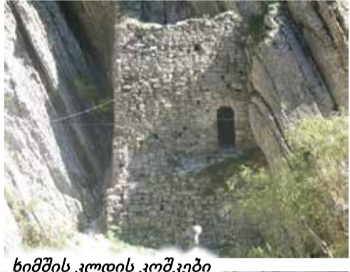
ხიმშის კლდის კოშკები