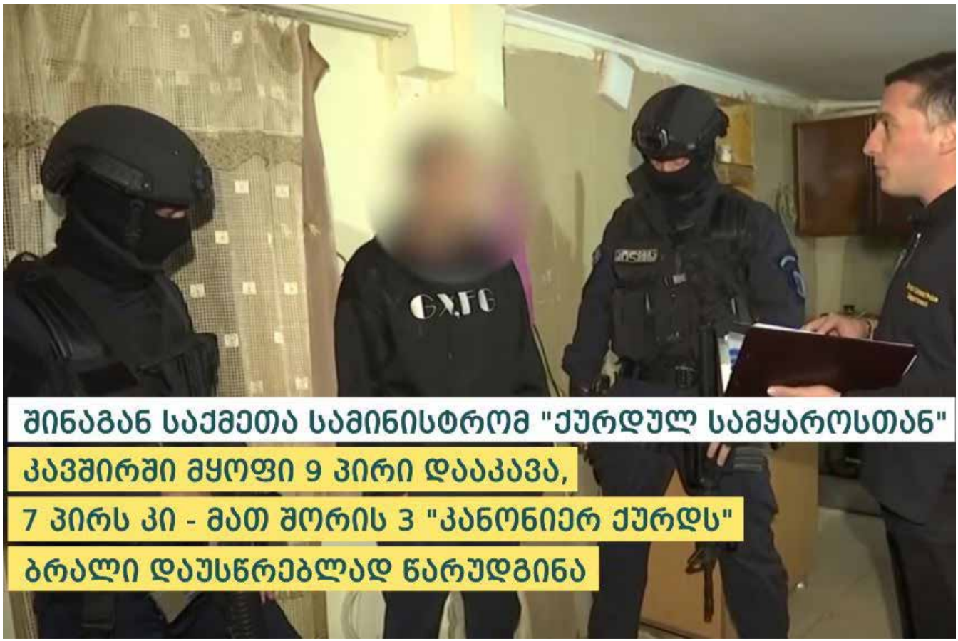
შინაგან საქმეთა სამინისტრომ "ქურდულ სამყაროსთან" კავშირში მყოფი 9 პირი დააკავა, 7 პირს კი - მათ შორის 3 "კანონიერ ქურდს" ბრალი დაუსწრებლად წარუდგინა

ცეცხლსასროლი იარაღისა და საბრძოლო მასალის მართლსაწინააღმდეგო შექმნა-შენახვის და ტარების ფაქტებზე გამოძიება საქართველოს სისხლის სამართლის კოდექსის 236-ე მუხლის მე-3 და მე-4 ნაწილებით მიმდინარეობს.