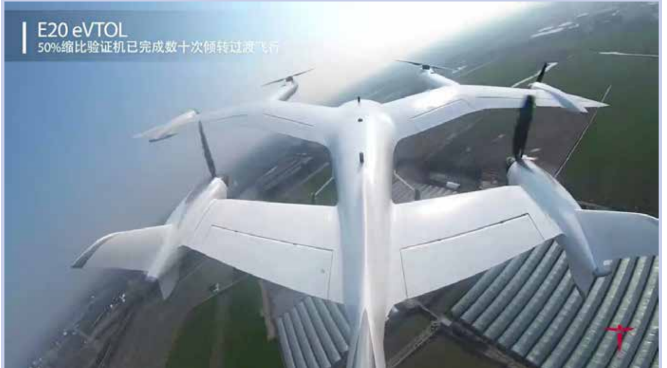
E20 eVTOL 50%缩比验证机已完成数十次倾转过渡飞行

შანხაში მდებარე კომპანია TCab Tech, საჰაერო ტაქსის საცდელ ფრენებს ატარებს. სადემონსტრაციო მოდელი E20, რომელიც 50%-იანი მასშტაბისაა, მუშაობს ვერტიკალური აფრენისა და დაკიდების რეჟიმში, ასევე, ფრენის რეჟიმში გადასვლასაც ახორციელებს. მფრინავი ტაქსის ფრთების სიგრძე 6 მეტრს აღწევს. საფრენი ცდებისას, კომპანიის ინჟინრები მონაცემებს აგროვებენ აპარატის კონსტრუქციისა და კონფიგურაციის შესამოწმებლად. ტაქსის 50%-იანი მასშტაბის პროტოტიპი, დღეისთვის, ყველაზე დიდია ქვეყანაში.