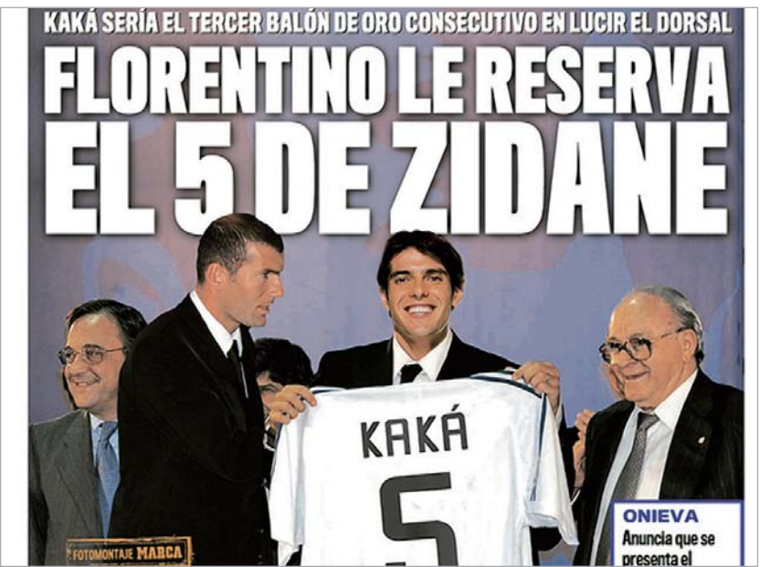
კაკა "რეალის" ფეხბურთელია

კლუბებს შორის მიღწეული შეთანხმების საფუძველზე "მილანი" კაკას სანაცვლოდ 65 მილიონ ევროს მიიღებს, თავად კაკა "რეალთან" ხუთწლიან კონტრაქტს გაა-