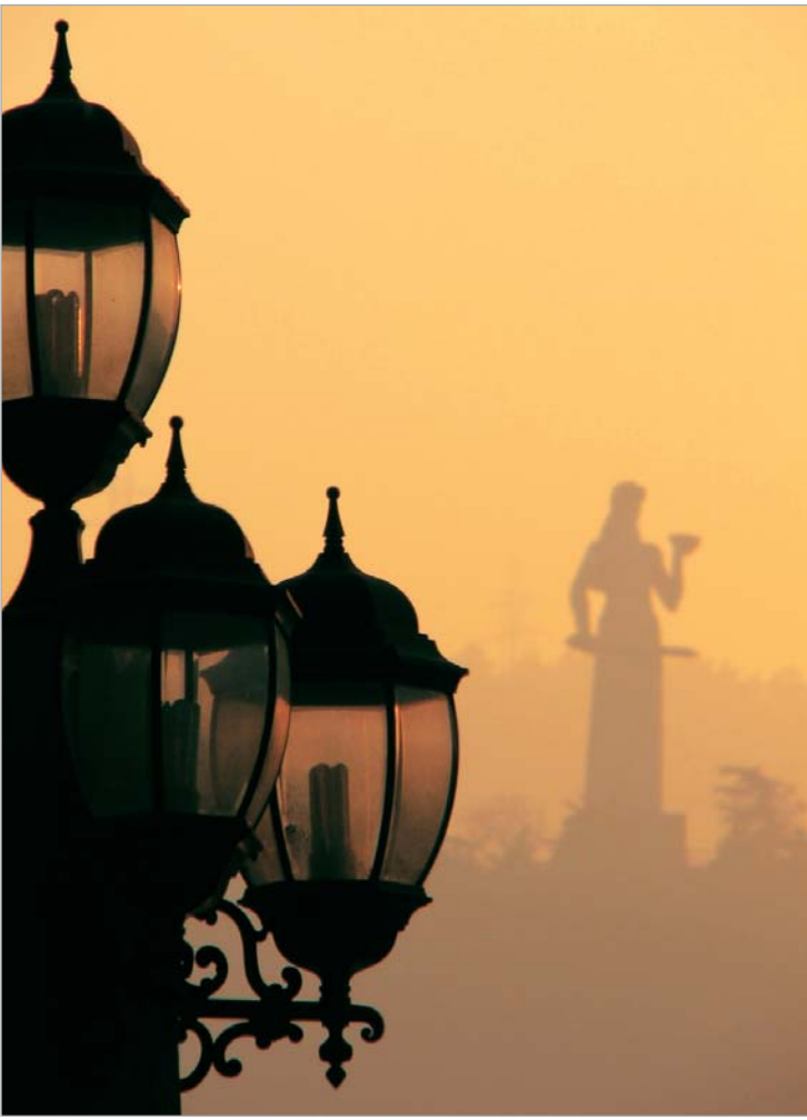
Photo Challenge-ის პარტნიორია კინოთეატრი "ამირანი", სადაც 5 ივნისს, 13:00 საათზე, საუკეთესო ფოტოს ავტორი გამოავლინეს. გამარჯვებულად მიხილ მახარაძე დასახელდა, რომელსაც სასაჩუქ-

თითქმის სულ ფორტისიმოზეა დაწერილი. აქ მუსიკოსები ზუსტად იაზრებენ ყოველი პასაჟის შინაარსსა და ხასიათს. გიორგი გვანცელაძის, თემურ ბუნიკაშვილისა და ლევან ცხადაძის ინსტრუმენტულ "დილოგს" - ხან ბუნდოვანებას, ხანაც კონტრასტს თავისი ესთეტიკა შეაქვს სიმებიანი კვარტეტის პარტიტურებში. გერმანიიდან გიორგი გვანცელაძე, ჰოლანდიიდან კი ლევან ცხადაძე, რომლებიც ფრანსუა ლოლოს კონცერტების ლაურეატები არიან, ინგოლშტატის ქართული კამერული და ასევე ევროპის დიდი ფილარმონიული ორკესტრების მიწვეულ შემსრულებლებად ითვლებიან. სცენაზე თავისი ხიბლი აქვს მიუნხენის ახალგაზრდული ფილარმონიული ორკესტრის სოლო ფაგოტისტი მისრულეპას. თემურ ბუნიკაშვილის სასულე ობერტონები ჯოაკინო როსინის ფრანგული ლამაზი ტემბრი იშლება, ფართოვდება და ფინალისკენ თითქოს გამჭირვალედ იფანტება. როსინის გარდა შეასრულეს კვარტეტი B dur, ვებერის კვინტეტი თხზ 34 და კრუსელის დივერსიმენტი C dur.