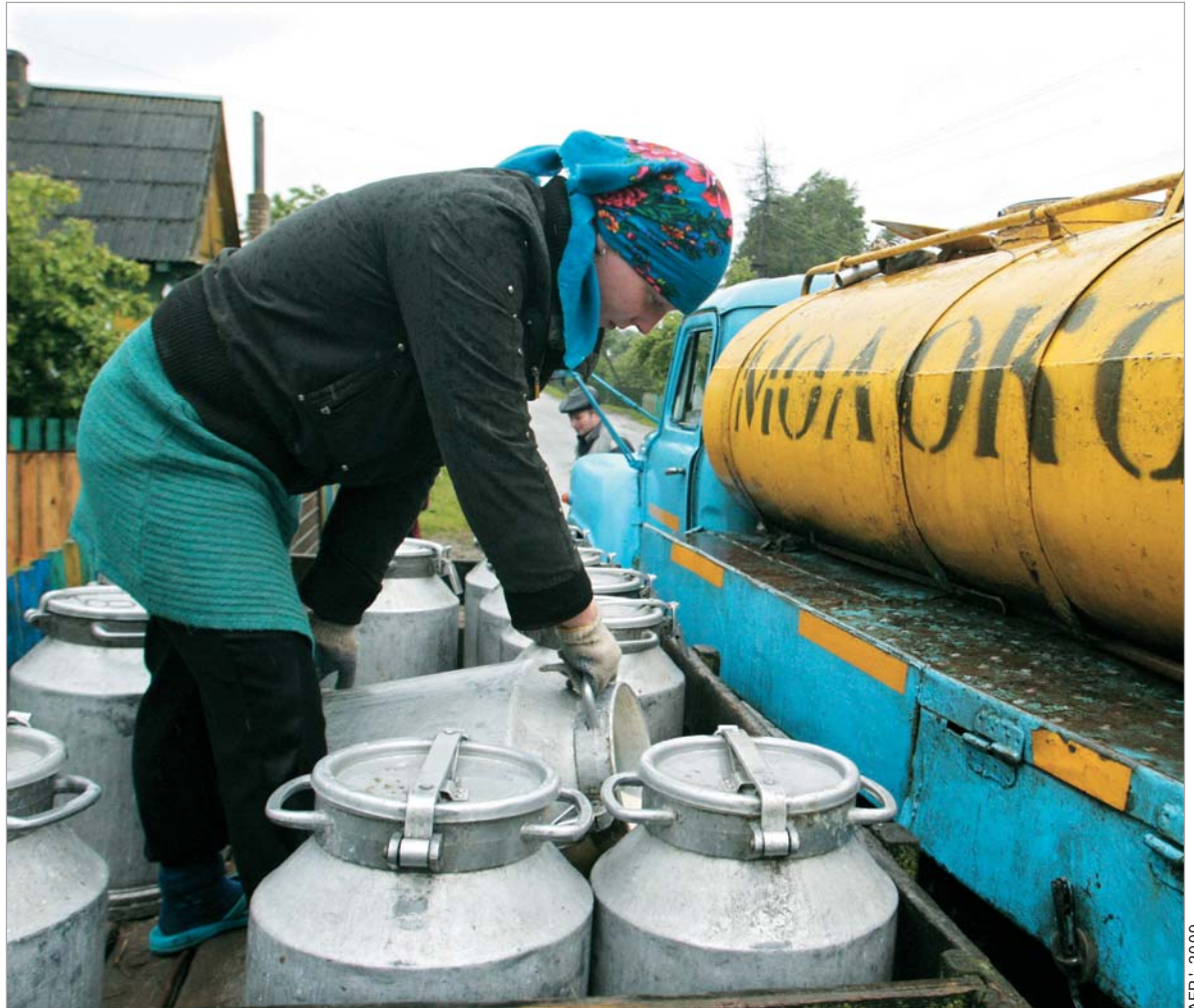
რძის პროდუქტის ექსპორტიდან ბელარუსის ბიუჯეტში ყოველწლიურად ერთი მილიარდი დოლარი შედიოდა.