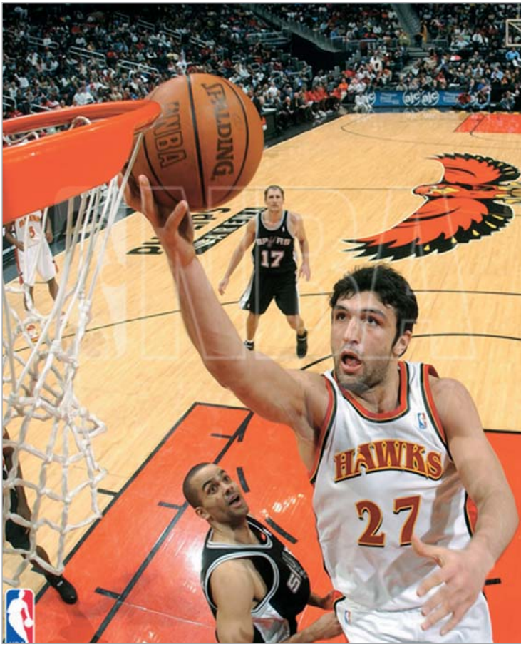
სად ითამაშებს ფაჩულია. ამ ზაფხულს გადანიშნება

- ზეპირად ლაპარაკი ძნელია. კონტრაქტი წინ უნდა გედოს და მაშინ შეიძლება საუბარი. მნიშვნელოვანია ყველაფე-