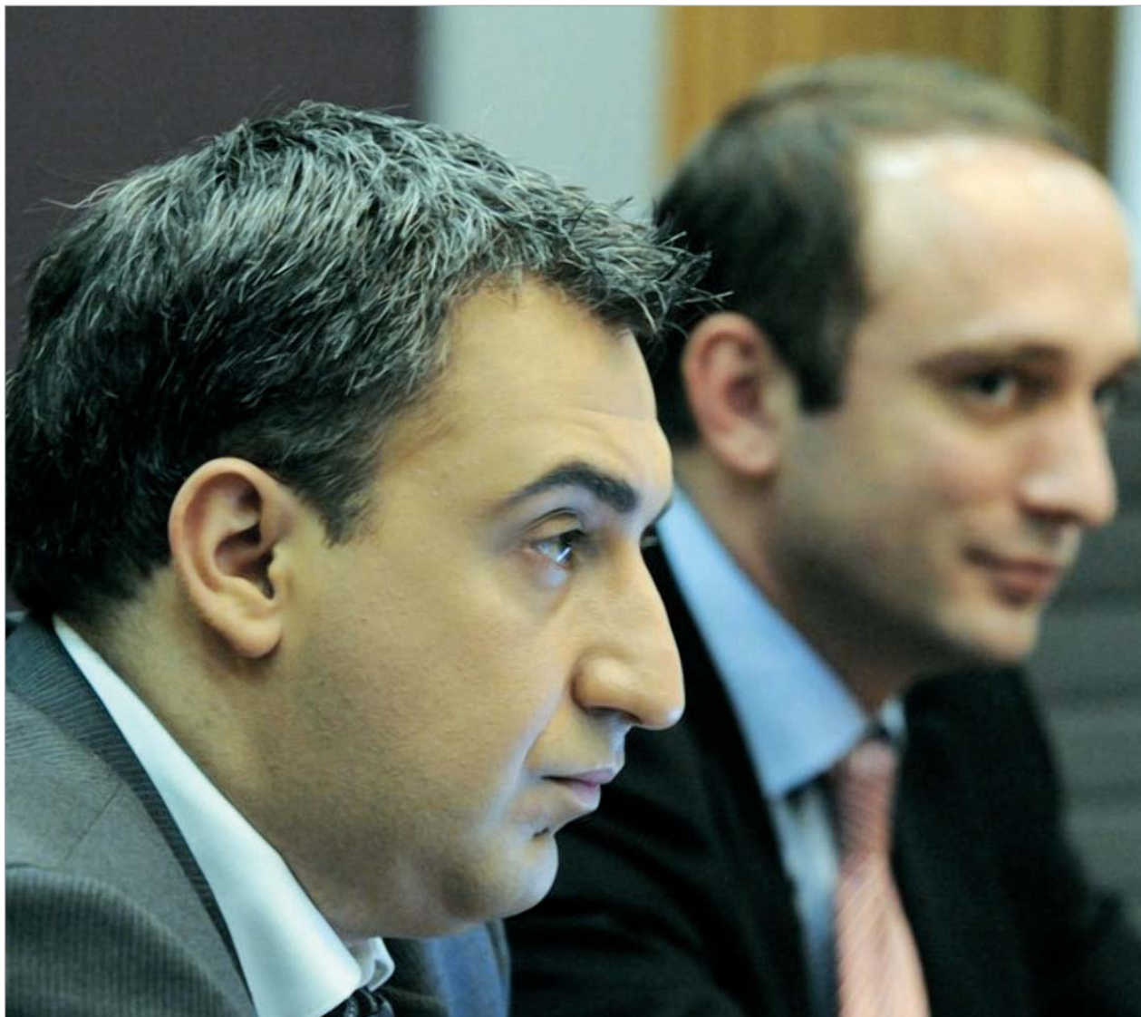
ქაშერის შემოჭერის შესახებ განცხადება საქართველოს პრემიერმა ნიკა გილაურმა ჯერ კიდევ გაპრემიერების პირველ დღეებში გააკეთა

სხვათა შორის, ახალი საბიუჯეტო ცვლილებებით საქართველოს ხელისუფლება აღიარებს, რომ ბიუჯეტის საგადასახადო შემოსავლების მხრივ ქვეყანაში პრობლემები არსებობს - ამის აღიარება სწორედ ის ფაქტი, რომ 2009 წლის ბიუჯეტში ცვლილებები განხორციელდება - ბიუჯეტის შემოსავლების მთლიანად დაგეგმილი 5 510 161 ათასი ლარის ნაცვლად, ცვლილების შესაბამისად 5 137 516 ათასი ლარით განისაზღვრება, მათ შორის გადასახადები - 4 მლრდ 760 მლნ ლარის ნაცვლად, 4 მლრდ 260 მლნ ლარით. საგადასახადო შემოსავლების შემცირებაში ყველაზე დიდი წილი დამატებითი ღირებულების გადასახადზე (314 მლნ ლარი) და მოგების გადასახადზე (83 მლნ ლარი) მოდის.