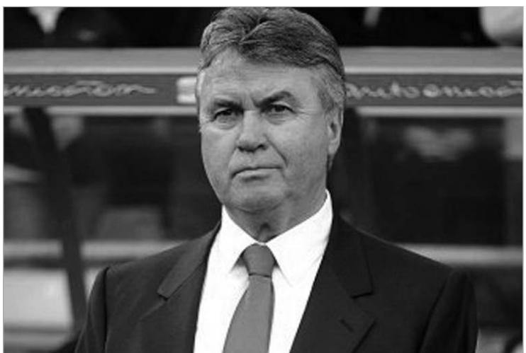
ჰიდინკმა ფერგიუსონისთვისაც მოიკლა

რუსეთის ნაკრების მთავარმა მწვრთნელმა გუუს ჰიდინკმა, რომელიც ამავე დროს ჩეხოსლოვაკიის ნახევარმცველ იუნაიტედის მთავარი მწვრთნელი სერ ალექს ფერგიუსონი გააკრიტიკა. ჰიდინკმა ჩემპიონთა ლიგის ფინალურ მატჩზე ისაუბრა, თქვა, რომ თამაში მოსაწყენი იყო და ეს, პირველ რიგში, მანჩესტერის დამსახურებაა. ჩემპიონთა ლიგის ფინალის ცქერამ არავითარი სიამოვნება არ მომანიჭა. ეს იყო მოსაწყენი სანახაობა. რომის ოლიმპიურ სტადიონზე ფეხბურთის ერთი გუნდი თამაშობდა და ეს იყო ბარსა. ბრძოლა საერთოდ არ ყოფილა. როდესაც თამაშისთვის ემზადები, მეტოქის ტაქტიკა ბოლომდე უნდა შეისწავლო, რაც, ჩემი აზრით, სერ ალექს არ გაუკეთებია. ბარსელონამ ფინალში თავისი ფეხბურთითა და მაქსიმალურად გამოიყენა მეტოქის სუსტი წერტი-