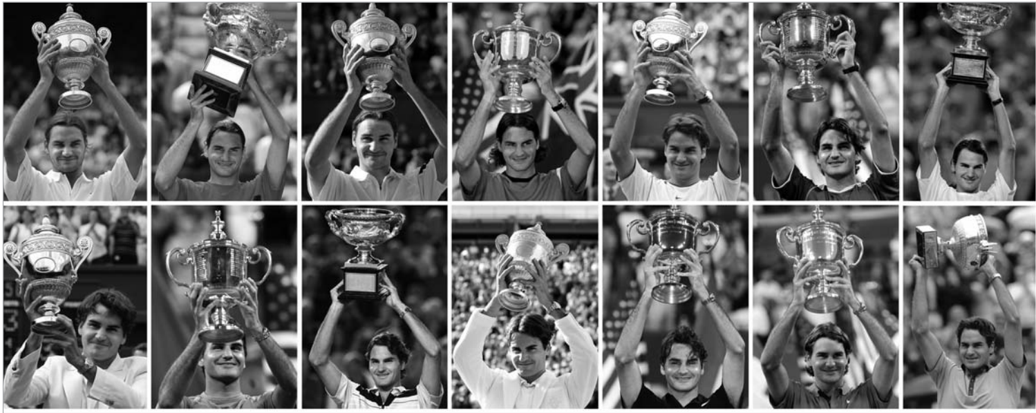
ფედერერი ოთხხმეტევი დიდი სლემით