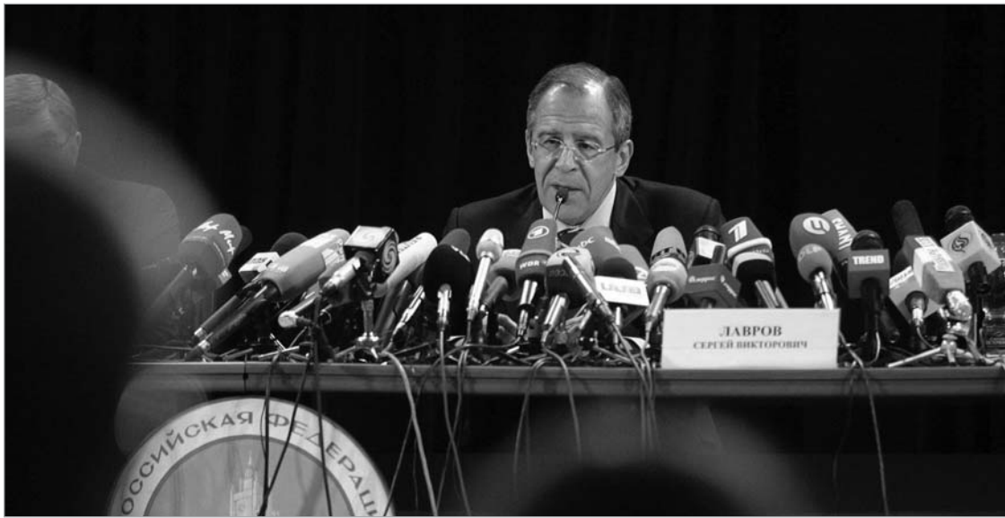
სერგეი ლავროვი შერბილებულ განცხადებას აკეთებს

მწვავე პოლიტიკურ განცხადებებს ამჯერად ოფიციალური მინსკიც ერიდება. ბელარუსის საგარეო უწყების ხელმძღვანელმა სერგეი მარტინოვმა აღნიშნა, რომ ბელარუსი რუსეთის სანიტარიული სამსახურის გადანაცვლებას "პოლიტიკას ვერ ხედავს."