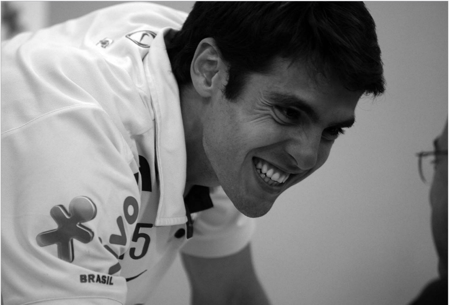
“რეალის” ფეხბურთელის რანგში კაკამ პრესკონფერენცია გამართა