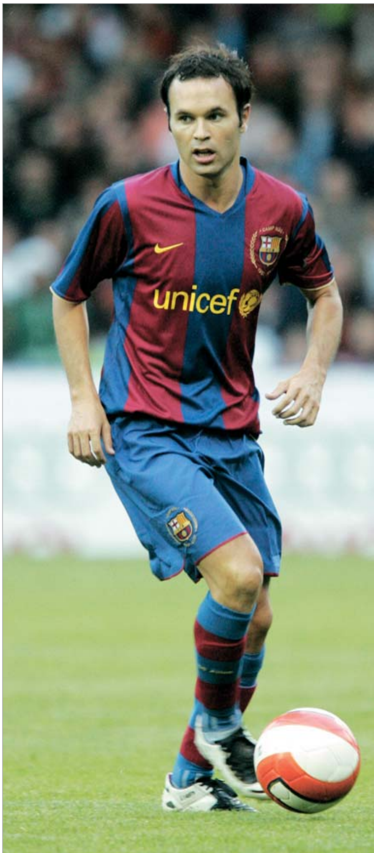
ინიესტა კატალონიურად ალაპარაკდა

- არ ვიცი, ეს მწვრთნელის გადასაწყვეტია. მე უფრო ვარჯიშების მეთოდოლოგიაზე გავა-