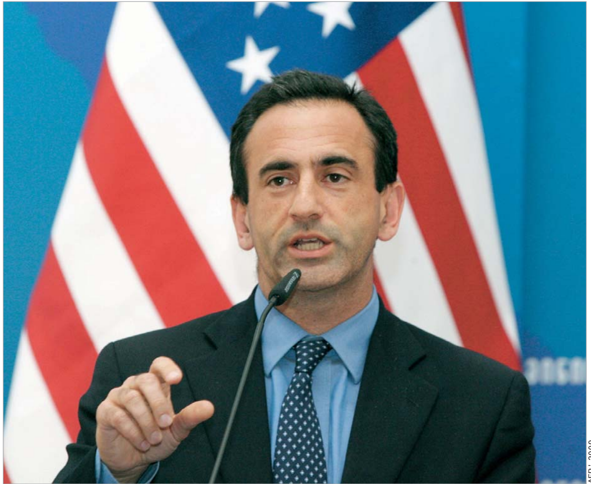
ფილიპ გორდონი: "აშშ მტკიცედ უჭერს მხარს საქართველოს სუვერენიტეტსა და ტერიტორიულ მთლიანობას"