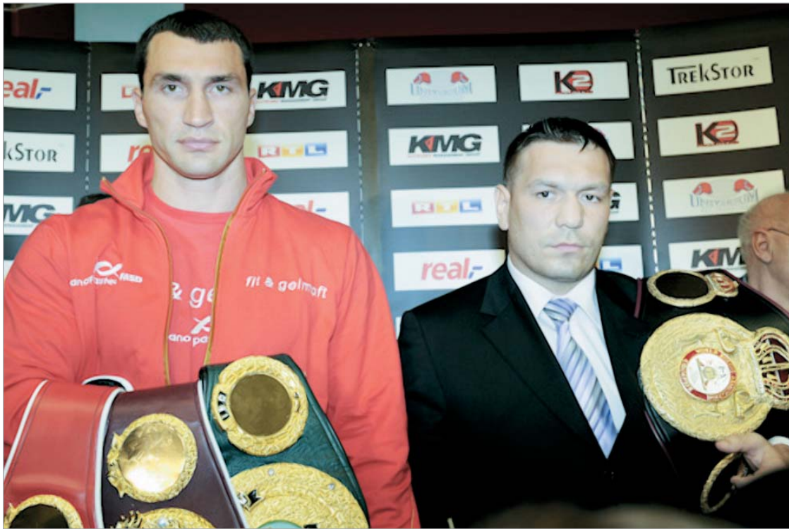
კლიჩკო და ჩაგაევი 20 ივნისს იჩხუბებენ

ვლადიმერმა ამერიკელებზე ჯერ კიდევ ვერ მოახდინა შთამბეჭდავი ეფექტი. ერთადერთი, რაც მას სჭირდება, ის არის, რომ გამანადგურებელი ნოკაუტი აგემოს, ვთქვათ, კრის არეოლისა და ალექსანდრ პოვეტკინის მსგავს მოჩხუბრებს. აი, ამის შემდეგ ამერიკა მიიღებს ვლადიმერს".