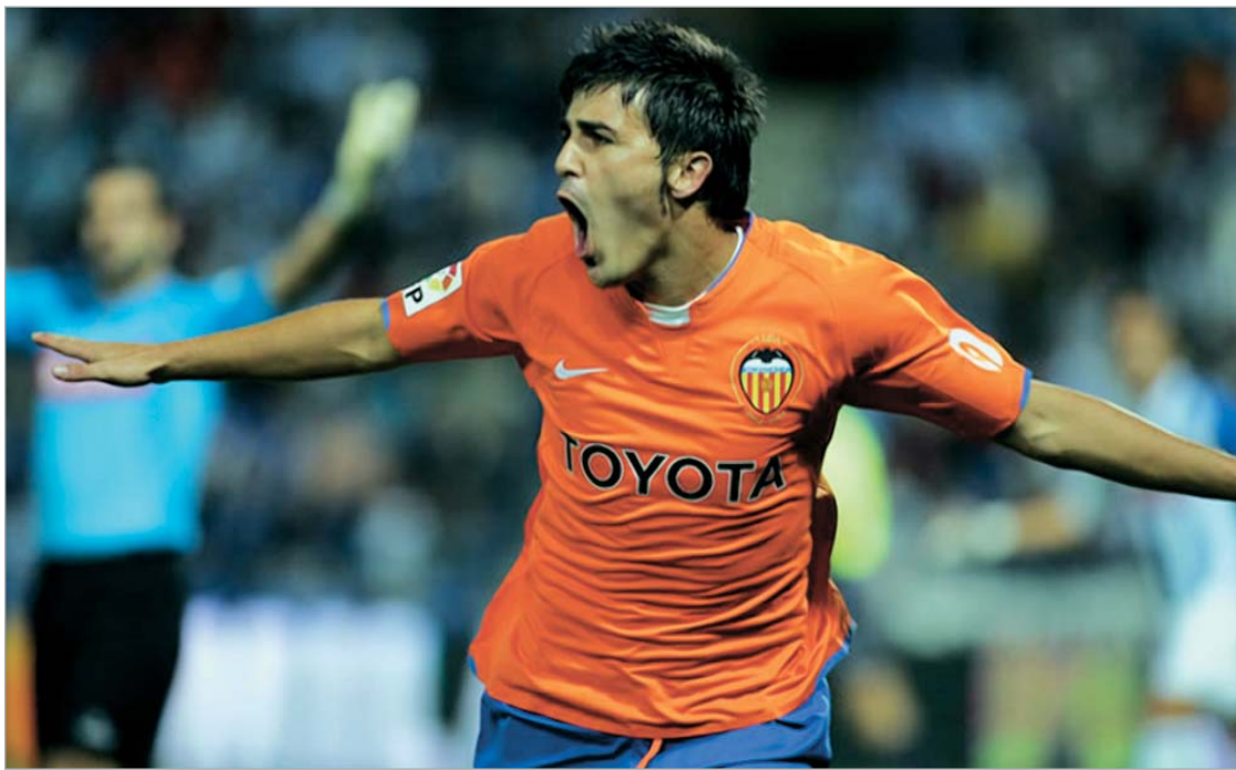
"მანჩესტერი" და "ბარსელონა" ვილიასთვის იბრძვიან

გუშინ კი ცნობილი გახდა, რომ საქმეში "მანჩესტერი" და "ბერსელონაც" ჩაერთვნენ. მანკუნინელს კარგი ფორვარდი სჭირდებათ, მით უმეტეს, რომ გუნდს ალბათ ტევესი დატოვებს (ამაზე ქვემოთ გეტყვით). თანაც ახლა "მანჩესტერს" ფუ-