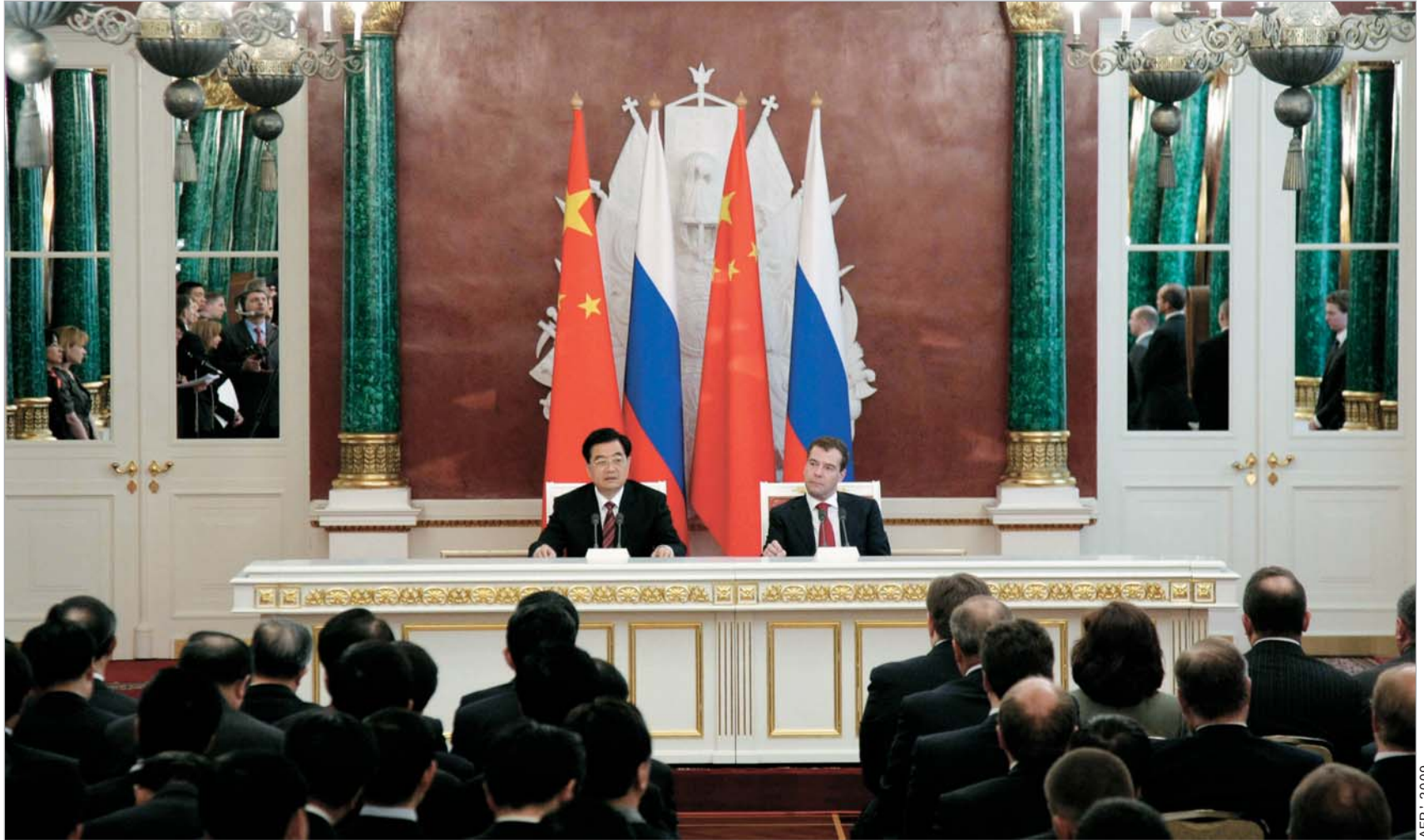
ხუ ძინტაოსა და დმიტრი მედვედევის შეხვედრა მოსკოვში

როგორც ჩანს, ხუ ძინტაომ პუტინთან და მედვედევთან შეხვედრისას გაზის მიწოდების საკითხი განიხილა, მაგრამ ამ მოლაპარაკებებს არანაირი რეალური შედეგი არ მოჰყოლია, რადგან ამ საკითხზე ინფორმაცია უალრესად მწირი და ზოგადია. ოფიციალურად მხოლოდ ის გამოცხადდა, რომ შეხვედრის შედეგად ხელი მოეწერა ურთიერთგაგების შესახებ მემორანდუმს ბუნებრივი გაზის სფეროში თანამშრომლობისთვის. ხელი მოეწერა ასეთივე მემორანდუმს ურთიერთგაგების შესახებ ქვანახშირის სფეროში. რუსეთის და ჩინეთის ხელმძღვანელების თანდასწრებით ხელი მოეწერა აგრეთვე ურთიერთგაგების შესახებ მემორანდუმს კომპანია "რენოვას" ჯგუფსა და ჩინეთის ოქროს მომპოვებელ სახელმწიფო კორპორაციას შორის.