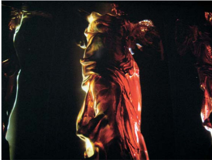
ანდრეი მოლოდკინის "წითელი და შავი".